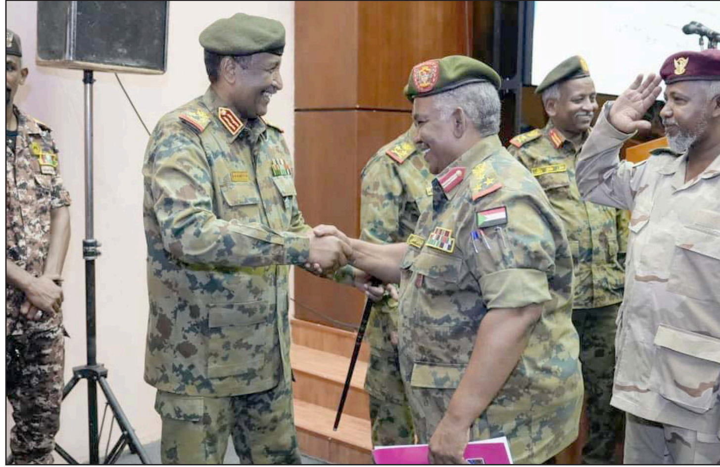
البرهان يصافح ضباطا في الجيش السوداني أمس

المواثيق السياسية للجان المقاومة والتنسيق للعمل الميداني الموحد والمشارك». وأعلنت عن تكوين لجنة فنية مشتركة من 5 ممثلين للميثاق الثوري لسلطة الشعب و5 ممثلين لتنسيقيات لجان مقاومة ولاية الخرطوم (ميثاق تأسيس سلطة الشعب) على أن تمثل الولايات غير الموقعة على الميثاق الثوري بممثل واحد لكل تنسيقية وتمثل التنسيقيات التي تؤولي طرحها في أول الموقعة على ميثاق تأسيس سلطة الشعب بممثل واحد عن كل تنسيقية. وحددت مهام اللجنة بالعمل على تبويب المواثيق وتحديد المستندات فيما بينها ونقاط الاختلاف، بالإضافة إلى تقديم صيغة مقترحة لنقاط الاختلاف يتم إرجاعها للقواعد لنقاشها وحسمها وفق جدول زمني. وكذلك تشمل مهام اللجنة وضع آلية تنظيمية مقترحة لتسهيل عملية حسم النقاط التي تحتاج نقاشاً في القواعد، وتجميع مخلصات النقاشات القاعدية وإعادة نشرها بموبة كنسخة نهائية لميثاق لجان المقاومة.