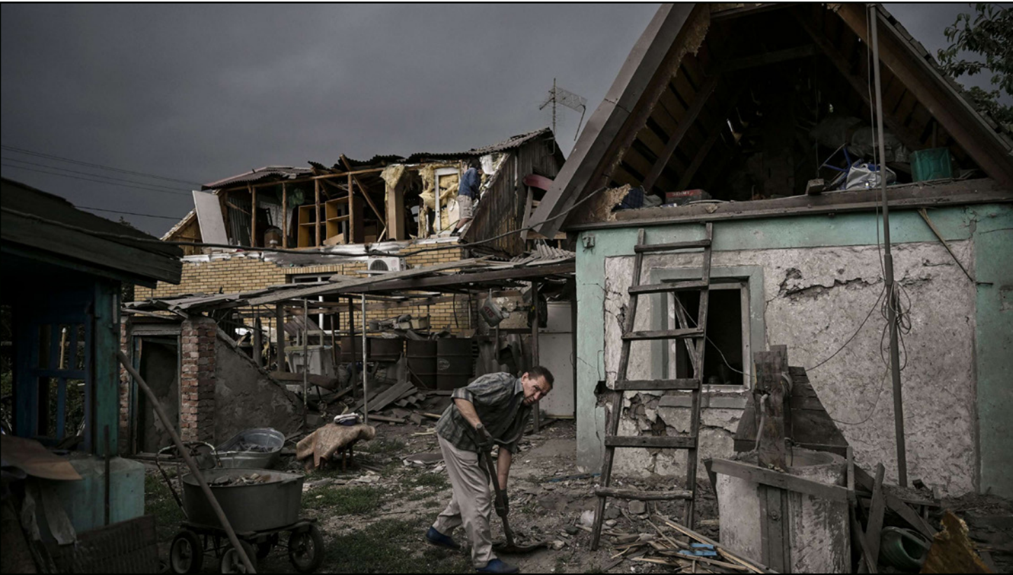
أوكراني يزيل ركام منزله المدمر إثر قصف في مدينة دوبروبيليا في منطقة دونباس شرق أوكرانيا

وقال زيلينسكي في كلمة في ساعة متأخرة من يوم الثلاثاء: "علينا أن نتحلى بالقسوة.. فكلما تكبد العدو المزيد من الخسائر، ضعفت قدرته على مواصلة عدوانه".