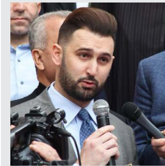
النائب تيمور جنبلاط

السياسية» تشرف على تنفيذ الخطة المرحلة الانتقالية بما يحقق إلغاء قاعدة التمثيل الطائفي، وتحرير التمثيل الشعبي من قيود الطائفية السياسية، واقتراح قانون جديد للانتخابات النيابية خارج القيد الطائفي، واعتماد الكفائية والاختصاص في الوظائف العامة والقضاء والمؤسسات العسكرية والأمنية والمؤسسات العامة والمختلطة والمصالح المستقلة».