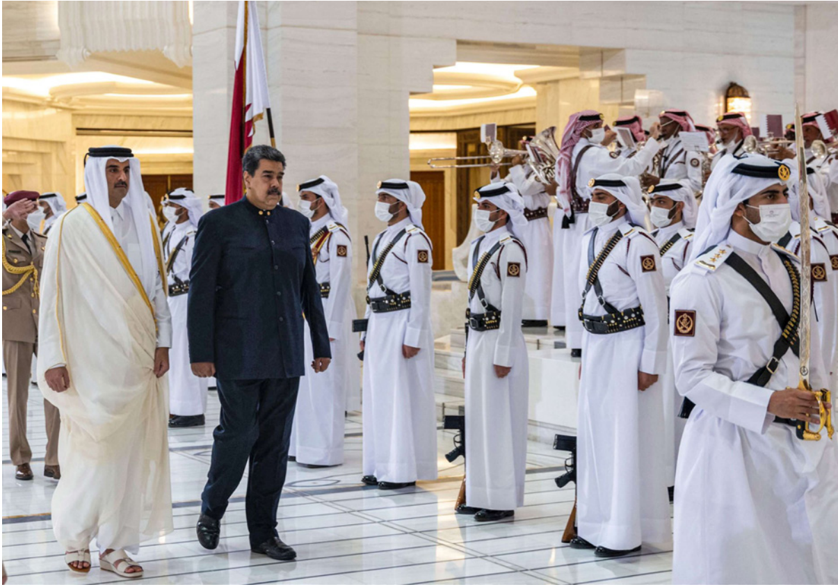
أمير قطر الشيخ تميم بن حمد آل ثاني مستقبلاً الرئيس الفنزويلي نيكولاس مادورو في العاصمة الدوحة

قطرية أن الزيارة الرسمية للرئيس نيكولاس مادورو رئيس جمهورية فنزويلا البوليفارية إلى الدوحة، تكتسب أهمية متميزة. وتكتسب الزيارة أهمية خاصة نظراً للعلاقات الوطيدة بين البلدين، وكذلك بسبب التطورات الدولية الراهنة والموقع المتميز الذي تحتله دولة قطر وجمهورية فنزويلا على عرش قطاع الطاقة العالمي. وترتبط دولة قطر وجمهورية فنزويلا البوليفارية بعلاقات تعاون تاريخية جيدة، وصدقية قوية تطورت وتعمقت على مر السنين، وقد شهدت هذه العلاقات خلال السنوات الأخيرة، تقدماً كبيراً في العديد من المجالات من خلال تبادل الزيارات رفيعة المستوى بين البلدين.