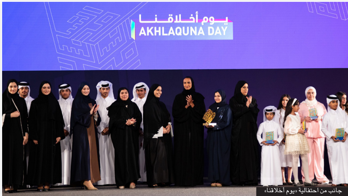
جانب من احتفالية يوم أخلاقنا.

وشهدت الفعالية الإعلان عن الفائزين بجائزة «براعم الأخلاق»