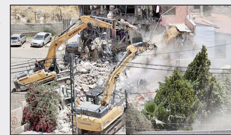
قوات الاحتلال تهدم المنزل في القدس

ورصدت عبر تقارير المتابعة، اعتقال الاحتلال نحو 450 طفلاً فلسطينياً منذ مطلع العام الحالي، منهم 353 طفلاً من القدس، ويشكلون الغالبية العظمى، وما نسبته (78.4%) من إجمالي الأطفال الفلسطينيين الذين تعرضوا للاعتقال هذا العام.