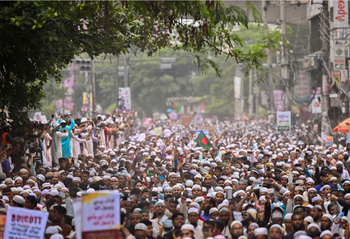
انصار الأحزاب الإسلامية في بنغلاديش يحملون لافتات مناهضة للهند خلال مظاهرة في دكا