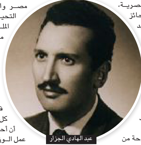
عبد الهادي الجزار

وقد قررت وزيرة الثقافة وضع اللوحة في متحف الفن الحديث لتكون إضافة إلى مقتنياته الثمينة ووجهت الشكر للسيدة فيروز الجزار لإصرارها على أن تعود اللوحة مرة ثانية لوزارة الثقافة وأن تكون متاحة للجمهور في مصر والعالم وكذلك وجهة التحية لأولاد محمد عبد الملك للمقاولات لسرعة مبادرتهم بتسليم اللوحة إلى ملاكها فور علمهم به وعدم تفريطهم في أحد كنوز الثقافة المصرية وأهدتهم درع وزارة الثقافة تكريماً لهم ولأسرتهم في الحفاظ على اللوحة كل هذه الفترة. وأكدت أن أحد محاور إستراتيجية عمل الوزارة هي الحفاظ على ما تملكه مصر من مفردات الهوية المصرية وكذلك العمل على استرداد كنوز مصر المفقودة في الداخل والخارج وأثنت على رغبة حائز اللوحة في أن تسليهما إلى وزارة الثقافة.