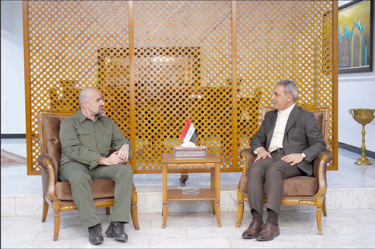
طالباني مستقبلاً زيدان أمس

الرئيس الراحل جلال طالباني، ونحن متأكدون من أن الاتحاد الوطني الكردستاني سيواصل طريقه على ذلك النهج. ودعا طالباني، زيدان، إلى «لعب دوره التاريخي، وأن يكون حامياً لحقوق جميع العراقيين بقومياتهم وأطيافهم، وأن يكون مساعداً وداعماً للدفاع عن حقوق إقليم كردستان القانونية والدستورية».