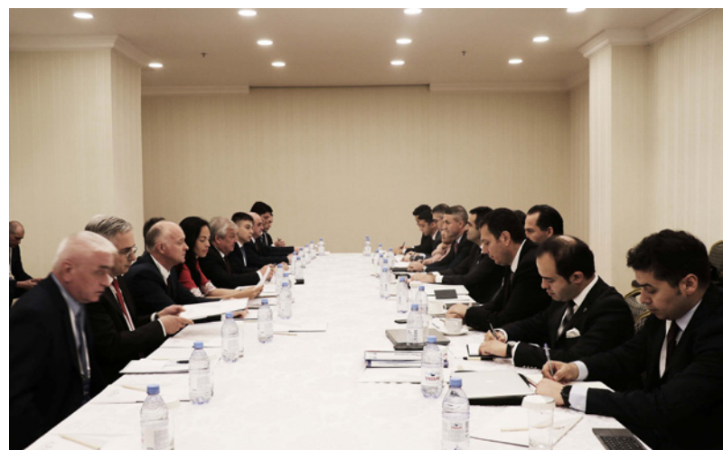
جانب من اجتماعات «أستانة 18» في كازاخستان

ويتراس وفد المعارضة أحمد طمعة، بينما أيمن سوسان، في حين يترأس وفد روسيا المبعوث الخاص للرئيس الروسي إلى سوريا الكسندر لافرتنييف، ومن الجانب التركي، ورئيس قسم سوريا في وزارة الخارجية السفير سلجوق أونال. أما من الجانب الإيراني فيتزاس الوفد مستشار وزير الخارجية للشؤون السياسية علي أصغري حاجي. كما يشارك في الاجتماع وفد من الأمم