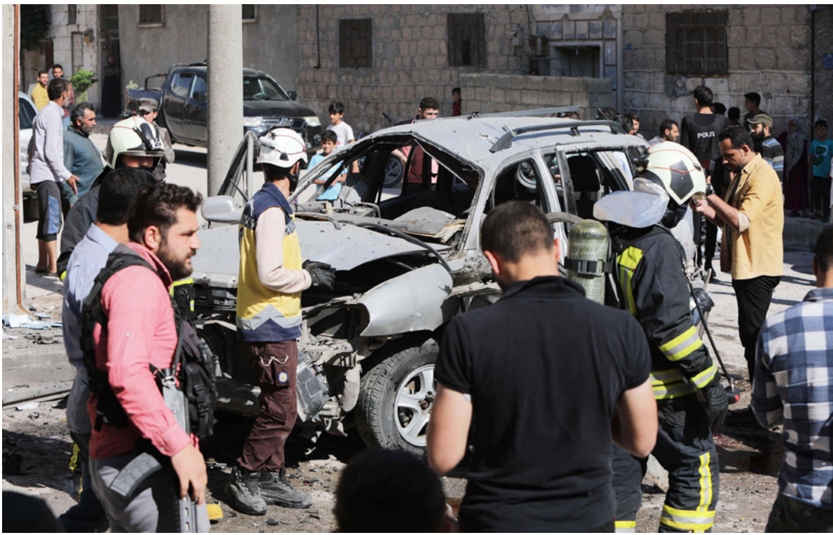
لقطة لتفجير مدينة الباب شمال سوريا

هويتها، واستطاع الجيش التركي عبر عملية «دع الفرات» التي أطلقها في 24 أغسطس/ آب 2016، تطهير 2055 كيلومتراً مربعاً من الأراضي شمالي سوريا، من العناصر المصقفة في تركيا إرهابية، بينها مدينة الباب، وينفذ «واي بي جي» عمليات إرهابية بشكل متكرر في المناطق الآمنة التي أنشأتها تركيا شمالي سوريا، انطلاقاً من مدينتي تل رفعت ومنبج، وبلدة عين عيسى.