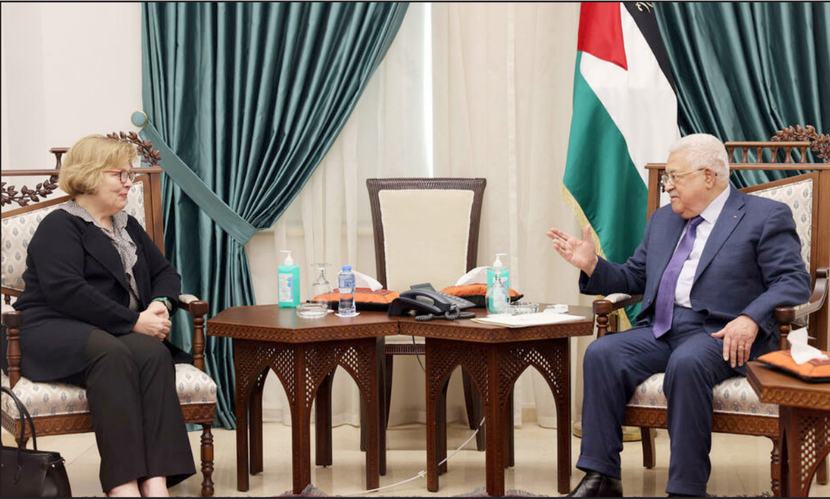
الرئيس الفلسطيني محمود عباس خلال لقائه مساعدة وزيرة الخارجية الأمريكية باربرا ليف في رام الله

الوفد الأمريكي يواصل لقاءاته في رام الله وتل أبيب تمهيدا للزيارة