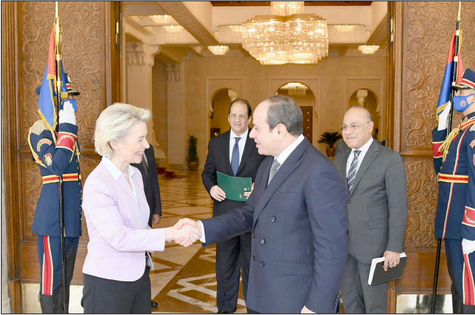
السياسي يصافح فون ديرلاين في القاهرة أمس