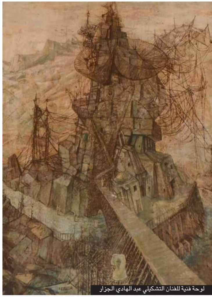
لوحة فنية للفنان التشكيلي عبد الهادي الجزار

وعثر هوراد كارتر على كنز توت عنخ آمون بكامل محتوياته دون أن تصل له يد للصوص على مدار أكثر من ثلاثة آلاف عام، إذ حوى الكنز المخبأ على مقاصير التوابيت وتمائيل الملك الصغير والمجوهرات الذهبية والأساسات السحرية والعادية والحاربيب الذهبية والأواني المصنوعة من الخنزف. وأعطت محتويات المقبرة لعلماء الآثار فرصة فريدة للتعلم في معرفة طبيعة الحياة في عصر الأسرة الثامنة عشرة - 150 - 1319 - قبل التاريخ والتي تعد فترة ذات أهمية خاصة في تاريخ مصر القديمة.