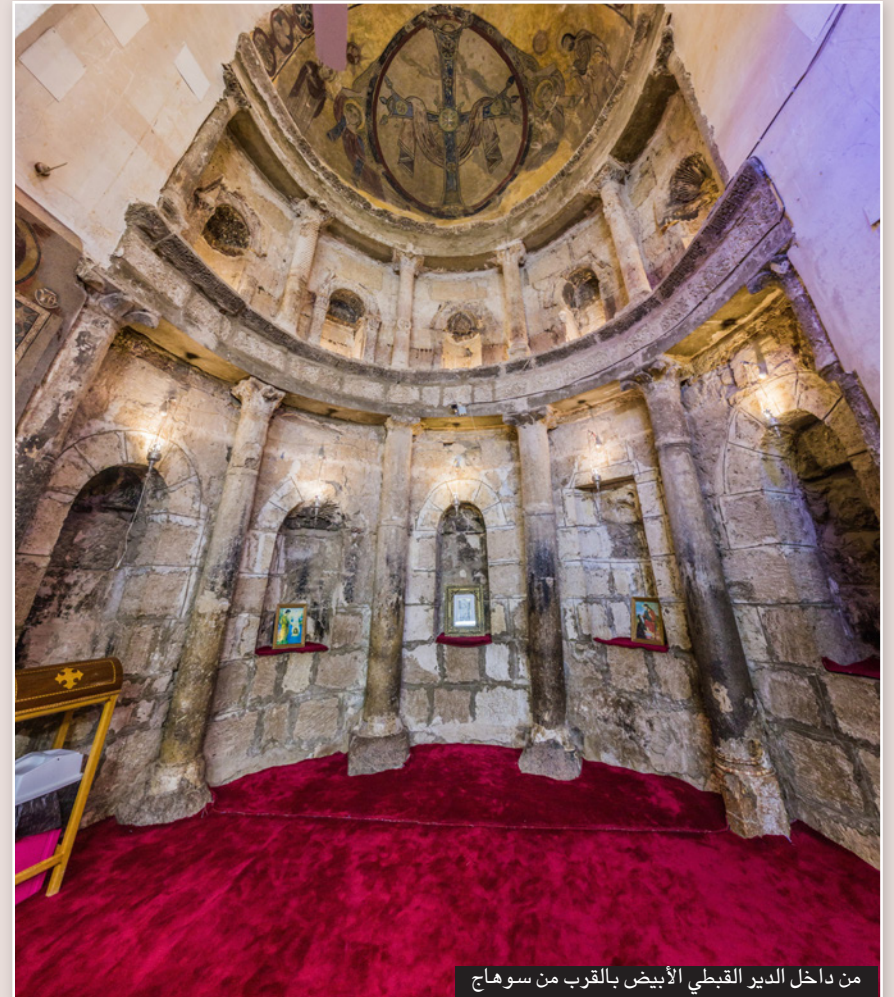
من داخل الدير القبطي الأبيض بالقرب من سوهاج

■ القاهرة - د ب أ: افتتحت متاحف المصرية، أن تسلط الضوء خلال شهر حزيران/يونيو الجاري على أهم مقتنياتها من الآثار القبطية، وذلك في إطار برنامج «قطعة الشهر» الذي يتم من خلاله اختيار أحد مقتنيات المتحف لتسليط الضوء عليها في كل شهر.