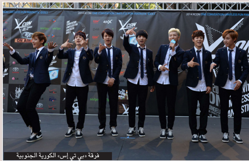
فرقة «بي تي إس» الكورية الجنوبية

يشعرون بتعب ويصبحون منهكين. ويستحقون الاستراحة والاستمتاع بما يحسون القيام به». وفي نهاية الخبر في اليوم التالي لي مون-وون لهذا الإعلان «الحبر» و«غير الواضح» وقال يبدو أن ما قصده أعضاء الفرقة هو أن «بي تي إس» ستواصل أعمالها الجماعية الجانبية (مثل عبر يوتيوب) تزامناً مع عمل كل واحد منهم على مسيرته الفنية دون التوقف عن إصدار البومات جديدة كفرقة.