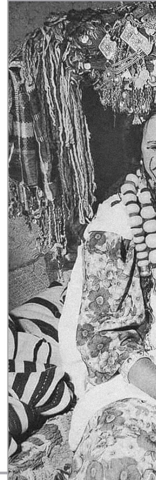
من فجر بني عداس

من يتعسر وجوه بعض فجر الجزائر يدرك بوجود تشابه خلقي مع فجر أوروبا الشرقية، فلأمره مثلاً قد تكون بلون قمحي وشعر أشقر وعينين خضراوين فهو جمال خارق متمرد طافح أنوفة وتمرداً وعفواناً، ما يؤكد رجوعهم إلى عرق واحد تفرق على جغرافيا العالم وأبي الاندماجي وفضل الترحال والحياة على حواف المدن، على ما فيها من قسوة وشظف عيش ومخاطر وانعدام كل مرافق الحياة، مقصين الطولة من حقها في التمدن وأنفسهم من كل تغلطة صحية، وقاء عجيباً لتقاليد الآباء والأجداد في التمرد والحياة بعيداً عن كل الالتزامات الاجتماعية مع الرفض الصارم للاعتراف بالمؤسسات، وكل أشكال السلطة