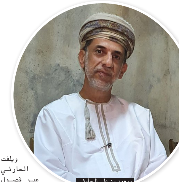
سعود بن علي الحارثي

وأما المؤلف سعود بن علي الحارثي، فقد رأى من خلال مقدمة كتابه، أن الذاكرة هي الحافظة لإبداعات الأمم، وإنجازاتها وتحولاتها ومكتسباتها المتراكمة والحتمشة تفاصيلها عبر التاريخ، لتقدم إضاءات تثير لأجيال طريق المستقبل وتحفز على المزيد من الإبداع، والعمل، والإنتاج، والابتكار.