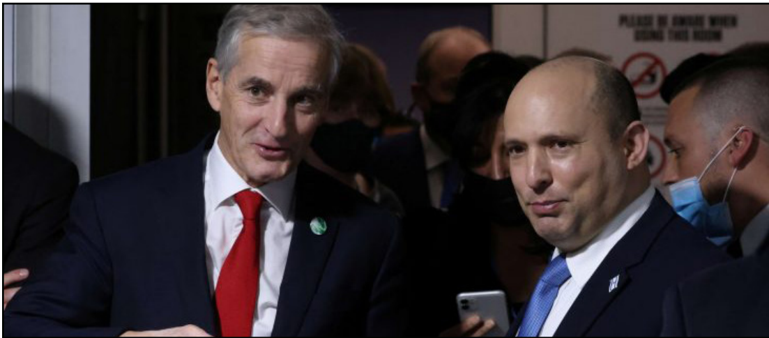
رئيسا الوزراء الإسرائيلي والنرويجي خلال لقاء سابق

تضطر إلى ضم مئات آلاف السكان العرب والتصادم مع الولايات المتحدة، هي تفضل الاحتفاظ بأراضي الدولة كوصية، وتفضل فيها ما تتساء، لشدة الوفاة، اليمين الاستيطاني يجند اتفاق أوسلو من أجل الاعاء بان إسرائيل تحرص على السيطرة على مناطق "ق" فقط، التي كما نذكر هي 60 في المئة من أراضي الضفة الغربية. من يتذكر أن سريان مفهول اختراع مناطق "ب" و"ج" كان يجب أن ينتهي في الألفية السابقة، وأن يخلي مكانه لاتفاق دافئ؟ القانون الدولي والنزاهة الأساسية يلزمان الوصي، القائد العسكري في هذه الحالة، بالحفاظ على "أراضي الدولة" وتطويرها لصالح السكان الفلسطينيين المحليين. حتى المحكمة العليا قالت إن الحكم العسكري ملزم بالاهتمام بسكان المناطق المحتلة. عمليا، جميع "أراضي الدولة" مخصصة الآن في يد السلطات المحلية للمستوطنات، وهي في مجال سلطاتها القانونية، المعنى، أن الفلسطينيين الذين يشككون 88 في المئة من سكان الضفة، كان محظورا عليهم مسبقا استخدام هذه الأراضي، حتى قبل تخصيصها لأي استخدام آخر.