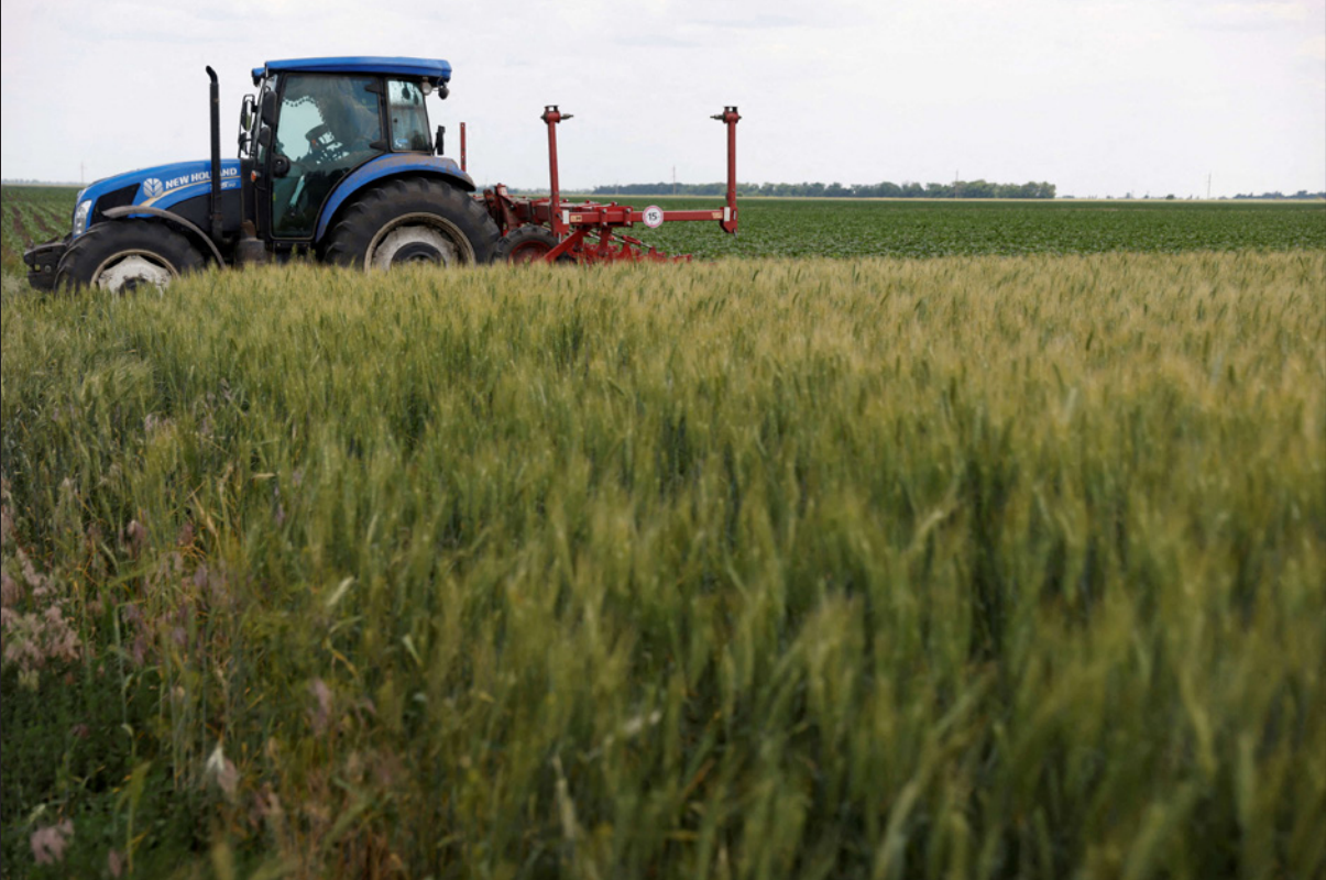
أحد حقول القمح الأوكرانية خارج منطقة ميكولايفيت

بشأن الطعام، زادت آثاره السلبية على البلدان النامية، وبالتالي تحسن موقفها التفاوضي في الحرب الأوكرانية. وحصل رئيس المفوضية الأوروبية شارل ميشيل روسيا مسؤولة أزمة الغذاء العالمية، قائلاً إنها «تستعمل الإمدادات الغذائية سلاحاً خفياً ضد الدول النامية، وتدفع بالناس إلى الفقر». وأضاف أن «تبعات الحرب الروسية أخذت في التوسع عبر العالم، وهذا ما أدى إلى ارتفاع أسعار الغذاء، ودفق بالناس إلى الفقر، وأدى إلى زعزعة الاستقرار في العديد من المناطق». في المقابل، ثمة ما يوسع أمريكا فعله تجاه أزمة الحبوب، فكما أوزعت إلى شركائها العلاقة بالانسحاب من السوق الروسية، بإمكانها أن تطالب من الشركات الكبرى الأربع التي تتحكم في توريد الحبوب الغذائية وشحنها وتخزينها، آرثرش دانيلز ميدلاند، ويونغ، وكارجيل، ولويس دريفوس، بأن تزيد كمية عرض الحبوب في الأسواق. وأعلنت تركيا عن تقدم كبير في الجهود الرامية إلى استئناف عمليات تصدير الحبوب ومنحجات زراعية أخرى من أوكرانيا. وقال وزير الدفاع خلوصي أكار إنه تحدث مع نظيره الروسي سيرغي شويغو في إطار جهود وساطة أنقرة بهدف التوصل إلى ممر آمن للصادرات عبر الموانئ.