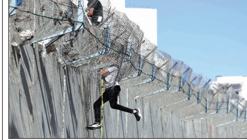
شاب يهبط على حبل عبر الجدار العنصري في بلدة بيت حنينا بعد صعوده من قرية الرام أمس

ثمة غضب شديد يجتاح أوساط السلطة الفلسطينية بعد تناكها من استثناء القضية الفلسطينية من جدول أعمال زيارة الرئيس الأمريكي جو بايدن لمنطقة الشرق الأوسط، على عكس ما كانت عليه التوقعات. وتهدد السلطة بتفعيل وتطبيق قرارات المجلس المركزي، وبدات الاستعدادات للزيارة التي تبدأ غداً الأربعاء، ولا تشمل العاصمة السياسية الفلسطينية بل بيت لحم، حيث يستقبله الرئيس محمود عباس، الغاضب من السياسة الأمريكية لتجاهلها للاوضاع السيئة والتهديد في الأراضي الفلسطينية، وما يقوم به المستوطنون بغطاء من جيش الاحتلال.