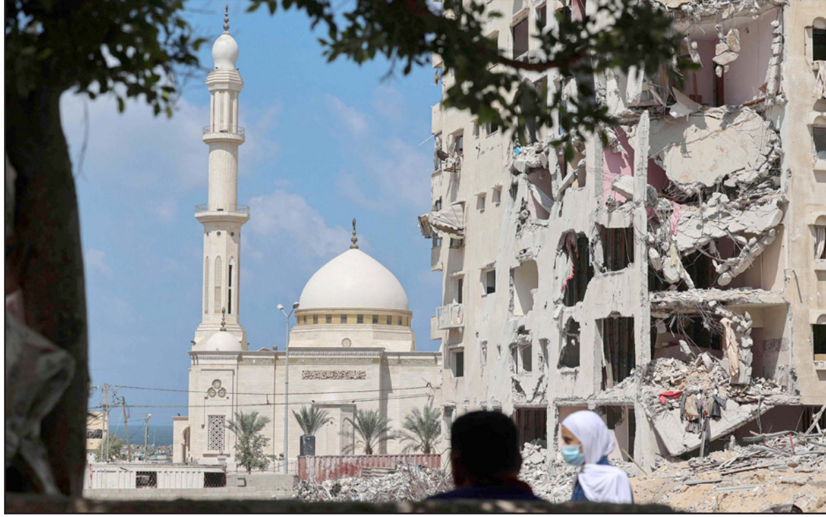
بنية مدمرة جراء الحرب الأخيرة على غزة

وقبل أيام أعلنت «الأونروا» أنه في إطار استمرار جهودها لإعادة إعمار المنازل التي دُمرت بالكامل خلال صراع مايو 2021، تم تحويل دفعات مالية مقدمة لـ 101 عائلة جديدة من تضررت منازلهم بشكل كامل خلال تلك الحرب، وذلك لتمكينهم من إعادة إعمار منازلهم المدمرة، بالإضافة