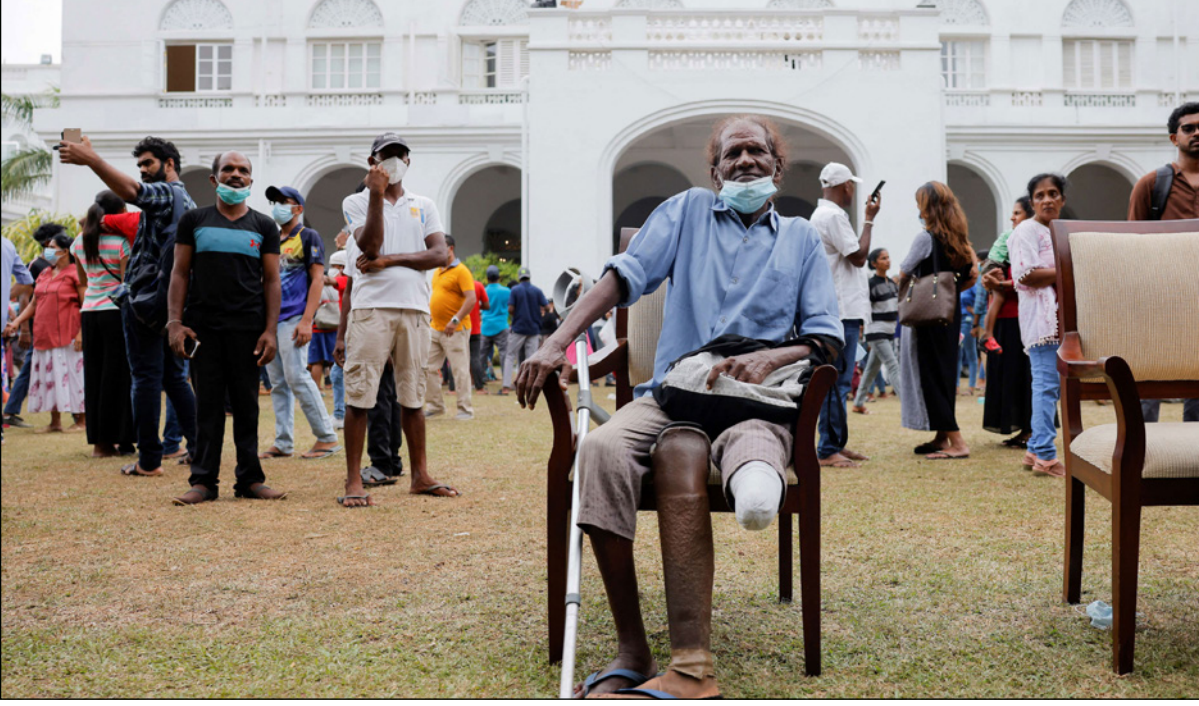
رجل جالس في حديقة القصر الرئاسي بعد اقتحام المظاهرين للمبنى في العاصمة السريلاانكية كولومبو وفرار الرئيس غوتابايا راجابكسا

ويجري حزب المعارضة الرئيسي «سماعي جانا بالابوياغا»، محادثات مع مجموعات سياسية أصغر الإثنين لضمان الدعم لزعيمه ساجيت بريناداسا. وقال مسؤول في الحزب إنه تم التوصل إلى اتفاق مبدئي مع مشيقي من حزب راجابكسا لدعم بريناداسا (55 عاماً)، الذي خسر في الانتخابات الرئاسية عام 2019. وبريناداسا