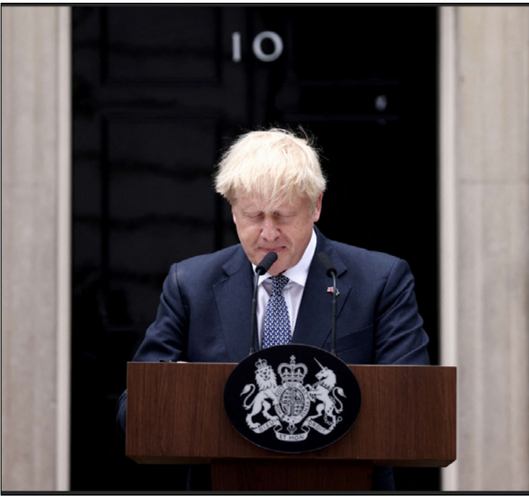
رئيس الوزراء البريطاني بوريس جونسون

لندن - أ ف ب: أعلن رئيس الوزراء البريطاني بوريس جونسون، أمس الاثنين، أنه لن يدعم أيًا من المرشحين الأحد عشر الذين يتنافسون لخلافته في سياق مفتوح يتوقع أن يتم تحديد جدوله الزمني الفاصل مساء الاثنين. وقال جونسون في أول ظهور علني منذ استقالته الخميس الفائت: «لا أريد أن أضر بفرص أي كان عبر تقديم دعمي».