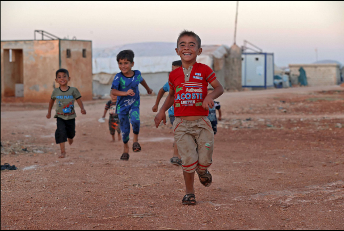
اطفال يلهون في مخيم للاجئين في إدلب

بمواجهة الحملة العسكرية التركية، حيث قال إن «خيارهم الوحيد هو المقاومة ضد أي هجوم محتمل». وفي تصريح لوسائل إعلام تابعة لقسد، تحدث القيادي الكردي عن آخر التطورات التي تشهدها ناحية تل تمر التابعة للحصنة على الصعيد العسكري، مشيراً إلى أن قوات قسد على أتم الجاهزية لجابهة أي حملة عسكرية للجيش التركي.