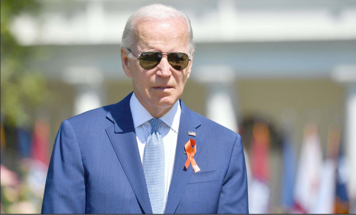
الرئيس الأمريكي جو بايدن

الرئيس بايدن للمنطقة، وقال «غير متفائلين من الزيارة، ومنتشكين منذ بداية الحديث مع مؤتمر وتحالف شرق أوسطي جديد، على غرار حلف الناتو) من أجل مواجهة إيران، كأنها هي الخطر الأوحد». وأكد أن المطلوب من بايدن هو «الإبقاء بكل الوجود التي قطعها للفلسطينيين خلال حملته الانتخابية، التي أكد عليها فيما بعد». وأشار إلى أنه في حال فشلت زيارة الرئيس الأمريكي، ولم تف وأشنطن بالتزاماتها فإن ذلك يعني ذهاب القيادة الفلسطينية نحو تطبيق قرارات المجلس المركزي في العلاقة مع إسرائيل والولايات المتحدة، وقال «ننتظر ماذا سيحدث بايدن في زيارته، وسنقابل الخطوة بخطوات». جدير بالذكر أن قيادة الفصائل والقوى الوطنية والإسلامية، قالت إن زيارة الرئيس الأمريكي للمنطقة تأتي بهدف توفير كل الدعم والإسناد للاحتلال وأضاعة مزيد من الوقت من أجل التهرب من أية التزامات تحدث عنها الرئيس والإدارة الأمريكية، ومحاولة فرض ترتيبات في قرارات المجلس المركزي الفلسطيني بالتخلص من كل الاتفاقات مع الاحتلال وسحب الاعتراف وترتيب وضعنا الداخلي بما يتناسب مع التمسك بالحقوق الفلسطينية والمقاومة ضد الاحتلال».