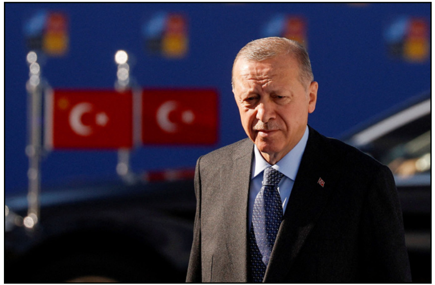
الرئيس التركي رجب طيب اردوغان

■ أنقرة - د ب أ: أكد الرئيس التركي رجب طيب أردوغان، نظيره الروسي فلاديمير بوتين، أن الوقت حان لكي تعمل الأمم المتحدة على تدشين ممر آمن لتصدير الحبوب عبر البحر الأسود. وجاء ذلك في اتصال هاتفي بين الرئيسين أردوغان وبوتين، أمس الإثنين، وفق بيان للادارة الاتصالي في الرئاسة التركية وأردته وكالة الأناضول التركية للأنباء. وأضاف البيان أن أردوغان وبوتين بحثا الأوضاع في سوريا والحرب الروسية الأوكرانية، وفتح ممر آمن لتصدير الحبوب عبر البحر الأسود. وأكد الرئيس التركي، حسب البيان، أهمية تمديد آلية المساعدات الأممية العابرة للحدود إلى سوريا. كما أكد أردوغان على أن الوقت قد حان لكي تعمل الأمم المتحدة على تدشين ممر آمن لتصدير الحبوب عبر البحر الأسود. وجدد الرئيس التركي ضرورة إنهاء الحرب الروسية الأوكرانية عبر سلام دائم وعادل عن طريق التفاوض، معرباً عن استعداده لقررة لتقديم كافة أشكال المساهمة لإحياء مسار المفاوضات بين موسكو