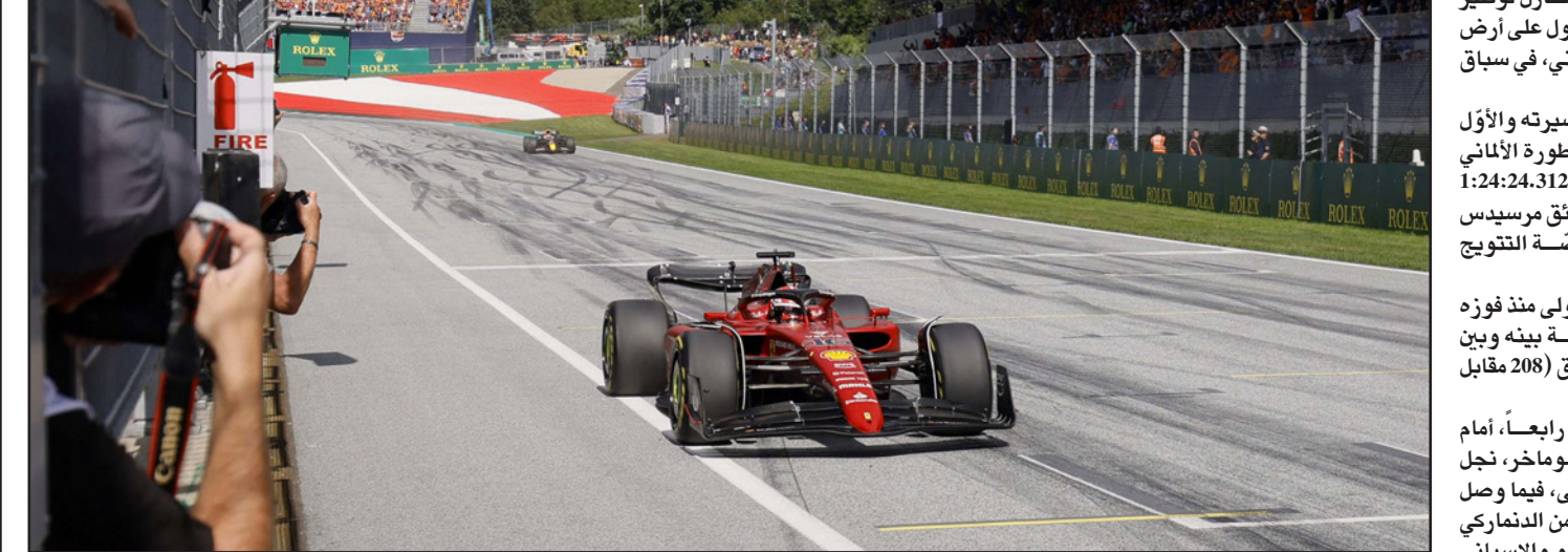
لحظة عبور لوكلير خط النهاية منتصراً أمام فيرستابن