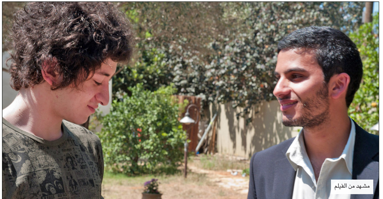
مشهد من الفيلم

جيش الاحتلال يجسد الصورة الصارخة لهذا التعسف، ويمثل أيضاً حواجز الهوية، التي لا يمكن اختراقها والتي نبنيها حول أنفسنا. ورغم ذلك فإن أسئلة الهوية والاختلاف التي تسردها المخرجة ليفي هي مسائل خيالية ولا تنتمي للواقع الصادم للجوازات والممارسات اللانسانية التي يقوم بها جنود الاحتلال ضد المدنيين الفلسطينيين العزل.