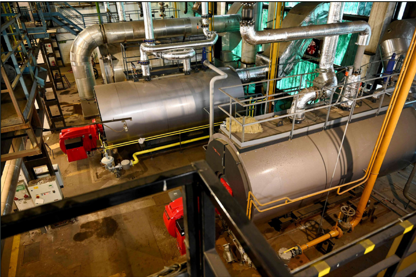
جانبا من معدات استخدام حرارة المياه الجوفية الساخنة لتوليد الكهرباء في سيغيد ثالث أكبر مدن المجر

■ سيغيد (المجر) - أف ب: في مدينة سيغيد المجرية، لم يتم