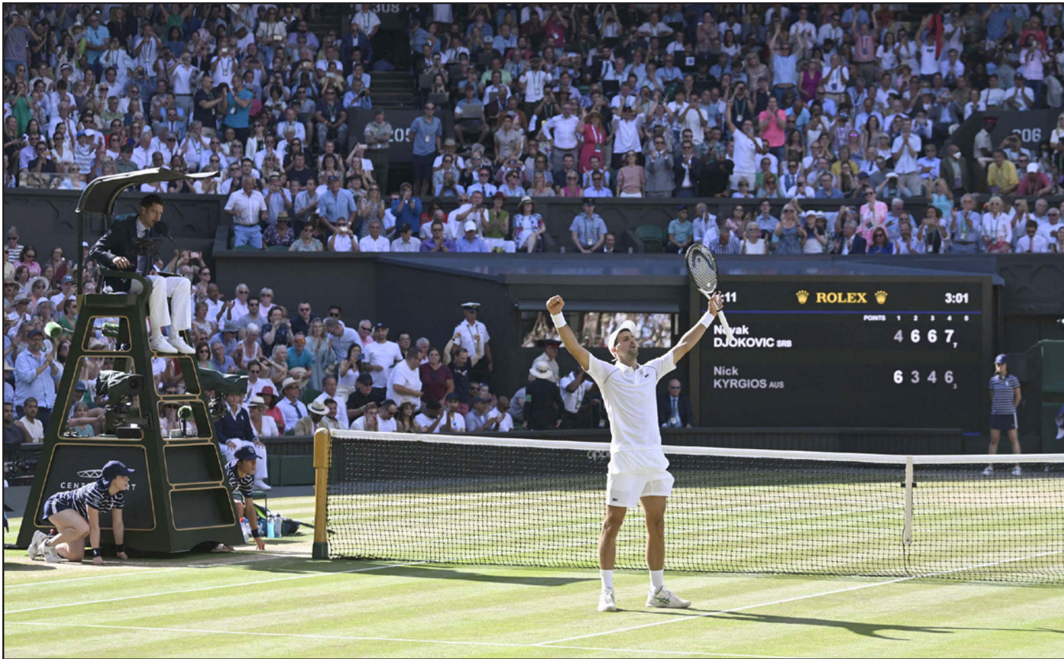
لحظة انتصار ديوكوفيتش على الاسترالي كيربوس ليحز لقب ويمبلدون