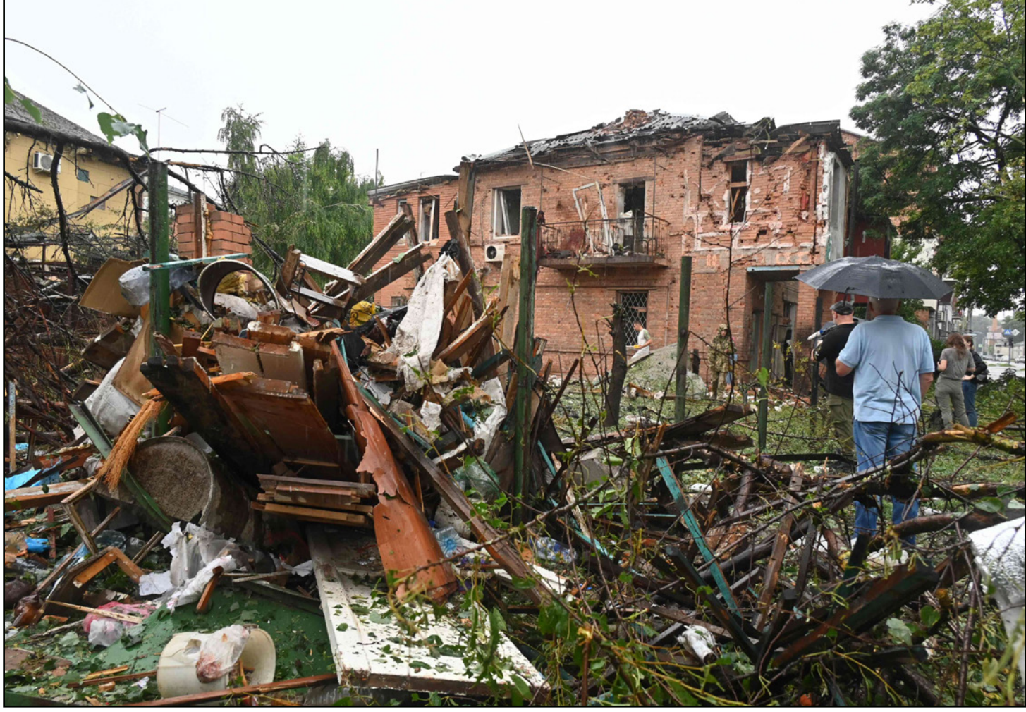
أشخاص ينظرون إلى أنقاض منزل دمره هجوم صاروخي على منطقة سكنية في خاركيف

مرسوم رئيس روسيا الاتحادية، مضميناً أن القرار المذكور يشكل تعدياً آخر على سيادة أوكرانيا ووحدة أراضيها، ويعارض مع قواعد ومبادئ القانون الدولي، كما دعت شركاءها لفرض عقوبات جديدة على روسيا وتكثيف إمدادها بالأسلحة الثقيلة لمعاينة موسكو على إصدار المرسوم.