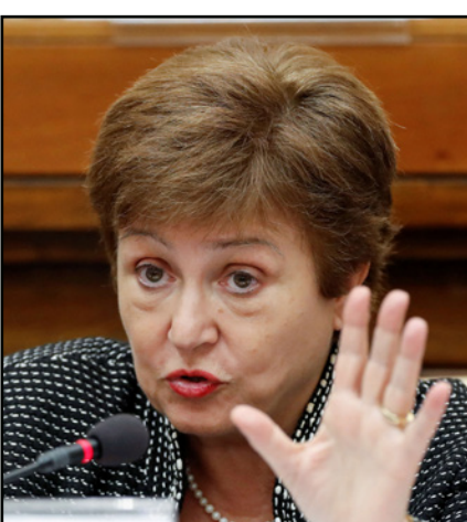
كريستالينا جورجييفا مديرة «صندوق النقد الدولي»

سيادي في العالم، ودائتي القطاع الخاص. وقالت جورجييفا أن ما يقرب من ثلث دول الأسواق الناشئة وما يزيد مرتين على تلك النسبة من الدول منخفضة الدخل تعاني من ضائقة ديون مع تدهور الوضع بعد قيام الاقتصادات المتقدمة برفع أسعار الفائدة. وأضافت أنه يجب الانفاق على تخفيف عبء الديون عن زامبيا وتشاد وإثيوبيا، وهي الدول الأفريقية الثلاث التي طلبت المساعدة بموجب عملية "الإطار المشترك" والتي تجتمع لجانها الدائنة هذا الشهر. وحثت الصين على تحسين التنسيق بين مقرضيها المتعددين محذرة من أن بكن ستكون "أول من يخسر بشكل كبير" إذا تحولت مشاكل الديون الحالية إلى أزمة كاملة.