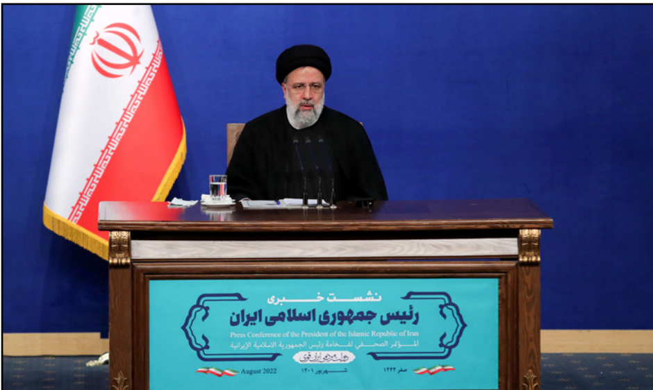
الرئيس الإيراني إبراهيم رئيسي أثناء مؤتمر صحافي عقده في طهران

وأنتح الرئيس الإيراني إبراهيم رئيسي أثناء مؤتمر صحافي عقده في طهران