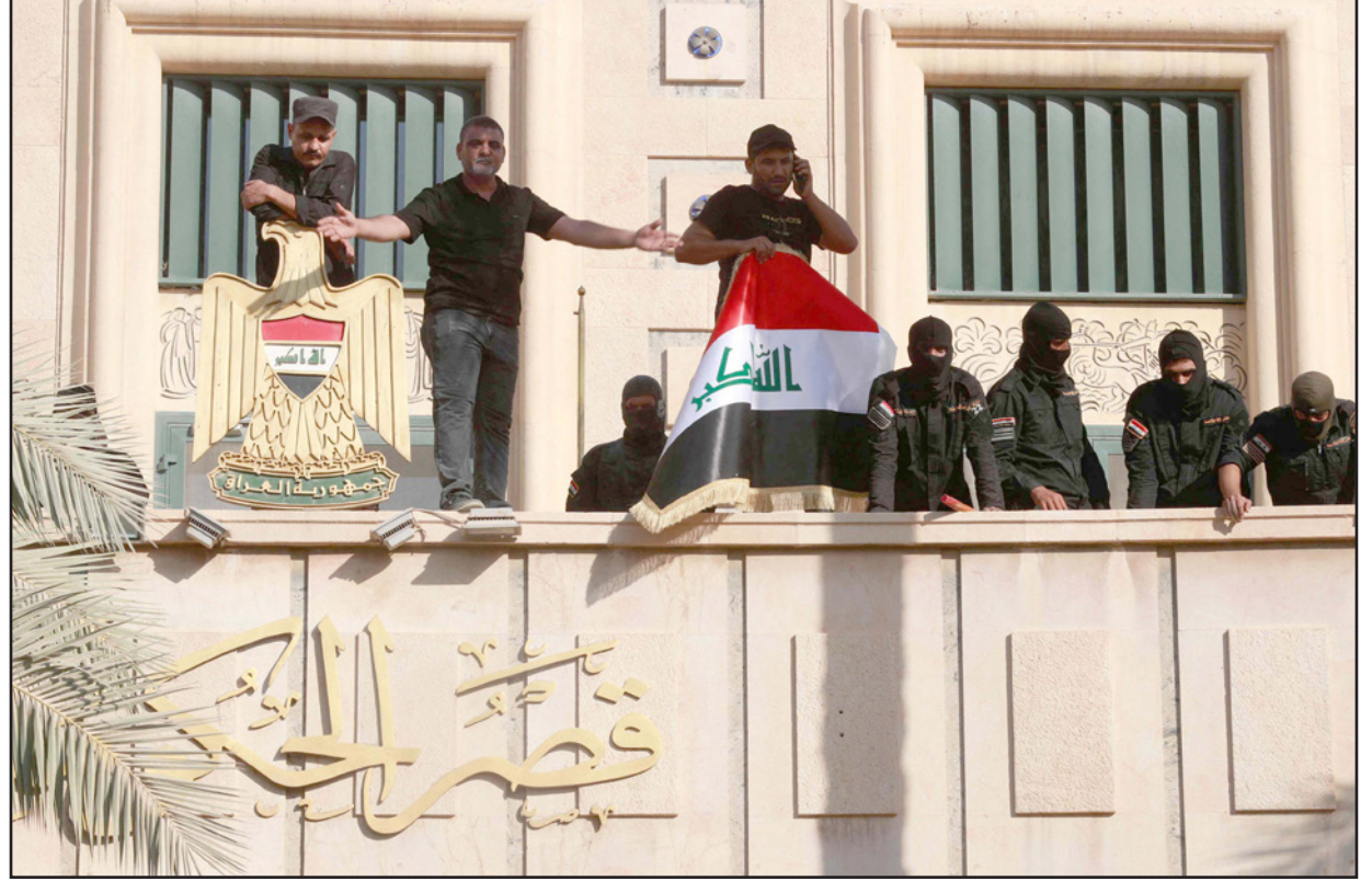
قوات الأمن قرب أنصار الصدر على شرفة مقر الحكومة العراقية

وفي مناسبات عدة، اتخذ الصدر قرارات مشابهة لقرار أمس، غير إنه سرعان ما عدل عنها وفقا للتطورات السياسية في هذا البلد المنقلب بالازمات. لكن في هذه المرة، جاء قراره تعقيبا على تلميذ رجل الدين الشيعي البارز، كاظم الحائري، المنتمي لحوزة قم الشيعية، والمؤمن بولاية الفقيه» أن الصدر «فاقد للاجتهاد والقيادة» وأنه يسعى للتفريق بين أبناء المذهب.