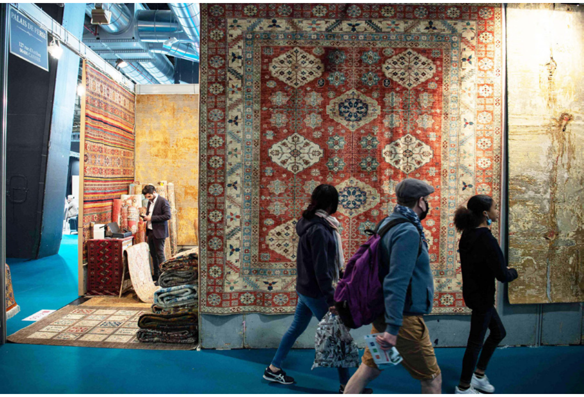
زوار معرض طهران الدولي للسجاد يشاهدون بعض المعروضات التقليدية