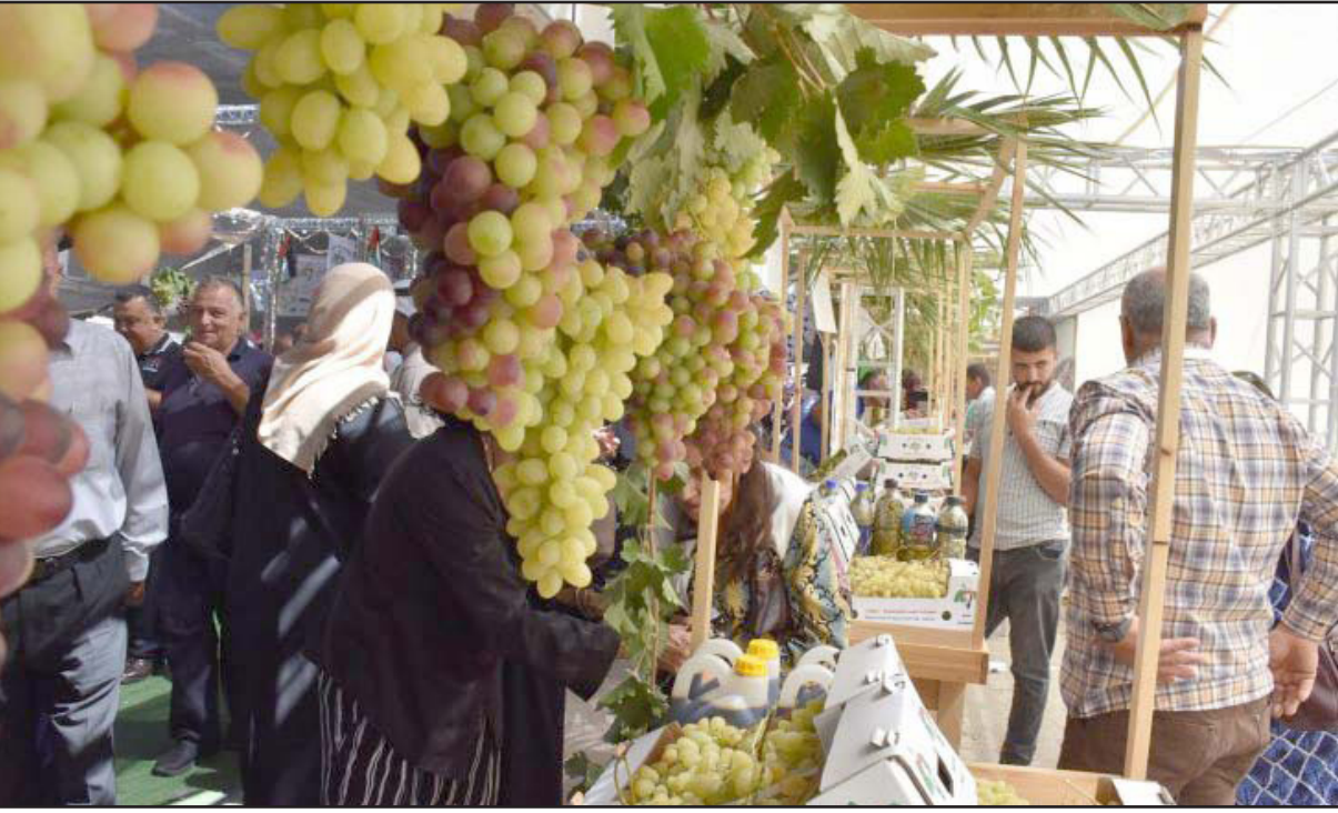
أرشيفية لمهرجان العنب الفلسطيني في الخليل

يقوم بدوره لإيجاد حلول من أجل تسويق العنب أو تصديره للخارج، أو أن تعمل على توفير مصنع للخمر في جنين، وذلك أضعف الإيمان من أجل استيعاب كميات العنب المتكدس في المزارع. وختم عريدي: «في حال فشلتم فنحن مضطرون لإتلاف مزارع العنب بما ينتج عن ذلك من خسائر فادحة للمزارعين». وحسب الجهاز المركزي للإحصاء الفلسطيني ووزارة الزراعة فإن إجمالي المساحة المزروعة في فلسطين خلال العام الزراعي 2021/2020 حوالي 1,096.3 دونم (منها 89.4% في الضفة الغربية، و10.6% في قطاع غزة) مقارنة بـ 911.6 ألف دونم خلال العام الزراعي 2010/2009 أي بارتفاع قدره 184.7 ألف دونم، وعلى مستوى المحافظات فإن أعلى مساحة مزروعة هي 281.2 ألف دونم بنسبة 25.6% في محافظة جنين من إجمالي المساحة المزروعة في فلسطين.