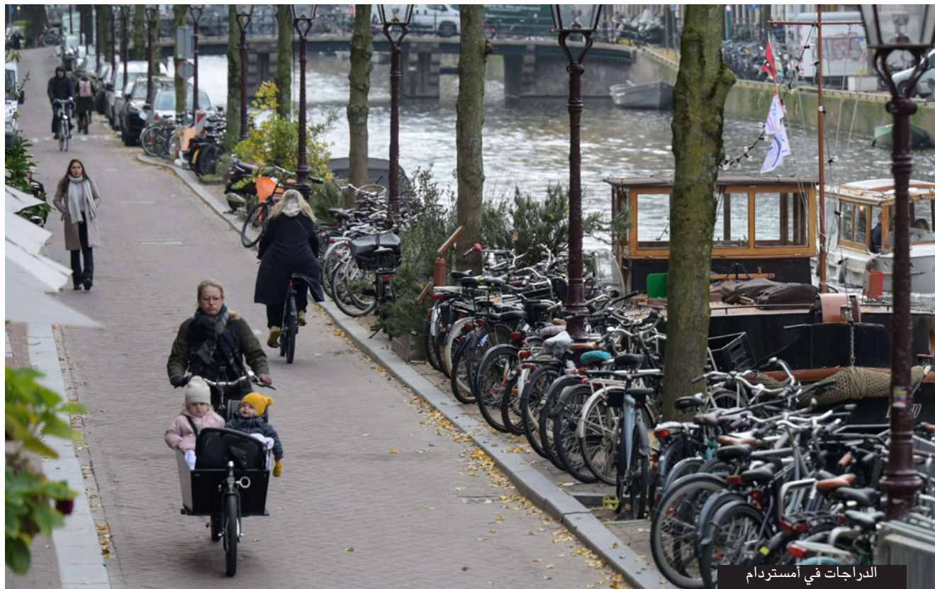
الدراجات في أمستردام

لديهم دراجة أيضاً. وتوضح أن تلك الموضة استمرت لفترة من الوقت، بينما كان ركوب الدراجات في ذلك الوقت أكثر صعوبة، في ظل وجود نوع آخر مختلف من البنية في المدينة، تمّ تم فيما بعد افتتاح مدارس لساواة الأفراد على تعلم ركوب الدراجات، من بينها قاعة خاصة في أمستردام، مبطنة بوسائد حتى لا يسحب متعلمو ركوب الدراجات في أي أنفسهم في حياض سقطوا أثناء تعلمهم. وفي الوقت نفسه، لا يزال أفراد العائلة الملكية في هولندا من عشاق ركوب الدراجات، حيث تقوم الأميرة أريانه بركوب الدراجة أثناء زيارتها إلى المدرسة في كل يوم. وبينما تتجول في أنحاء المدينة وعلى طول القنوات، يكون مسار الدراجات مزدهما