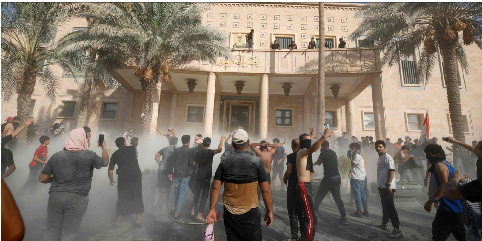
مؤيدون للزعيم الشيعي مقتدى الصدر يحتفلون باقتحامهم مقر الحكومة في المنطقة الخضراء في بغداد أمس