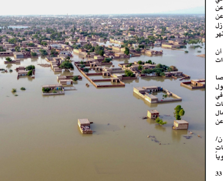
منطقة سكنية غمرتها المياه في إقليم بلوشستان الباكستاني

■ سوكر - أف ب: يواجه ملايين الأشخاص في مناطق شاسعة من باكستان فيضانات ناجمة عن الأمطار الموسمية هي الأسوأ خلال عقود أسفرت عن سقوط 1136 وجرف عدد اعداد لا تحصى من المنازل ودمرت محاصيل زراعية حيوية وتهدد بفيضانات النهر الرئيسي في البلاد. وأعلنت وزيرة التغيير المناخي، شيري رحمن، أن ثلث مساحة البلاد "تحت الماء حالياً" ما يمثل "أزمة ذات أبعاد لا يمكن تصورها". وأفادت هيئة إدارة الكوارث الإثنين أن 1136 شخصاً لقوا حتفهم منذ حزيران/يونيو عندما بدأ هطول الأمطار الموسمية، مضيفاً أن 75 شخصاً قُضوا في الساعات الأربع والعشرين الماضية. لكن السلطات لا تزال تسعى للوصول إلى قرى معزولة في الشملات الجبلية، بعدما اجتاحت مياه الأنهر التي فاضت عن ضفافها طرقاً وجسوراً.