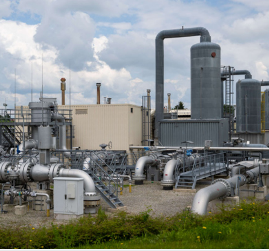
مشهد عام للتجهيزات فوق الأرضية لمنشأة تخزين الغاز التابعة لشركة «يونيبير» في بيريروانغ في جنوب ألمانيا

وأوضح مولر أنه تم إجراء تقييم للمخاطر مع شركاء صناعيين ألمان فيما يتعلق باستخدام الغاز الفرنسي، مضيفاً أن الهيئة ترى أن الخطورة لها ما يبررها في الوقت الحالي.