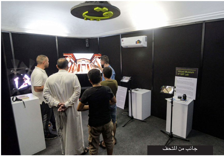
جانب من المتحف

واستطعنا من خلالها أن نعيد بناء الجامع»، ويضيف أن «هذه تعتبر طريقة لإنقاذ ذاكرة الموصل». ويقول الشاب بصعوبة المهمة بسبب «نقص الصور عن المواقع الأثرية، التصوير كان قليلاً قبل عام 2014. الحرب انتهت - في المتحف أيضاً، قطع تراثية كانت تتزيّن بها البيوت الموصلة التقليدية وبعض الأعمال الفنية التي تعكس تاريخ المدينة، جمعها القيومون على مدى ثلاثة أشهر، وتبرعت ببعضها عائلات من الموصل. حُفظت القطع خلف واجهات زجاجية، مثل جزار فخارية ملونة وجهاز راديو قديم، وفي قاعة أخرى، عرضت لوحات ومحتوات، وسجاد أحمر تراثي. ويشرح يونس أن «هناك أكثر من 100 قطعة تراثية كانت موجودة في بيوت السكان «أرادوا أن يحفظوها في مكان لائق، بعض القطع يتجاوز عمرها الخمسين والمئة عام».