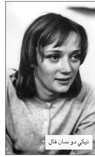
نيكي دو سان فال

■ في دنيا الفن الحديث والواقعية الجديدة، يتفرد المشروع الفني التشكيلية الفرنسية الأمريكية نيكي دو سان فال (1930-2002). مراحلها المختلفة وتوعدت في أعمال الرسم والنحت البارز والمجسم، والتوجهات الفكرية التي أرادت نيكي التعبير عنها، فكل عمل من أعمالها يحتوي على الكثير من الرسائل التي توجهها للعالم، والأفكار التي تعلن عنها، والأفعال التي تتخذها في مواجهة سلطة ما، أو ماض مشحون بالألام والخاوف. يظهر هذا من خلال مجموعة أعمال تندرج تحت تيمة معينة، أو مرحلة تتميز بأسلوب فني مبتكر، استحدثت طرقاً غير معروفة في الفن، وهناك بعض الأعمال المنفردة، التي يعد الواحد منها بمثابة مرحلة فنية كاملة، ومشروع فكري ضخم وفلسفة فنية خاصة، وتصور إنساني شامل يتجوهر فيه معنى الحياة والفن.