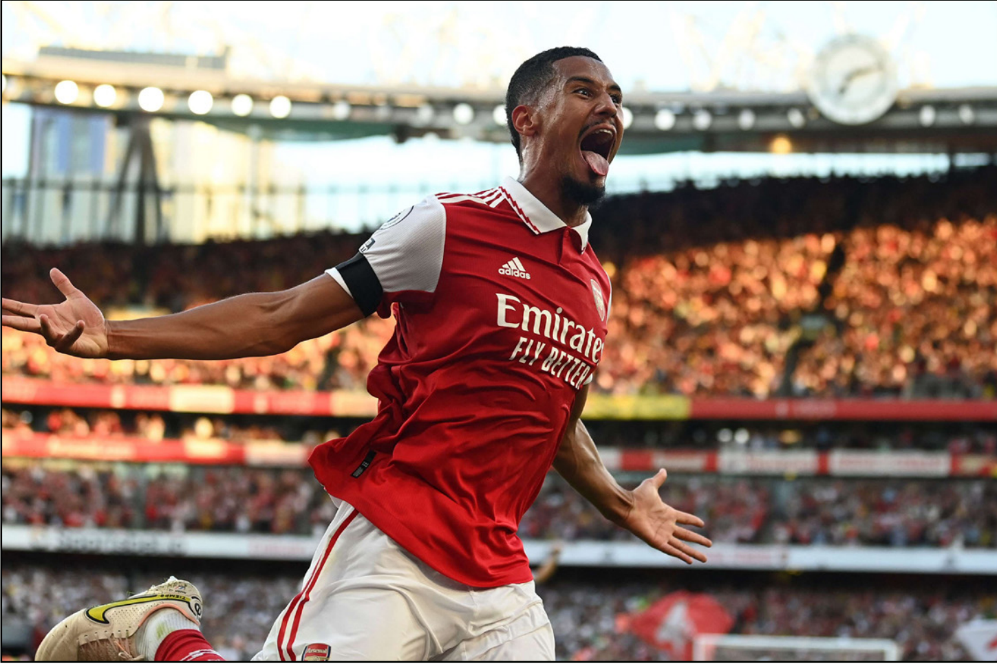
ساليبا يحتفل ببداية أرسنال الثأرية وانتصاراته المتتالية