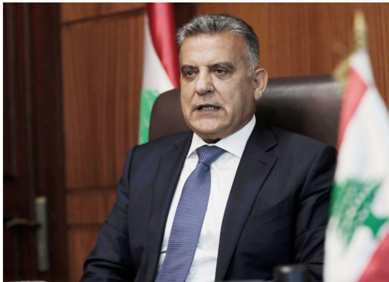
المدير العام للأمن العام اللبناني اللواء عباس إبراهيم

وأكد سفير المملكة العربية السعودية لدى لبنان وليد بخاري، الاثنين، أن بلاده تدعم تعزيز الوحدة والتقارب بين اللبنانيين. وقال خلال لقائه مفتي لبنان الشيخ عبد اللطيف دريان، إن السعودية «ترفض محاولات