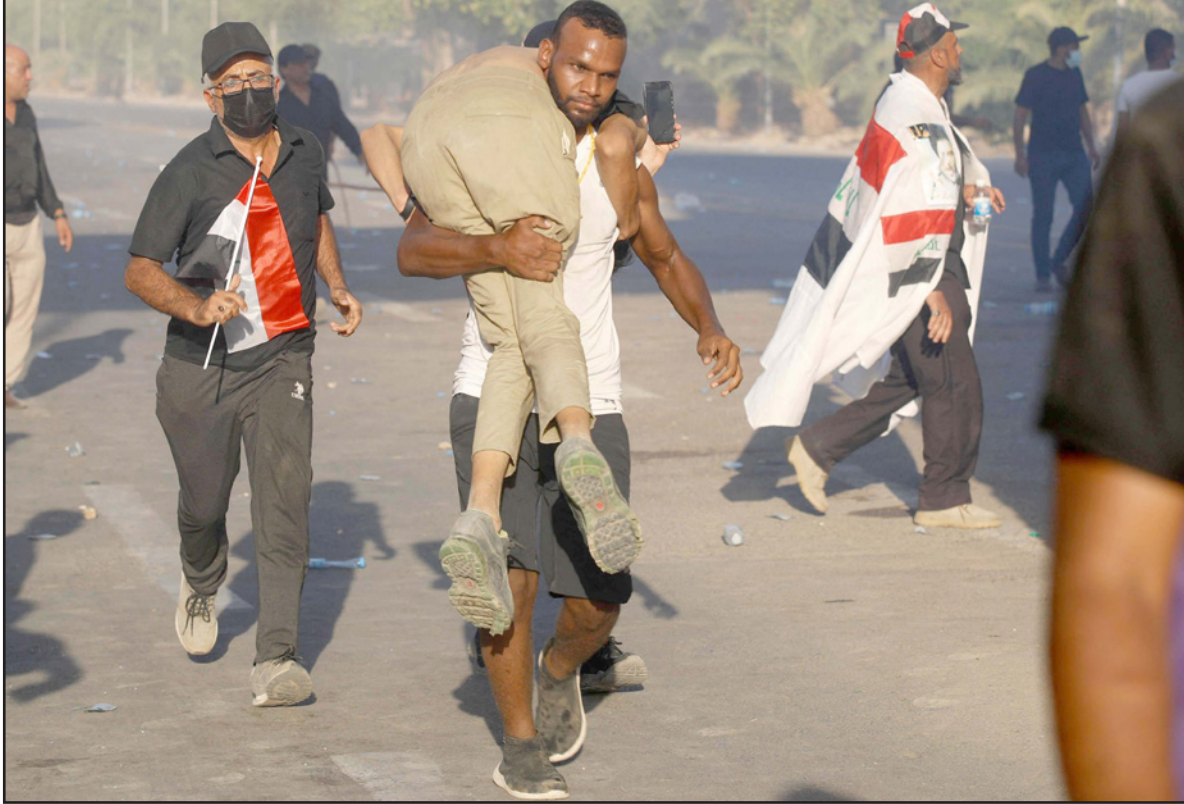
أنصار الصدر ينقلون مظاهرة مصابا خارج مقر الحكومة