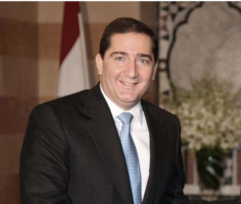
رئيس اللجنة الملكية الأردنية لتحديث المنظومة السياسية سمير الرفاعي

يقول سليمان، حسب اطلاعي على أحوال العوائل النازحة فإن النسبة الأكبر منها تتناول وجبة لحم واحدة أو أكثر في العام بحلول عيد الأضحى حيث تذبح الأضاحي، أما أيام السنة الأخرى فقد يحصلون على وجبة نديج كل شهرين أو ثلاثة، ومنذ عام 2020 وبعد جائحة كورونا زادت الأوضاع المعيشية صعوبة بعد أن «قلصت بعض الجمعيات والمنظمات مساعداتها، وزادت الأوضاع سوءاً منذ بدايات عام 2021 وإلى الآن حيث انقطعت جميع أنواع المساعدات التي أصبحت مقتصرة للسوريين فقط، كما بلغتنا عدد من الجمعيات والمنظمات التي كانت تقدم لنا بعض