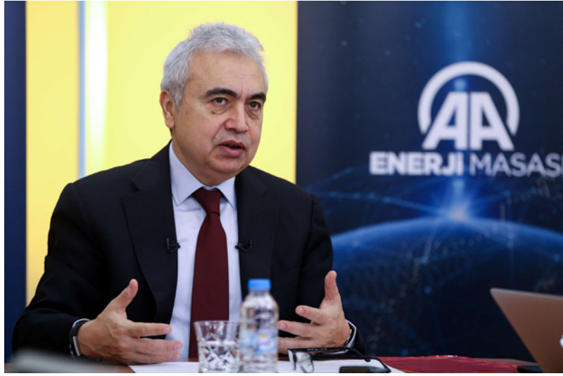
رئيس «وكالة الطاقة الدولية» فاتح بيروك

■ القاهرة - رويترز: قالت شركة «النفار» السعودية أمس الإثنين إنها وقعت مذكرة تفاهم لإنشاء مشروع لإنتاج الهيدروجين الأخضر بقيمة 3.5 مليار دولار في مصر. ويهدف المشروع إلى إنتاج 500 ألف طن من الأمونيا الخضراء التي تستخدم في الأسمدة الزراعية، وذلك من 100 ألف طن من الهيدروجين الأخضر سنوياً. والمشروع هو ضمن مذكرات تفاهم وقعت الأسبوع الماضي بين مصر وشركات عالمية، من بينها «غلوبيليك» و«أكسيس»، لإنشاء منشآت لإنتاج الهيدروجين الأخضر الأمونيا الخضراء في منطقة العين السخنة المصرية، وتسمى مصر، التي تستضيف مؤتمر الأمم المتحدة المقبل لتغير المناخ «كوب27»، لأن تكون من المراكز الإقليمية في إنتاج الوقود الأخضر. ووقعت مصر عدداً من مذكرات التفاهم في الأشهر القليلة الماضية، من بينها مذكرة تخص إنشاء منشأة لإنتاج الهيدروجين الأخضر بقيمة ثمانية مليارات دولار في «المنطقة الاقتصادية لقناة السويس»، ولم يتم الكشف عن أي تفاصيل تخص المشروع بما في ذلك موعد بدء التنفيذ. وتعمل «النفار» في مجال إنشاء مشاريع لتوليد الطاقة ونقلها، ويشمل ذلك الطاقة المتجددة. وتقوم حالياً بتسغيل مشروع للطاقة الشمسية بقدرة 50 ميجاوات في مجمع بنبان للطاقة الشمسية في أسوان في جنوب مصر.