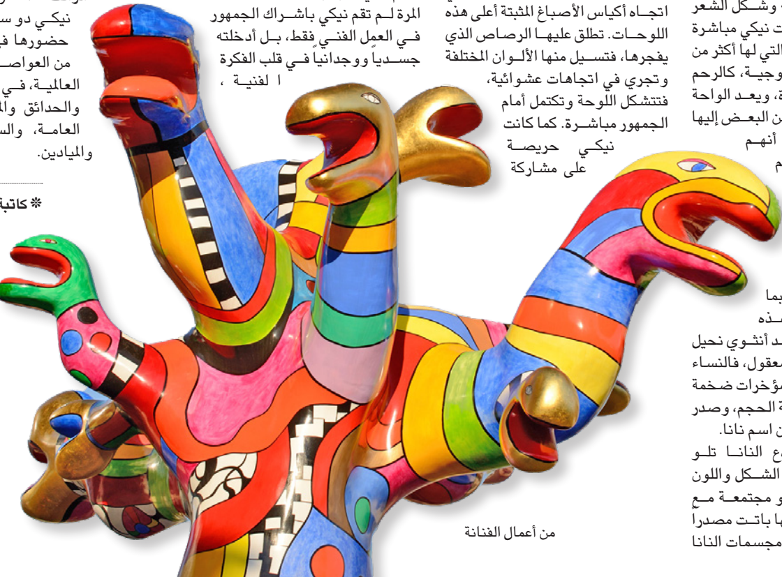
من أعمال الفنانة