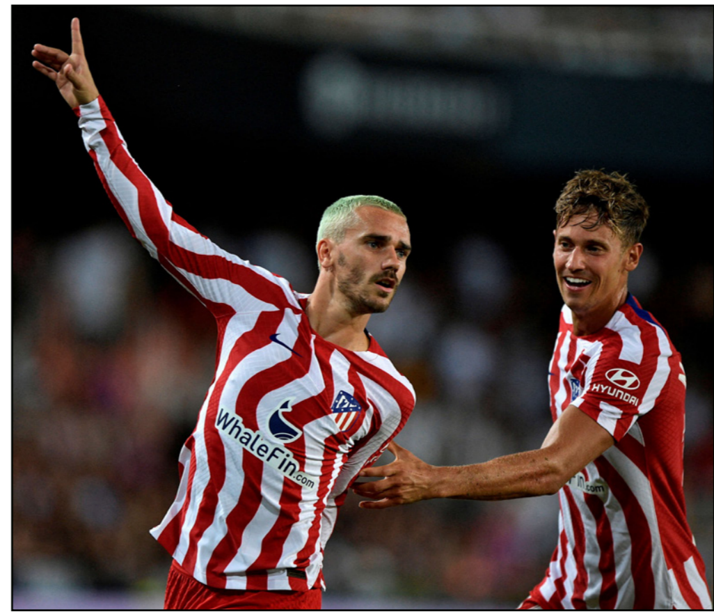
غريزمان (يسار) يحتفل بتسجيل هدف الفوز لأتلتيكو مع زميله بيريتي

مدريد - أف ب: سجل المهاجم الفرنسي أنطوان غريزمان، بعد دقيقتين فقط من مشاركته منتصف الشوط الثاني، هدف أتلتيكو مدريد الوحيد في مرمى مضيفه بلنسية، ليقوده إلى تحقيق انتصاره الثاني هذا الموسم في ختام المرحلة الثالثة من بطولة إسبانيا.