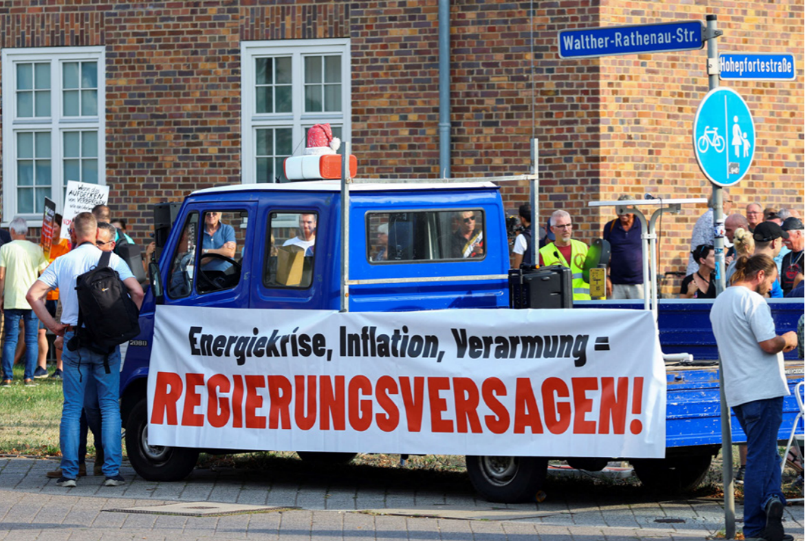
محتجون في مدينة ماغديبورغ مع لافتة عن تقادم أزمة الطاقة والتضخم وعجز الحكومة الألمانية عن مواجهة ذلك

من جانبه قال رئيس الوزراء الإسباني بيدرو سانتيشون المشارك في الاجتماع المغلق أن هذه هي الطريقة التي تجرى بها الحصول على أموال من شركات الطاقة والشركات المالية في إسبانيا، موضحاً أن مثل هذا الإجراء يلقي استحساناً كبيراً من قبل المواطنين، حيث أصبح لديهم انطباع بأن الأعباء موزعة بشكل أكثر عدلاً، مضيفاً أن الأمر يتعلق بإعادة توزيع لصالح الطبقة الوسطى والعامة.