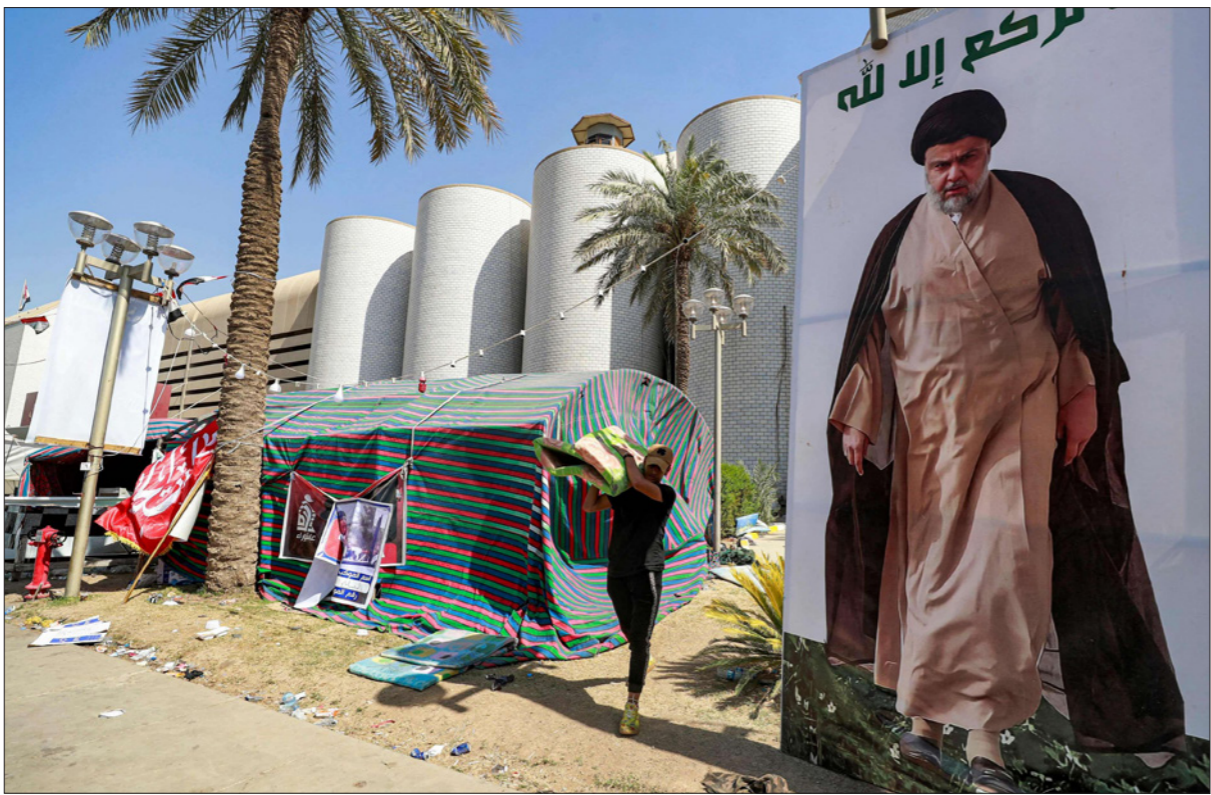
أحد أنصار الزعيم الشيعي مقتدى الصدر يحمل أعلاماً من خيمة مارا قرب صورة كبيرة للصدر في المنطقة الخضراء في بغداد أمس

انتقد ثورة التيار الصدري أيضاً، وراذ: «مازلت أومن أن التيار مطيع وإذا لم ينسحب من الاعتصام من أمام البرلمان خلال مدة 60 دقيقة، فسأبرأ من التيار، مشيراً إلى أنه «لا توجد تظاهرات سلمية بعد الآن، ولا زنيدها».