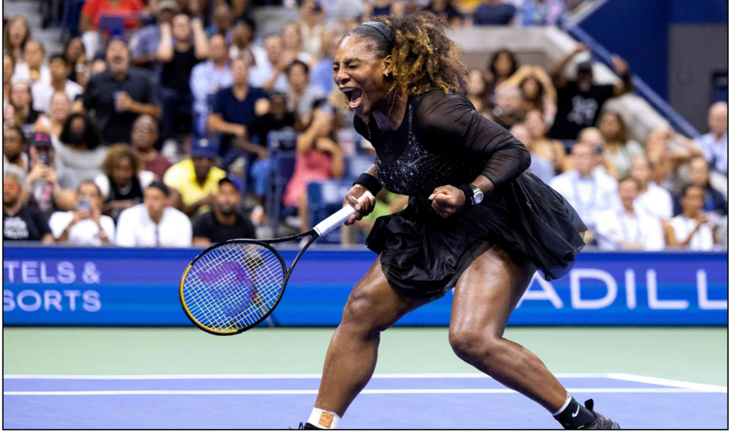
سيرينا تحتفل بانتصارها على منافستها المونتينيغرية دانا كوفينيتش