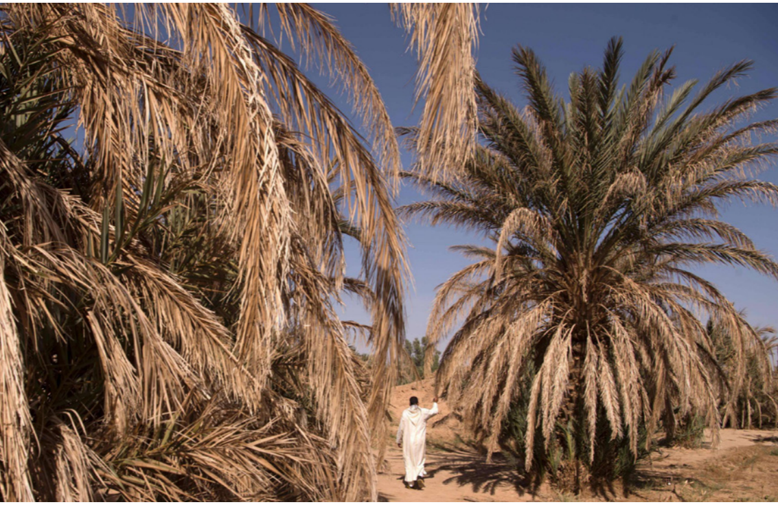
مزارع مغربي في حقل نخيل جفت أشجاره في واحة في جنوب البلاد

وأشار إلى أنه «في سنة جيدة، ينتج المغرب تقريبا 100 مليون قنطار من الحبوب تتمكس على 40 في المئة من الساكنة التي تستهلك، وبالتالي تحرك عجلة الاقتصاد المحلي». ويرى الكتاني أن «التوقع الحقيقي لا يعلمه إلا الله، ومشروع الميزانية يعتمد على فرضيات فقط». وأوضح أن «بناء التوقعات في المغرب له علاقة له بالتخطيط، وهذا مشكل حقيقي»، متسائلا «كيف نبني فرضيات لمشروع الميزانية ونحن ننظر كمية الأمطار التي ستسقط». ولغيت الكتاني إلى أن «1.5 في المئة، نسبة النمو المتوقعة لسنة 2022، هي من أقل النسب المسجلة في السنوات الأخيرة». وخلص إلى القول «معناه أننا أمام سنة بيضاء اقتصاديا، وستكون لذلك انعكاسات اقتصادية واجتماعية في 2022 وأيضا 2023». وما زاد الطين بلة ارتفاع التضخم في المغرب إلى مستويات غير مسبوقة منذ 28 سنة، وفق وزيرة المالية المغربية، فتح العلوي. فقي 27 يوليو/تموز الماضي قالت العلوي أمام لجنة برلمانية أن «متوسط مستوى التضخم خلال النصف الأول من عام 2022، بلغ 5.1 في المئة (7.8 في المئة منها تضخم غذائي، في 3.4 في المئة تضخم غير غذائي)».