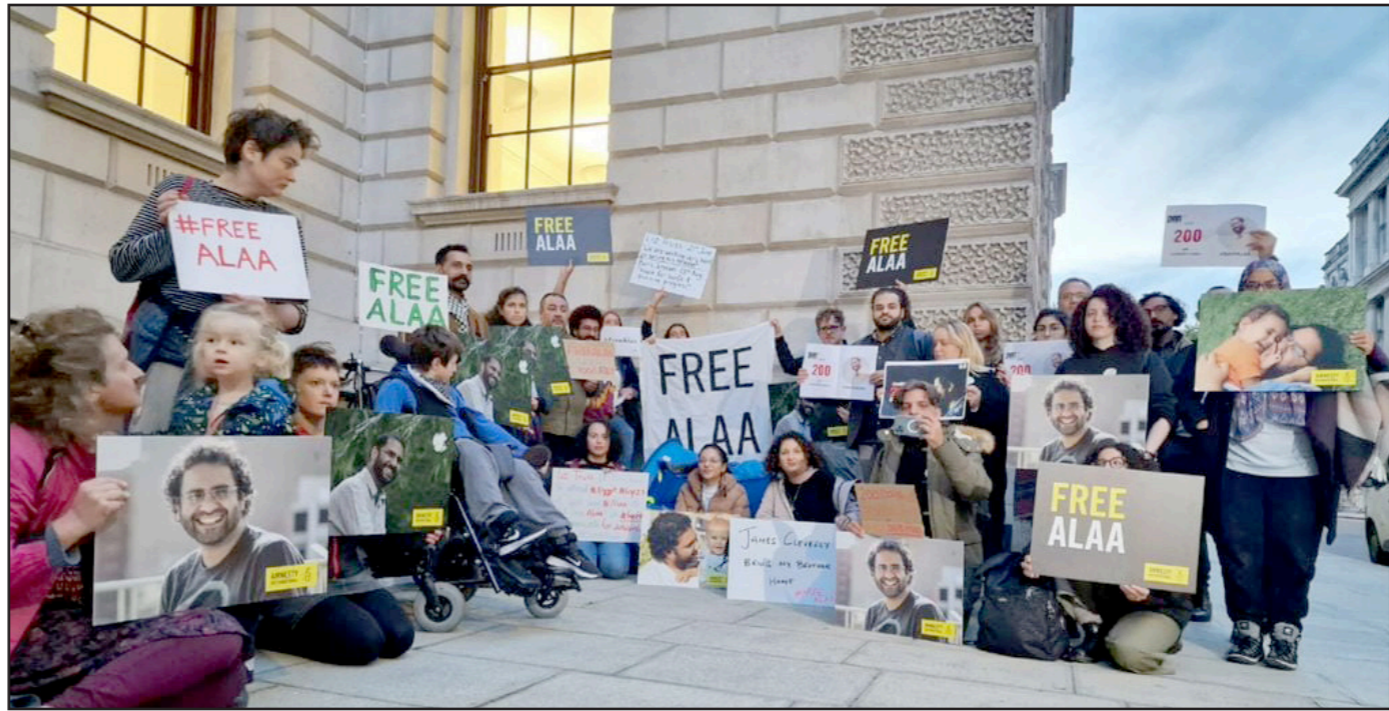
ناشطون يرفعون صور عبد الفتاح خلال وقفة قرب الخارجية البريطانية في لندن