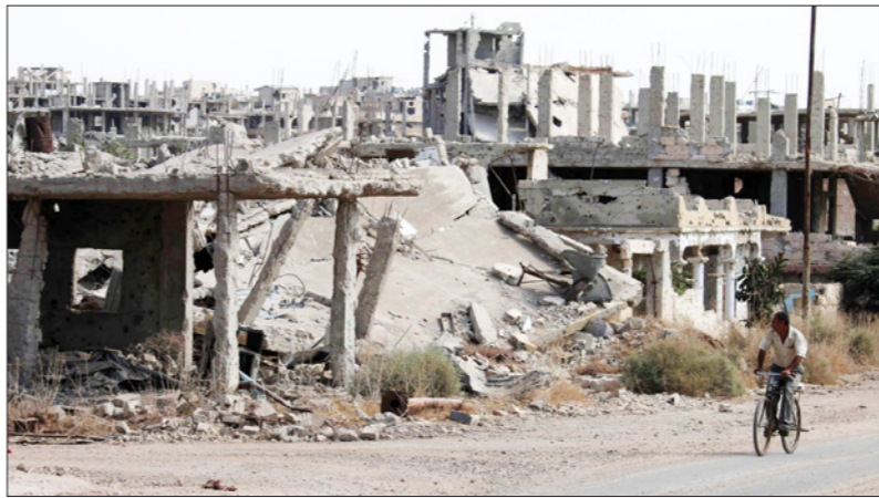
سوري يمر بأحد أحياء درعا المدمرة (أرشيفية)