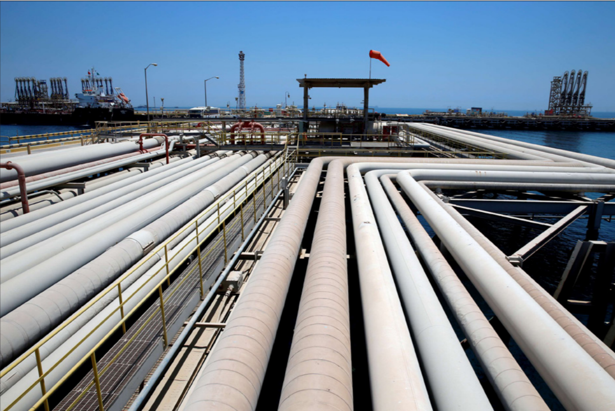
رصيف تحميل النفط الخام والمكرر المعد للتصدير في ميناء رأس تنورة في شرق السعودية

وأوضح التقرير أن هذا الرقم أعلى مما جاء في تقديرات العام الماضي. وأضاف الغيص «ومع ذلك، فإن النقص المزمع في الاستثمارات في قطاع النفط العالمي في السنوات الأخيرة، سواء بسبب انكماش القطاع أو جائحة كوفيد-19 أو السياسات التي تركز على إنهاء تمويل مشاريع الوقود الأحفوري، يشكل مبعثاً رئيسياً للقلق». وغيرت «أوبك» نظرتها للمستقبل في عام 2020 عندما أضرت الجائحة بالطلب، إذ قالت إنه سيتباطأ في نهاية المطاف بعد أن اعتادت لسنوات توقع ترقع زيادة الاستهلاك باستمرار. وحافظت المنظمة في التقرير على رؤيتها أن الطلب العالمي على النفط لن يستقر إلا بعد عام 2035. لكن مؤسسات أخرى من بينها شركات وينوك تتوقع أن يبلغ الطلب على النفط ذروته قبل ذلك. وقالت الوكالة الدولية للطاقة يوم الخميس الماضي، لأول مرة منذ أن بدأت وضع سيناريوهات آفاق الطاقة، أن من المتوقع أن يبلغ الطلب على جميع أنواع الوقود الأحفوري ذروته، مع استقرار الطلب على النفط في منتصف العقد المقبل. وجاء في تقرير «أوبك» أن الطلب العالمي