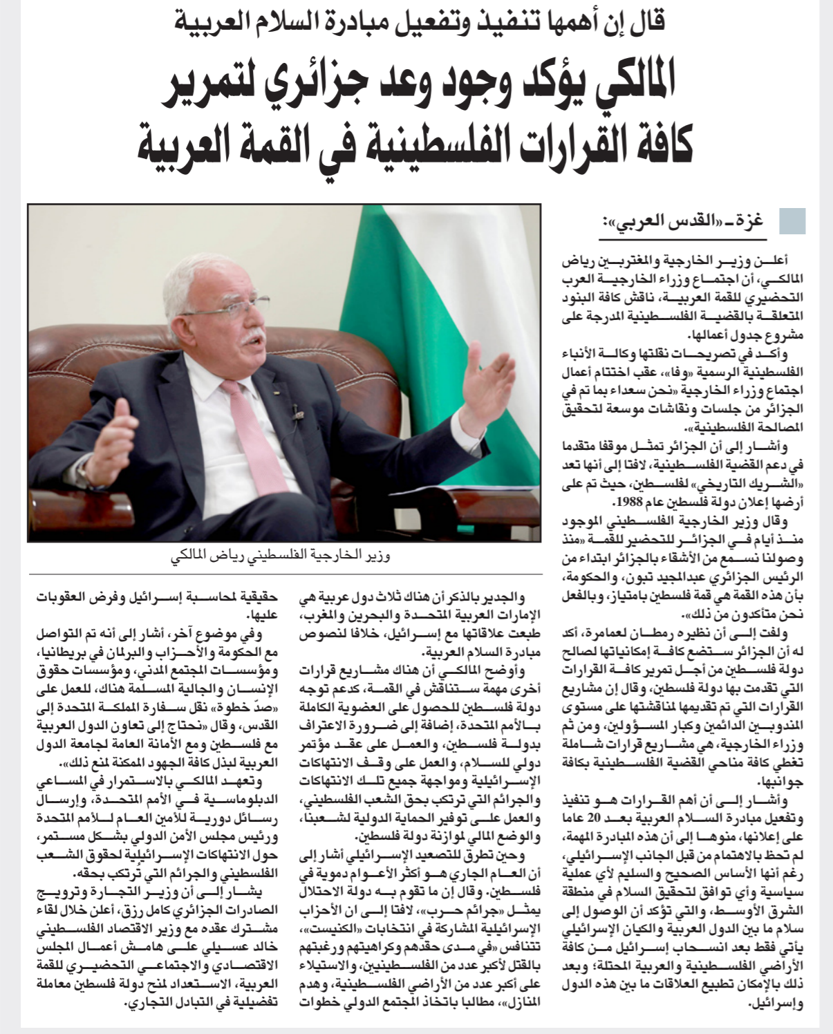
وزير الخارجية الفلسطيني رياض المالكي

ويخلص ماتسا للقول إن بن غير وسموريتش يطرحان نفسيهما على أنهم البديل الذي يعتمد على حدود وخطوط ترسيم وتعريفات حادة وبارزة واضحة وعلى هذا الأساس يجذبان جماهير كبيرة سئمت من مرحلة ما بعد الحداثة التي تدفعهم إلى صناديق الاقتراع مرة تلو أخرى، وتمنع التوصل إلى حسم سياسي وفكري في إسرائيل. ولا شك في أن الإعلام العربي الغارق هو الآخر في تغطيات سطحية تبحث عن نسب المشاهدة العالية وتشارك في تغيب القضية الفلسطينية والقضايا الجوهرية، قد لعب دوراً في تنمية قوة «الصهيونية الدينية» من خلال «صناعة النجوم» واستخفافه بن غير وسموريتش بشكل مفرط وتسليط الضوء عليه بلغة ناعمة لطيفة ومحضنة رغم تصريحاته وتحرشاته الاستفزازية بالفلسطينيين.