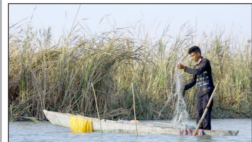
صياد في قارب في مجرى النهر بمحافظة ذي قار جنوب العراق

غادر الرئيس العراقي، عبد اللطيف جمال رشيد، أمس الإثنين، العاصمة بغداد، متوجها إلى الجزائر للمشاركة في اجتماعات القمة العربية في دورتها الحادية والثلاثين والتي ستعقد في العاصمة الجزائرية