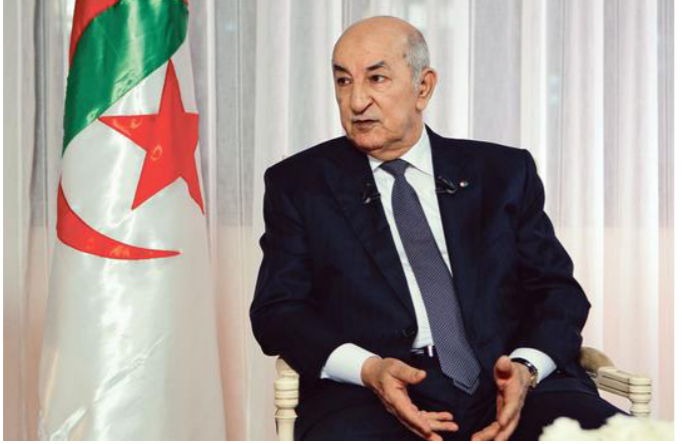
الرئيس الجزائري، عبد المجيد تبون