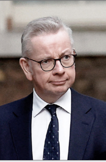
قال مايكل غوف إن هناك «مقاومة» داخل الحكومة لتعريف الإسلاموفوبيا بسبب «الرغبة في عدم التسبب في أذى»

وقال المتحدث باسم وزارة تعديل المستوى والإسكان والمجتمعات «لا تزال ملتزمين بالقضاء على الكراهية ضد المسلمين وكل أشكال التحيز الديني وستتخذ الخطوات المقبلة في الوقت المناسب».