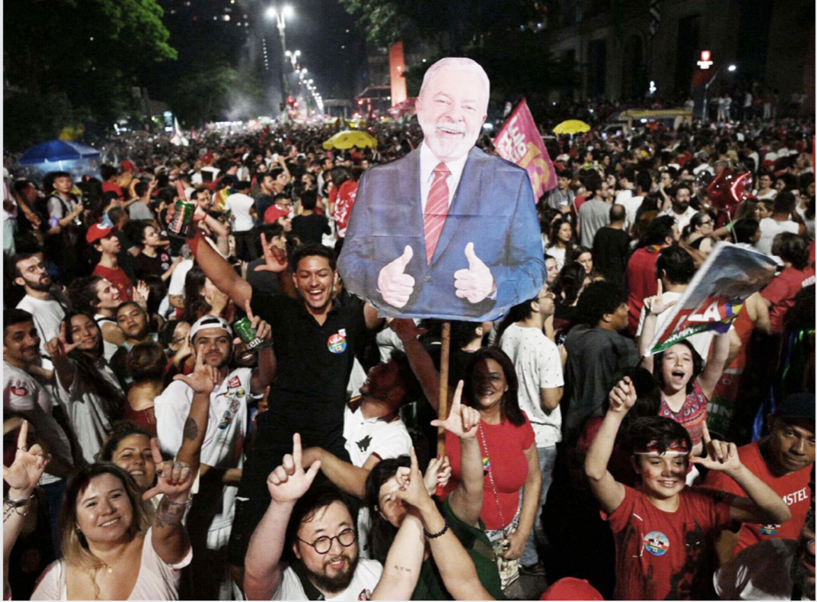
انتصار لولا دا سيلفا يحتفلون بفوزه أمس في ساو باولو

قالت فانيشا باريرا، المختصة بشؤون البرازيل في صحيفة «نيويورك تايمز» إن نتائج الانتخابات التي أدت لعودة مرشح يسار- الوسط لويز إغناسيو لولا دا سيلفا، ربما كانت إشارة على أن البرازيل قد تحررت من جنون جاثير بولسونارو «أربع سنوات من الجنون ربما انتهت، ففي جولة ثانية متوترة، تغلب لولا دا سيلفا على الرئيس جاثير بولسونارو وحصل على نسبة 50.9٪ من الأصوات، وسيصبح لولا، باستثناء حصول حدث دراماتيكي، كالانقلاب المروع الذي يحوم على البلاد منذ أشهر، رئيساً للبلاد في 1 كانون الثاني/يناير». ولم يكن الطريق سهلاً، فالشهر الأخير كان بمثابة تقطير لعهد بولسونارو، وكانت هناك عملية تخليص واسعة (فقدان على حملة دا سيلفا التأكيد رداً على الشائعات التي انتشرت على وسائل التواصل الاجتماعي أنه: لم يعقد صفقة مع الشيطان أو تحدث معه)، وكان هناك حديث مستشر حول أكلة لحوم البشر والماسونية والسياسة التي ستعيد البلاد إلى القرون الوسطى.