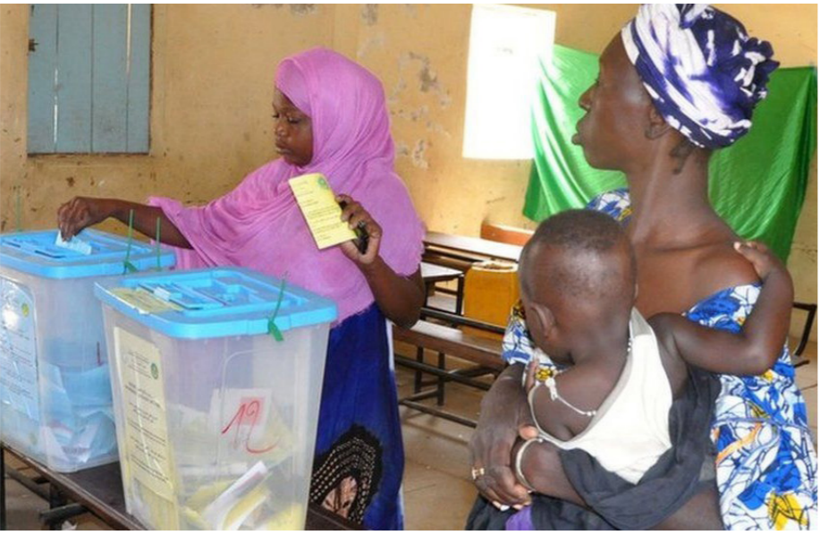
أحد مراكز الاقتراع في موريتانيا

وفي حالة تعذر التوافق في المدة المحددة آنفاً، وهو ما حدث هذه المرة، يتعين على لجنة التقييم الحالية القائمة الـ 22 إلى رئيس الجمهورية الذي سيكون الحكم النهائي فيها. ويصدر مرسوم تعيين هذه اللجنة وتجاوز عرقله تسميتها، تتجه موريتانيا بالفعل نحو الانتخابات الجهوية والبلدية والنيابية مقررة في شباط/فبراير من العام المقبل، حيث بدأت التحالقات السياسية استعداداً ل موسم انتخابي سيكون، حسب المؤشرات، شديد السخونة وشديد الحساسية.