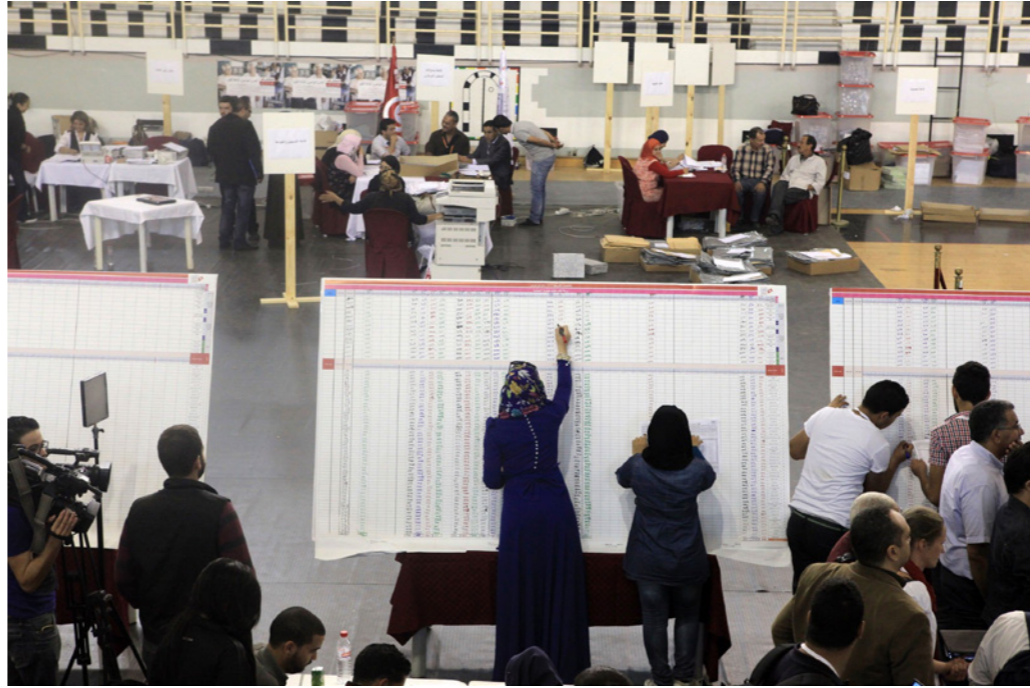
أحد مراكز فرز الأصوات الانتخابية في تونس