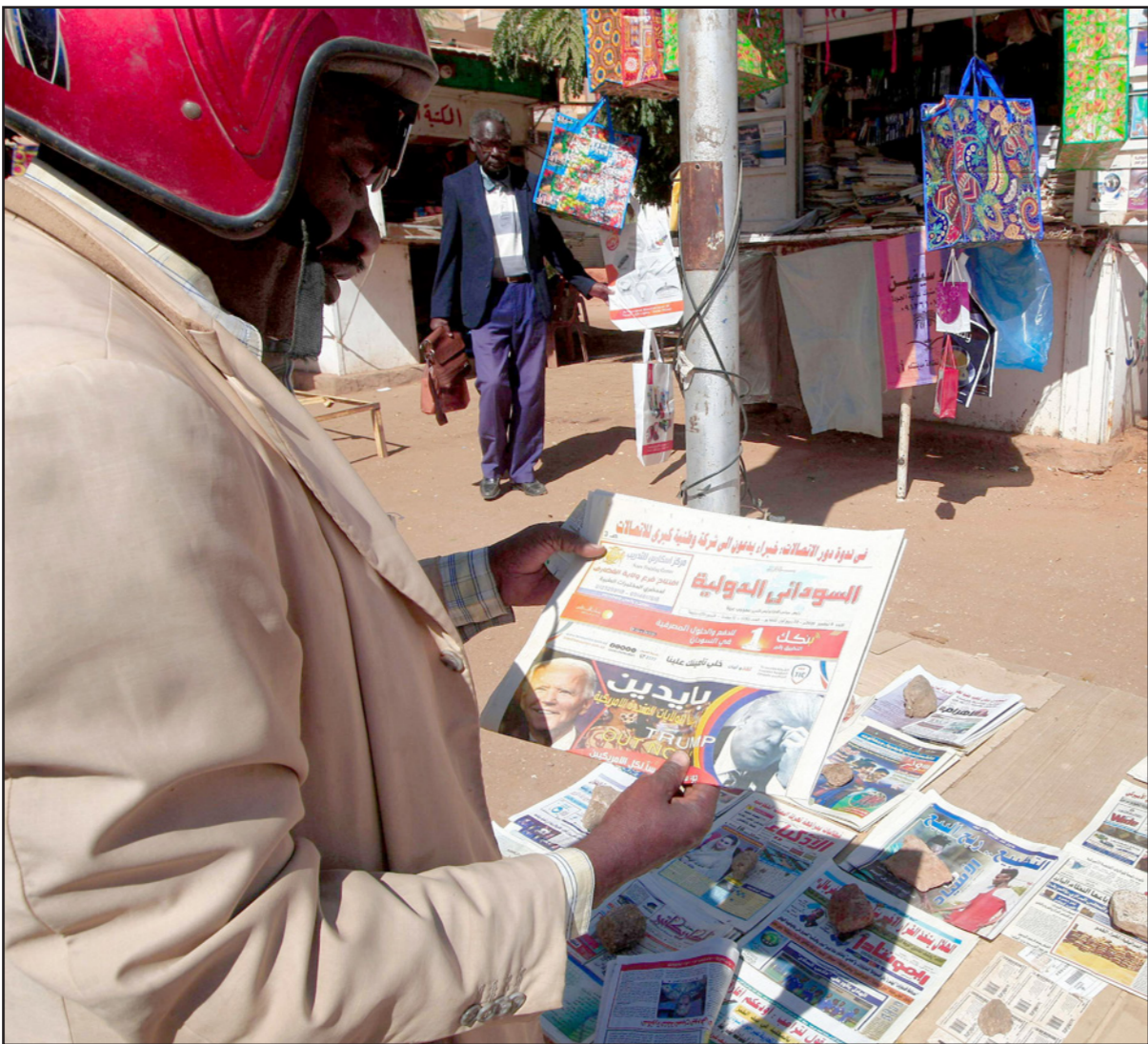
رجل يتصفح إحدى الصحف في العاصمة السودانية الخرطوم

الممارسات غير المهنية من قبل مؤسسة إعلامية محترمة. وأبدت أسفها لاعتبار «إذاعة البيت السوداني» استضافة صحفيين في برنامج منوع حواري جرماً يعاقب عليه معد وبرنامج البرنامج بالإيقاف والاستيضاح، وأن يتم وصم لقاء عن انتخابات قطاع مهني بأنه حديث سياسي وليس اجتماعياً. وخلال قسرة الانقلاب، تم اقتحام مقر صحيفة «الديمقراطي» بالخرطوم بحري، ومحاصرتها بسيارات عسكرية، لاحقاً قرر ناشروها إيقاف صدورها، وأيضاً أعلنت صحيفة «الدعابة اليومية»، بعد نحو شهرين من الانقلاب، توقفها عن الصدور، وعزت ذلك إلى