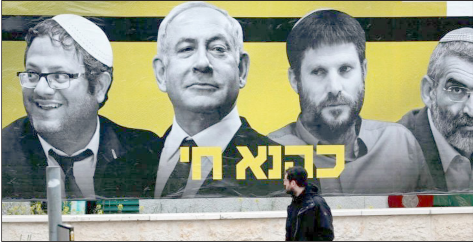
بن آري، سموريتش، نتنياهو وبن غير

في المقابل أكد رئيس المعارضة ورئيس حزب «الليكود»، بنيامين نتنياهو، بعيد تصريحات بن غير، أن الأخير سيكون وزيراً في الحكومة فقط إذا قام بتشكيلها»، وقال إنه كي يحدث ذلك يجب أن يكون الليكود أكبر من حزب يائير