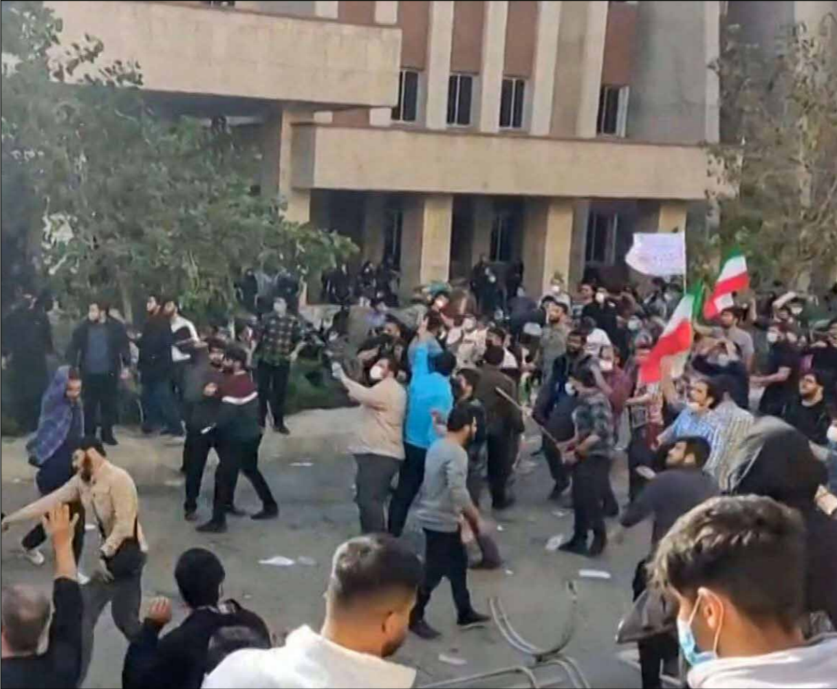
رجل بتياب مدنية يظهر وكأنه يطلق النار بين الحشود المتظاهرة في جامعة شمال طهران

لندن - «القدس العربي» - وكالات: قالت وكالة أنباء شبه رسمية، أمس الإثنين، إن القضاء الإيراني سيعقد محاكمات علنية لنحو ألف شخص وجهت لهم تهمة في طهران على خلفية الاضطرابات التي تشهدها البلاد، في الوقت الذي تكثف فيه السلطات جهودها لإخماد الاحتجاجات المستمرة منذ قرابة سبعة أسابيع بعد وفاة الشابة مهسا أميني على إثر احتجاج شرطة الأخلاق لها. وتستمر الاحتجاجات على الرغم من حملة دامية وتحذيرات شديدة متزايدة، شهدت مطالبة الحرس الثوري يوم السبت المحتجين صراحة بالابتعاد عن الشوارع. وفي مقطع مصور نشر على مواقع التواصل الاجتماعي، قالت امرأة إن حكماً بالإعدام صدر على ابنها (22 عاماً) منذ يومين في محاكمة أولية، ملتزمة المساعدة. وقال حساب باسم «1500 تصوير» الذي يحظى بحساب كبير من المتابعين على تويتر، والذي نشر المقطع، إن الشباب مثل أمام محكمة مثري الشعب. ووصف القادة الإيرانيون الاحتجاجات بأنها مؤامرة من أعداء الجمهورية الإسلامية، بما في ذلك الولايات المتحدة وإسرائيل، متوعدين بإجراءات صارمة بحق المحتجين الذين وصفهم بالمشاغبين. وشارك منظفون من جميع أطراف المجتمع في هذه الاحتجاجات، التي اندلعت بعد وفاة أميني (22 عاماً) بعد أن احتجزتها شرطة الأخلاق بسبب ملابسها «غير المناسبة»، والتي لعب الطلاب والنساء دوراً بارزاً فيها. وقالت وكالة تسنيم شبه الرسمية للأنباء، نقلاً عن كبير القضاة في إقليم طهران، إنه ستتم محاكمة نحو ألف شخص، «ارتكبوا أعمالاً تخريبية في الأحداث الأخيرة»، بما في ذلك الاعتداء على حراس أمن أو قتلهم، وإضرار النار في الممتلكات العامة، في محكمة ثورية. وأضافت أن المحاكمات ستتم بشكل علني هذا الأسبوع.