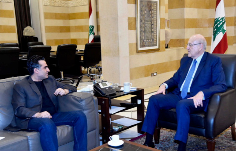
رئيس الحكومة نجيب ميقاتي لدى لقائه وزير العمل علي حمية

بيروت – د ب أ: أعلن وزير الأشغال العامة والنقل اللبناني علي حمية، بعد لقائه رئيس حكومة تصريف الأعمال نجيب ميقاتي، أمس الاثنين، أنه سيدعو إلى اجتماع للجنة المعنية بعملية ترسيم الحدود البحرية مع قبرص وسوريا التي يرأسها، مشيراً إلى أنه ستتم معالجة الأمور بشكل هادئ.