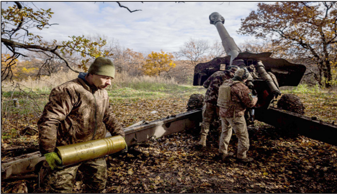
جنود مدفعية أوكرانيون يلقون مدفع هارتزر على خط الجبهة قرب مدينة باخومت شرق البلاد أمس

شنت روسيا «هجوم مكثف» أمس الإثنين، على منشآت الطاقة في مختلف أنحاء أوكرانيا، ما أدى إلى انقطاع الماء والكهرباء عن أجزاء من كييف. وجاءت الهجمات بعد إعلان موسكو في نهاية الأسبوع تعليق مشاركتها في الاتفاقية الدولية لنقل الحبوب الأوكرانية، ردا على هجوم استهدف الأسطول الروسي في شبه جزيرة القرم، نسبته موسكو إلى أوكرانيا بمساعدة الممثلة المتحدة.