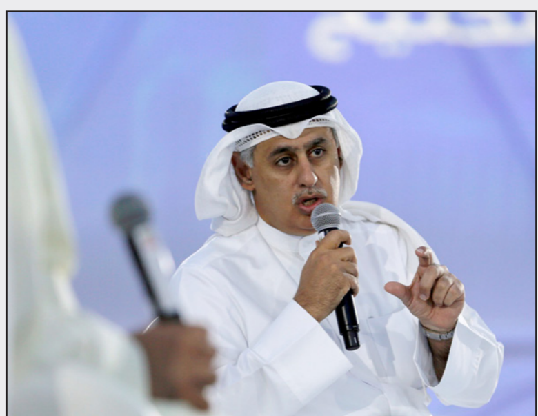
وزير التجارة والصناعة البحريني زايد بن راشد الزياني

الاقتصادية والسياسية، فيدون الأمن والأمان، لا يوجد ازدهار اقتصادي ولا استقرار».