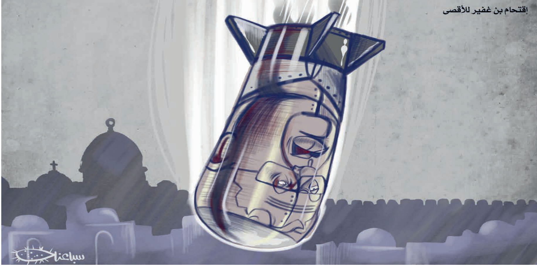
اقتحام بن غفير للأقصى