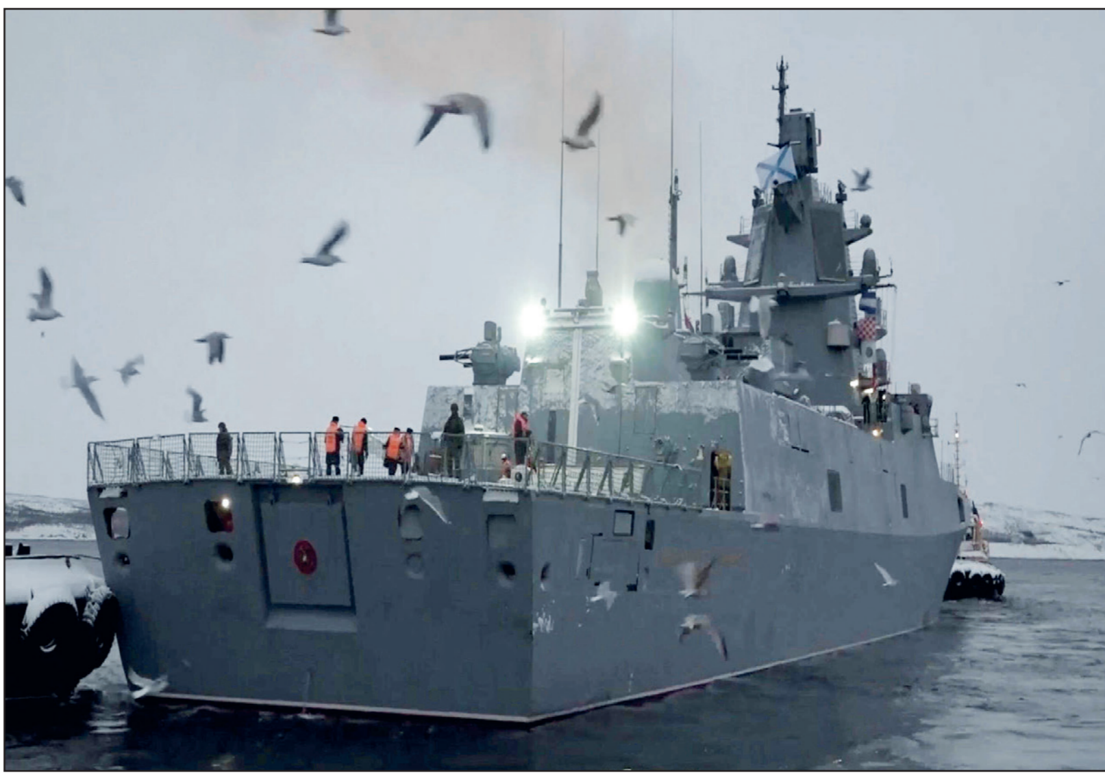
الفرقاطة الروسية الجديدة التي تفوق سرعتها سرعة الصوت تغادر القاعدة البحرية في سيفيرودور

لنهم أن الإفلات من العقاب لا يؤدي إلى اللحمة الاجتماعية، الإفلات من العقاب يؤدي إلى جرائم جديدة، وبالتالي، إلى الاستياء العام»، وأنشد الزعيم الانفصالي الموالي لروسيا دينيس بوشلين «بطولة» الجنود الذين نجوا من دونيتسك العاصمة الإقليمية التي تحتلها لإنقاذ رفاقهم، من تحت الأنقاض. وقال بوشلين إن نائب قائد الفوج قتل في الهجوم القتلى ارتفع إلى 89، بعد العثور على مزيد من الجثث تحت الأنقاض، في حين تحدثت الحصيلة السابقة عن 63 قتيلًا.