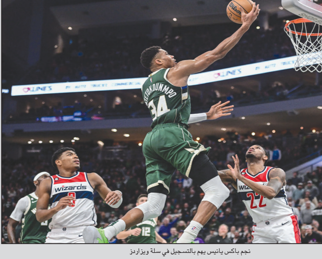
نجم باكس يانيس يهب بالتسجيل في سلة ويزاردز

■ واشنطن - آ ف ب: سجّل العلامق اليوناني يانيس أنتيوكونيمو أعلى رصيد في مسيرته بلغ 55 نقطة، وقاد ميلووكي باكس إلى فوز ثأري على ضيفه واشنطن ويزاردز 113-123، في دوري السلة الأمريكي للمحترفين. وأضاف يانيس، الغائب عن خسارة الأحد أمام واشنطن 95-118 لأوجاع في ركبته، 10 متابعات وسبع تمريرات حاسمة، علما أنه سجل 19 نقطة في الربع الأخير ليضع فريقه في المقدمة. وقال يانيس الذي سجل 20 من 33 محاولة و15 من 16 رمية حرة: "أحاول فقط اتخاذ القرارات الجيد، إن أكون شرسا طوال المباراة، وفي نهاية المطاف تحقيق الانتصارات". وأصبح أنتيوكونيمو رابع لاعب فقط في تاريخ الدوري يسجل 40 نقطة، 10 متابعات و5 تمريرات حاسمة في ثلاث مباريات توالياً، منضمًا إلى راسل وستبروك، ألجين بايلر وويلت تشامبرلين، ورأى يانيس أن التعاريف الإضافية من خط المرميات الحرة، ساهمت في تعزيز رصيده التسجيلى "كما ما أقوم به، أعمل، كثر يعتقدون أن أسلوب لعبي عمل، لكني أحاول التحسن، يجب أن تطوّر من خط المرميات الحرة، وأنا أقوم بجهد إضافي في هذا الإطار، إن أجد زملائي، اصنع رميات ثلاثية مفتوحة وأحاول أن أهبم تحت السلة قدر الإمكان". وأضاف زميله بروك لوبيز 21 نقطة و12 متابعة، والبديل بوبي بورتيس 17 نقطة و13 متابعة، ليحقق ميلووكي، ثالث المنطقة الشرقية، فوزه الرابع والعشرين مقابل 13 خسارة، وعن تهنئة زملائه من خلال رش المياه عليه احتفالا، قال يانيس: "هذه هي كرة السلة، هذا هو الفوز، لدينا فريق رائع، تلعب سنويا وأنا سعيد للعب مع فريق ممتاز". ولدى واشنطن الذي مُني بخسارة أولى بعد انتصارات متتالية، سجل اللاقي كريستيان بورتينغيز 22 نقطة و9 متابعات.