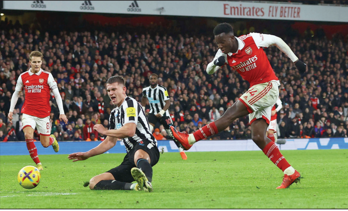
مهجم أرسنال نيكيتيكا يسدد كرة خطيرة على مرمى نيوكاسل قرب النهاية

التي تهيئ في المركز الثامن بفارق نقطة ومركز عن فولهام الفائز 0-1 على مضيفه ليدستهدف الصربي الكسندر ميتروفيتش.