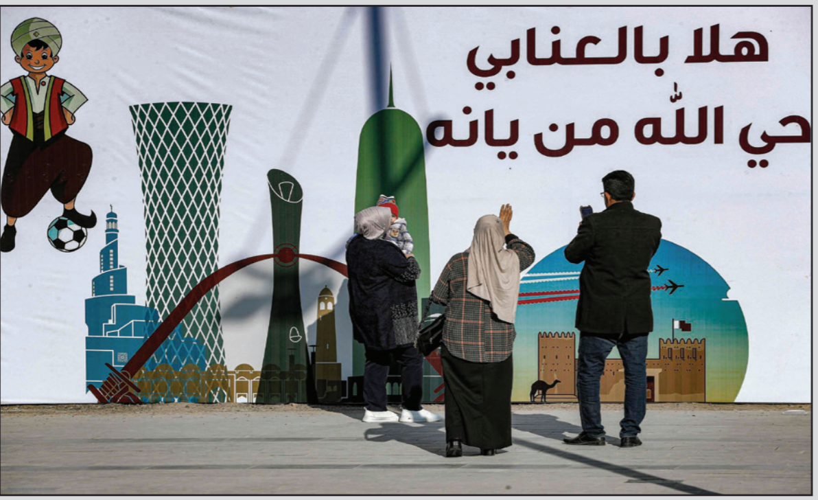
ملصق كبير في شوارع البصرة يرحب بالمنتخب القطري

إلى العمل. الأمر بهذه البساطة. أنا متدرب في الدوري الإنكليزي وهناك ضغوط تتعلق بالمنصب في أي مكان". ويحتل إيفرتون المركز السادس عشر برصيد 15 نقطة متقدما بثلاث نقاط على ساوثهامبتون متذلل الترتيب.