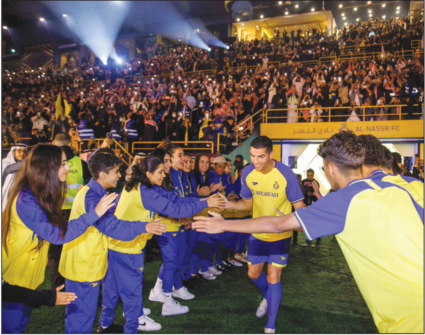
رونالدو خلال تقديمه الى جماهير النصر