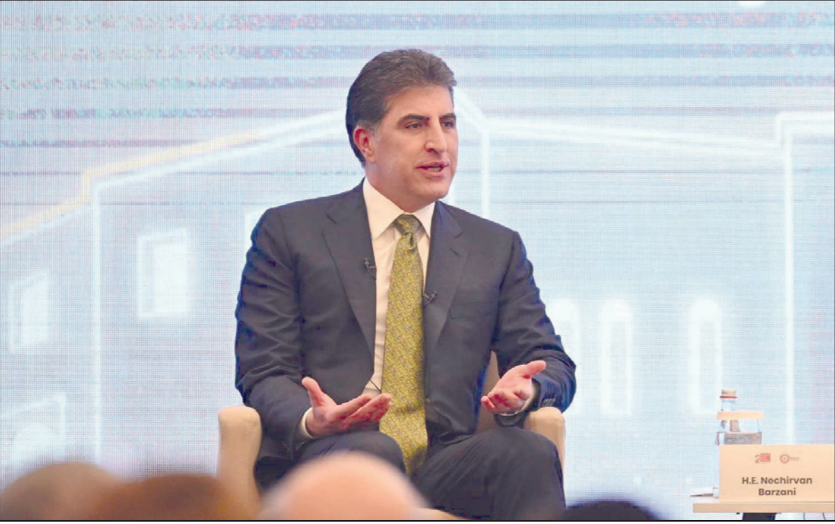
بارزاني خلال حديثه في منتدى أربيل السنوي

معي السيد الحلبيوسي والسيد الخنجر (جري اللقاء في مقر إقامة الصدر في النجف في 31 كانون الثاني/يناير 2022)، كانت محاولتنا كلها باتجاه افئاع مساحته أن تكون جميعاً ضمن العملية السياسية في العراق، وإن أيضاً ليست هناك قوى سياسية أو طرف يمكن أن يقلل من دور وحجم التيار الصدري في العملية السياسية العراقية، وهذا ثابت، لكن هذا كان قراره».