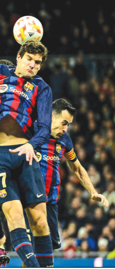
صراع هوأئي على كرة عالية بين لاعبي برشلونة وريال مدريد

في الشوط الثاني، حاول فينسوس بتسديدة قوية صدها الحارس مارك أندريه تيرشفتي (57)، في حين وقف أتسو فاتي الذي دخل بدلاً من رافينيا حائلًا دون مضاعفة فرقة النتيجة بعد تسديدة من كيسي مرت عن كورتوا لتصلدم بمهاجم برشلونة (72). ودفع