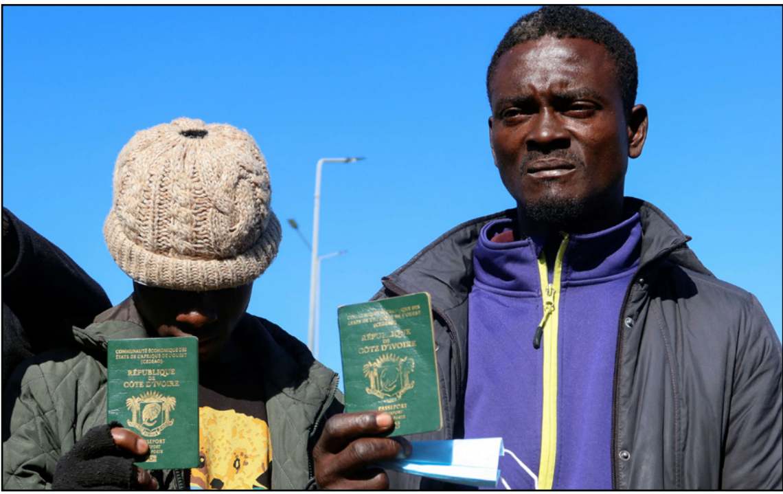
مواطنان من ساحل العاج في تونس قلقان على وضعهما في ظل التشجيع على العنصرية ضد

وأضاف الكاتب أن قصص الطرد من المنازل باتت عادية، إلى جانب روايات عن هجمات بالسواطير والسكاكين والضرب، ويتحدث الكثير من الناس عن حرق الممتلكات ورفض دفع الرواتب، وقيل خطاب الرئيس كل من الوعي بالعنصرية موجوداً في تونس لكن من النادر ما تحدث الناس عنها، ولكنه بات اليوم يميّز حياتهم اليومية، وفي شارع لجا فيه رجل وامرته وابنتها إلى خيمة بلاستيكية مؤقتة لحماية أنفسهم من الرياح القادمة من بحيرة قريبة، وقالت العائنة وهي من نيجيريا: "تقيم هنا منذ أسبوعين تقريباً"، وقيل ذلك أقامت العائلة في حي من أحياء الطبقات العاملة المنتشرة حول العاصمة، وقالت الزوجة "باتت الأمور الآن أسوأ، ولا بيت للإقامة بعد، وطردها صاحب البيت ويحترش بنا الناس والشرطة ولا عمل ولا مال، لا شيء"، وعندما سئلت عن كيفية وصف تونس لأصدقائها،