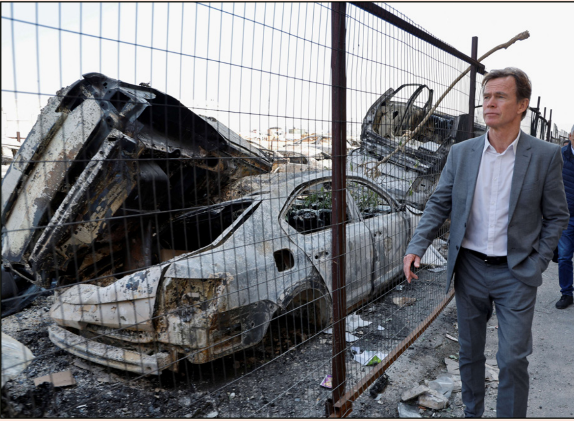
ممثل أوروبي يتفقد الدمار والحرائق التي خلفها المتطرفون الإسرائيليون في حوارة في منطقة نابلس