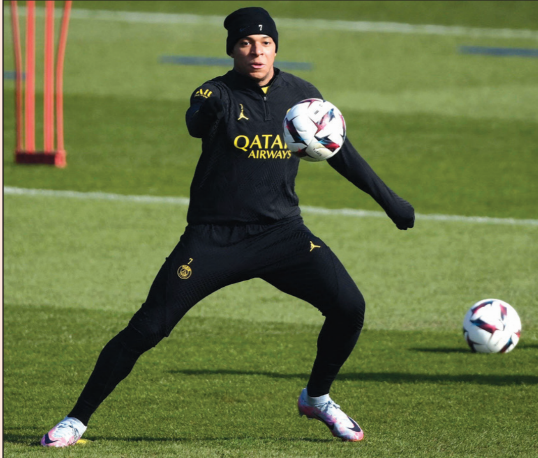
مبابي خلال حصة تدريبية مع سان جيرمان أمس

ورغم أن سان جرمان يفتقد للحلقة الخالصة في هجومه الناري البرازيلي نيمار لصابة في كاحله، يؤمن بظوظه في قلب المعادلة أمام عملاق بافارييا بفضل الثنائي ميسي-مباهي الذي الهب لمع «فيلودروم» في تمريرتين حاسمتين من الأرجنتيني الذي سجل بدوره بكرة من الفرنسي، ويحكم سان جيرمان قبضته على الصدارة مع 60 نقطة، مقدماً بفارق 8 نقاط عن مارسيليا الذي يحل ضيفاً على رين الأحد في ختام منافسات هذه المرحلة.