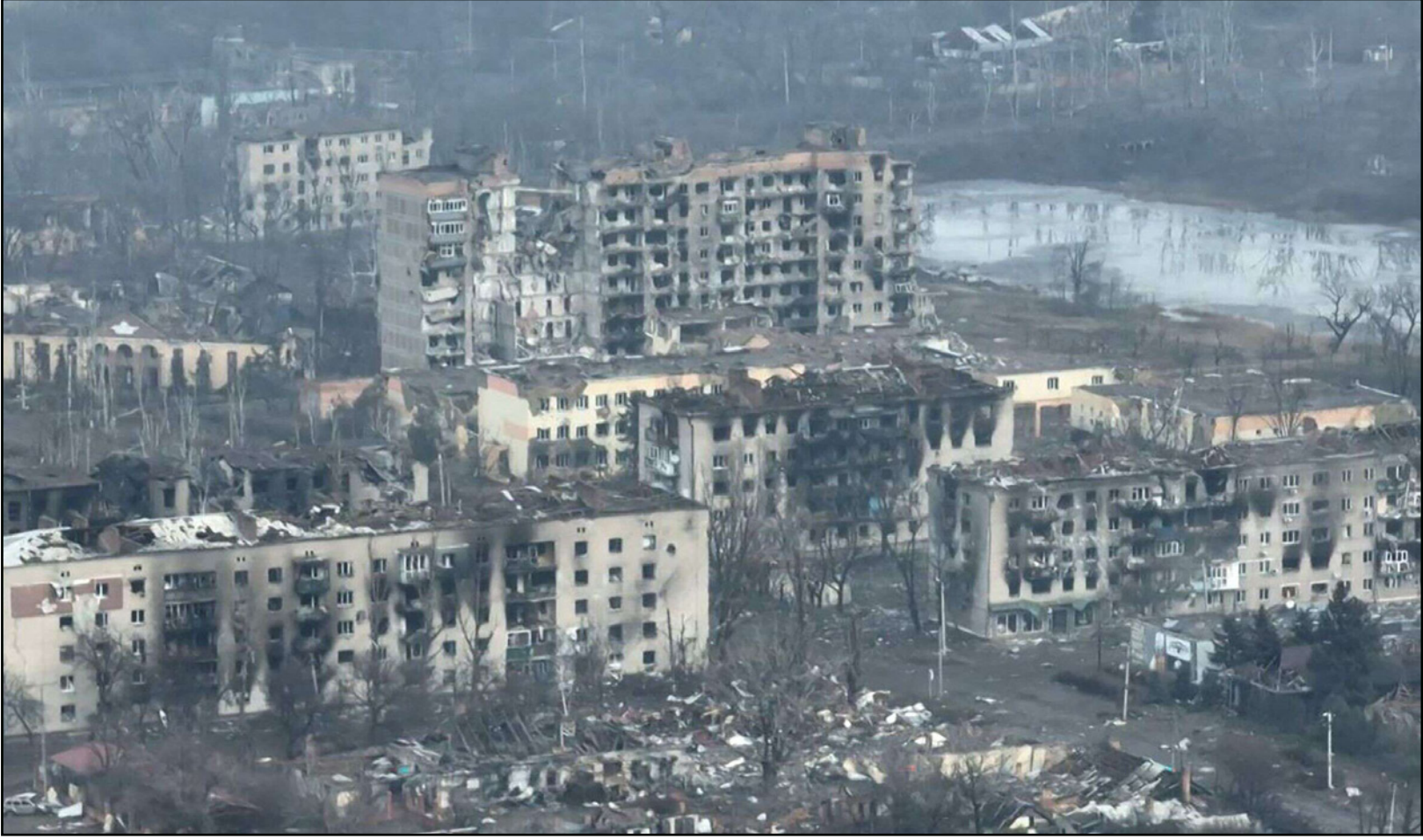
مشاهد الدمار الذي تعرضت له باخموت جراء القصف الروسي