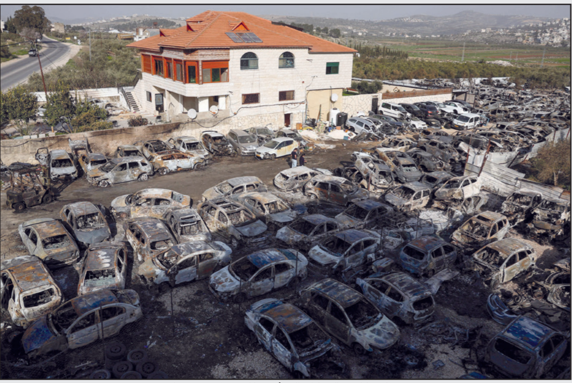
كميات هائلة من السيارات التي أحرقها المستوطنون في حوارة

وقال إن الأردن سيعتزم في بذل كل جهد ممكن لـ«وقف التدهور وإيجاد أفق سياسي حقيقي يفلح العملية السلمية ويحقق تقدما لحل الصراع على أساس حل الدولتين الذي يجسد الدولة وممتلكاتهم، حسب بيان للخارجية الفلسطينية.