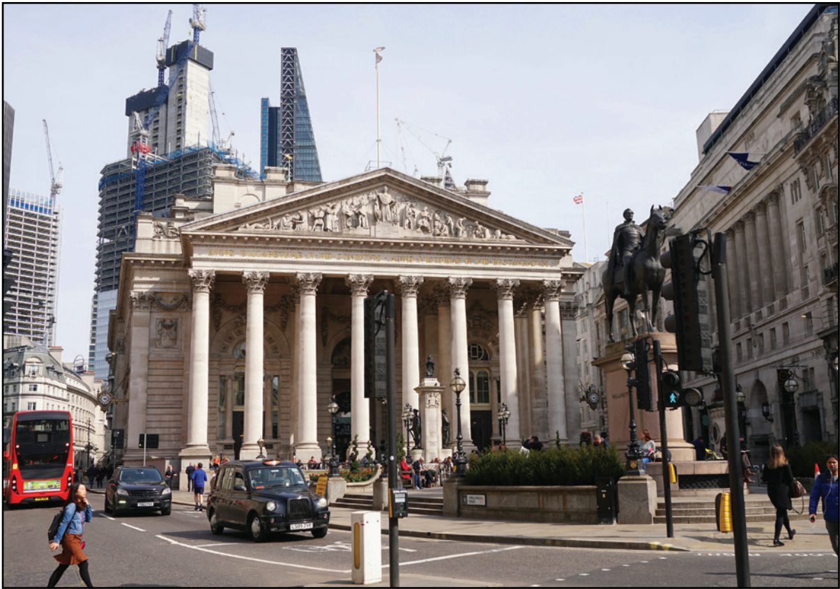
واجهة بورصة لندن

■ لندن - أ ب: تعرضت سوق الأوراق المالية في لندن والقطاع المالي الأوسع في العاصمة البريطانية لضربة جديدة بعدما اختارت شركة "آرم" العملاقة لتصميم أشباه الموصلات نيويورك لطرح عام أولي للاكتتاب في أسهمها. وتصلت شركة "آرم" التي مقرها بريطانيا والمملوكة لشركة "سوفت بنك" اليابانية العملاقة للاستثمار إلى قرارها بعد أشهر من المحادثات مع الحكومة البريطانية والهيئات الناطقة في البلاد. وأوضح الرئيس التنفيذي لشركة "آرم" رينيه هاس في بيان "قررت سوفت بنك وآرم أن السعي نحو إدراج آرم في الولايات المتحدة للنمو والوظائف والاستثمار". والشركة التي أسست في العام 1990، متخصصة في المعالجات الدقيقة وتهيمن على سوق الهواتف الذكية العالمية. واستخدمت تقنياتها في أول "آيفون" من شركة "آبل" أصدر في العام 2007. كما أن شرائح "آرم" موجودة أيضاً في أجهزة الاستشعار والأجهزة الذكية ومعدات الخدمات السحابية.