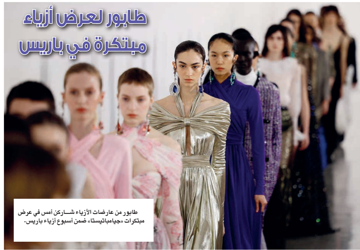
طابور من عارضات الأزياء شاركن أمس في عرض مبتكرات «جيامباتيستا» ضمن أسبوع أزياء باريس.