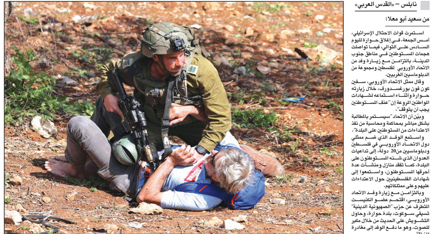
جندي من جيش الاحتلال يعنف ناشط سلام أجنبياً في حوارة أمس

مجموعات من المتضامنين الإسرائيليين وطالب وزير الثقافة الفلسطيني السابق إيهاب سبيسو، بتحويل مخطفات جريمة قرق حوارة لتكون بحق المواطنين. وفي القدس، أدى نحو 70 ألفاً صلاة الجمعة رغم العيقات الإسرائيلية.