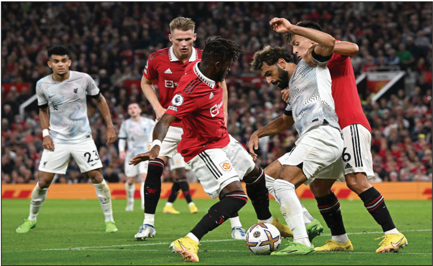
صراع ليفربول ومانشستر يونايتد يتجدد الأحد

بعد الفوز برعاية نظيفة على إيفرتون منتصف الأسبوع في مباراة مؤجلة: "عندما نتظر اليوم كل يوم، تشعشع فقط برغبتهم الكبيرة، وبسعيهم لتنفيذ ما نطلبه منهم ومدى رغبتهم في إرضاء جماهيرنا..."