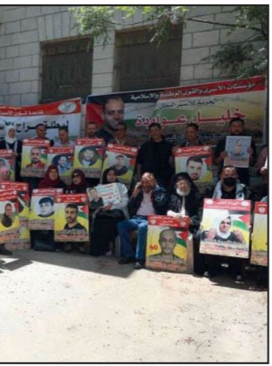
أرشيغية لوفقة تضامنية مع الأسرى

وفي الآونة الأخيرة تم إحراز تقدم في التعاون بين الصحة والدفاع الإلكتروني. وجاء الإعلان عن المخطط الإسرائيلي الهادف لافتتاح سفارة قريبة من إيران، التي تعتبرها دولة الاحتلال من ألد أعدائها، بعد الكشف عن إلغاء دولة الإمارات العربية المتحدة، التي أقامت أخيراً علاقات مع إسرائيل، زيارة لرئيس الوزراء بنيامين نتنياهو، كانت