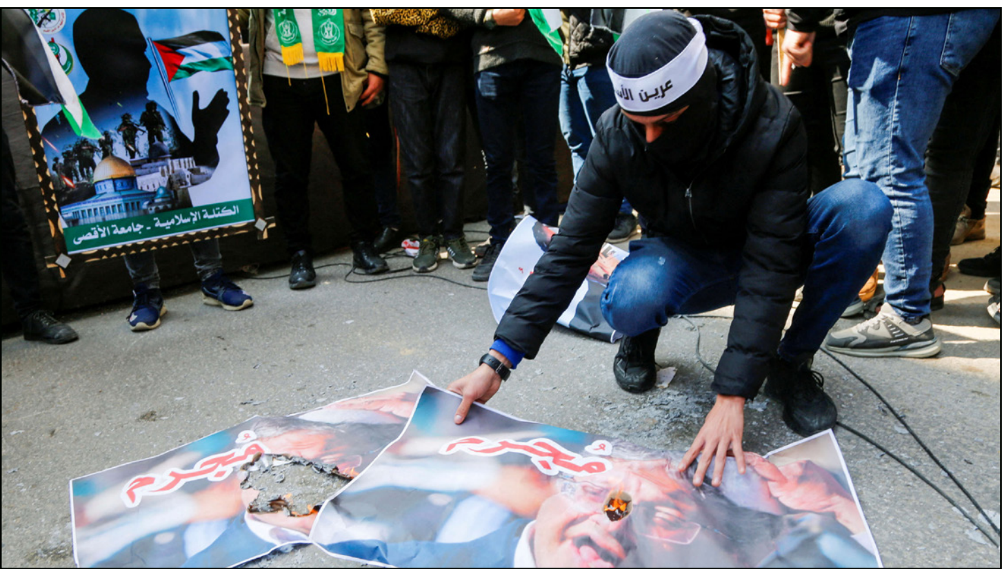
فلسطينيون يحتجون ضد اجتماع العقبة ويحرقون صور المتطرف بن غفير في غزة

زاد معدل طرح السؤال مع احتجاج وغياب وزير