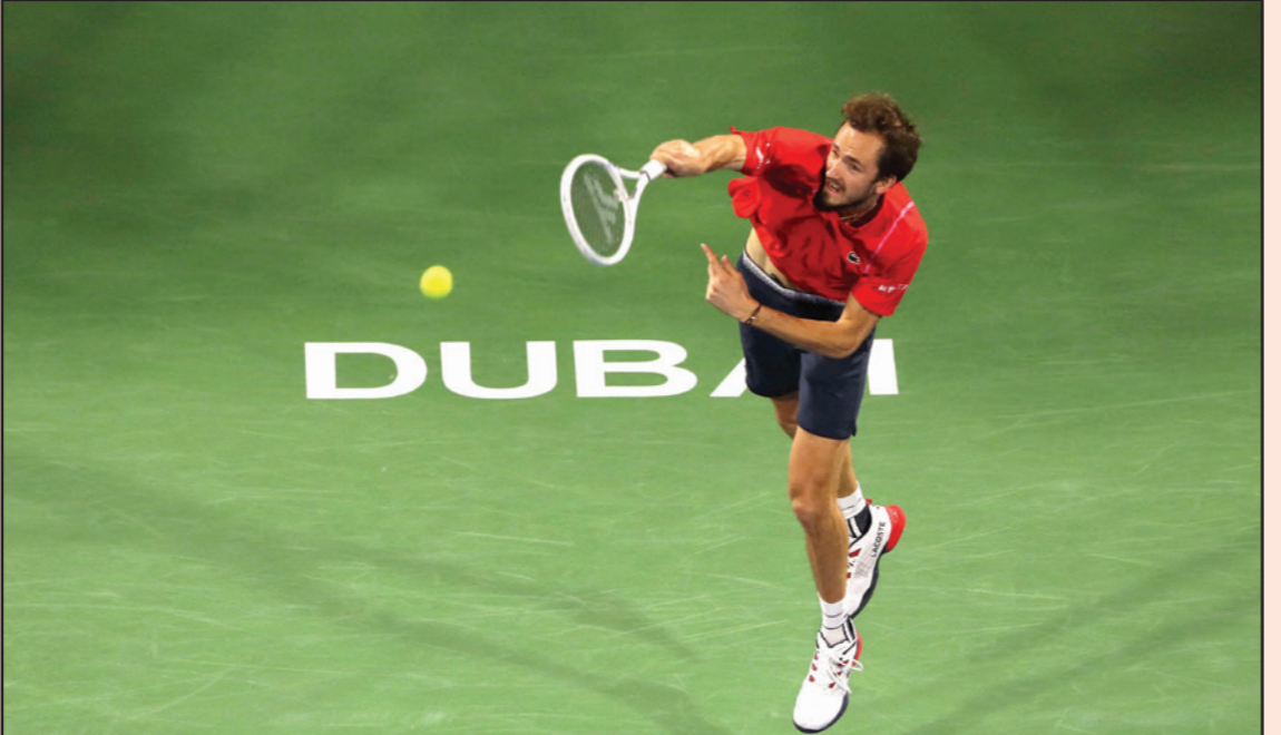
روبليف تالّق بالانتصار على ديوكوفيتش ليتأهل إلى المباراة النهائية

دبي - أ ف ب: حقق الروسي دانييل مدفيديف المصنف سابعيا عالميا الخسارة الأولى بالصربي نوفاك ديوكوفيتش الأول عندما تغلب عليه 6-4 و6-4 في نصف نهائي دورة دبي للتنس. وضرب مدفيديف الذي أوقف سلسلة 20 فوزا متتاليا ديوكوفيتش التوج بلقب بطولة استراليا المفتوحة، أولى البطولات الأربع الكبرى، مطلع العام الحالي، مودعا مع مواطنه أندري روبليف السداس وحامل اللقب والفائز على الألماني ألكسندر زفيريف 6-7 و7-6 (9-11) واحتاج روبليف إلى ساعة و58 دقيقة لتحقيق فوزه الأول