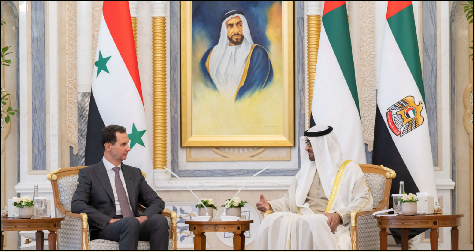
محمد بن زايد لدى استقباله الأسد في أبو ظبي في 19 الشهر الحالي

بجمع مواد يمكن أن تضع المسؤولين البارزين في رمي انتباه المحققين الدوليين. ومن أهم مظاهر القلق هي كيفية تحقيق الاستقرار في المناطق الخارجة عن سيطرة النظام، والتي تعتمد بشكل كبير على الدعم الخارجي، ولم يظهر الأسد أي استعداد للتصالح بطريقة ذات معنى مع هذه المناطق،