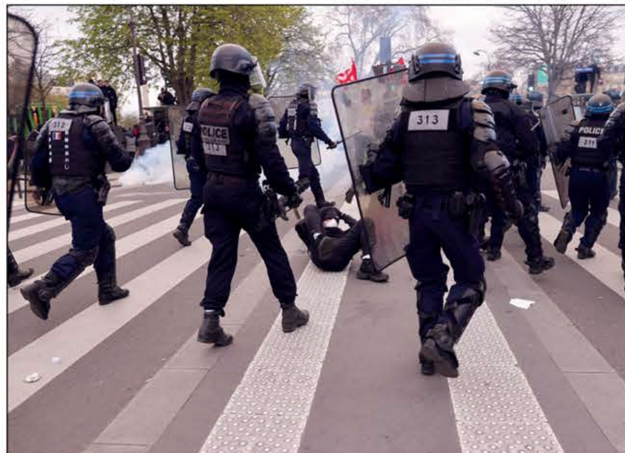
أحد المصابين وحوله عدد من رجال الشرطة