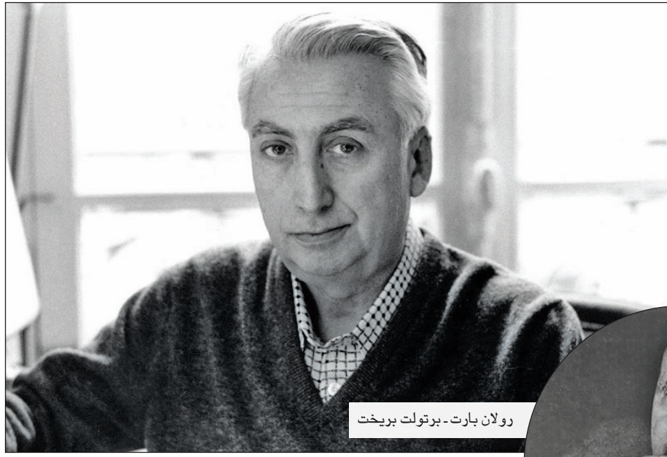
رولان بارت- برتولت بريخت

كما يعتمد بارت في بحثه على دراسات بيبليوغرافية لا تختلف كثيراً عن الشكلائية الروسية وفتيات التلقي، فهو يدور في فلك الكتابات الطويلة، ومن ثم يتوقف عند كل ما هو أكثر أهمية، متقاطعا في معظم الأحيان مع ما يقول الكاتب روث غوروسينسارد: «إذا كان من اللازم توصيف العمل المبرع سنقول بسورور إن كل صغير جميل!».