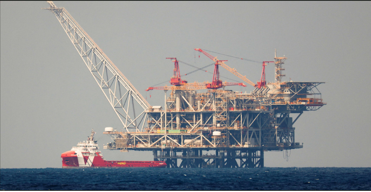
منصة لاستخراج الغاز في حقل ليفيathan البحري الإسرائيلي

■ القدس - لندن - وكالات: أعلنت مجموعة «نيو ميد إنرجي» الإسرائيلية للغاز أمس الثلاثاء تلقيها عرضاً لشراء 50% من رأس مالها من كل من شركة «بريتش بترول» وشركة «بترو أوبولسي الوطنية» أدنوك الإماراتية في مقابل أربعة مليارات دولار. وأكدت «بريتش بترول» في بيان صحفي تقديمها العرض من دون الإفصاح عن قيمته، وتمتلك «نيو ميد إنرجي» حقوقاً استغلالاً أكثر من 45 في المئة من حقل «ليفياثان» الأكبر في إسرائيل الذي تديره وينتج 12 مليار متر مكعب من الغاز يتم ضخه إلى إسرائيل ومصر والأردن. كما تمتلك 30 في المئة من حقل أفوديت الواقع قبالة قبرص. وتمتلك مجموعة «ديليك» الإسرائيلية نحو 55 في المئة من «نيوميد»، وتدرس «نيوميد» منذ 2022، بناء أول محطة لتصدير الغاز الطبيعي المسال في إسرائيل، ما يمكنها من إرسال شحنات الوقود مباشرة بيسعة 4.5 مليون طن، وستكون واحدة من أكبر منشآت التصدير العائم في العالم. من جانبها أكدت الشركة الإسرائيلية أن العرض الذي تلقته من «غير ملزم» مشيرة إلى تعيين لجنة تدقيق لدراسة تفاصيل الصفقة التي ستشمل شراء جميع أسهم الشركة الإسرائيلية المتداولة وجزء بسيط من الأسهم التي تمتلكها شركة «ديليك» الإسرائيلية العملاقة القابضة وهي إحدى الشركات المتفرعة عن «نيو ميد» وقالت «بريتش بترول» إنها «قدمت مع أدنوك» عرضاً غير ملزم للاستحواذ على شركة «نيو ميد إنرجي» الخاصة من خلال الاستحواذ على الأسهم المتداولة وعلى جزء من حصة «ديليك» بحيث تمتلك 50 في المئة من «نيو ميد إنرجي». وفي بيانها، اعتبرت «بريتش بترول» أن الصفقة «خطوة أولى مهمة» في ظل رغبتها و«ادنوك» في إنشاء شركة جديدة مشتركة تركز على تطوير الغاز في المجالات الدولية ذات الاهتمام المشترك بما في ذلك في شرق البحر المتوسط.