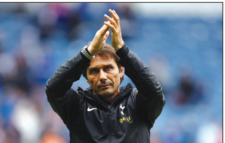
كونتي يشكر جماهير توتنهام بعد تجربة عاصفة في النادي

وترك كونتي الذي تولى المنصب في تشرين الثاني/نوفمبر 2021، مهمة قيادة الفريق لساعده كريستيان ستيليني في نهاية الموسم. وغادر كونتي النادي اللندني وهو يحتفل المركز الرابع في الدوري الممتاز لكن بفارق