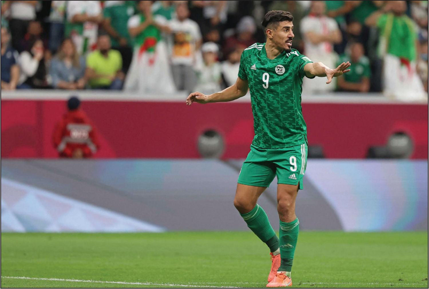
بونجاح سجل هدف الفوز والتاهل للجزائر في مرمى النيجر