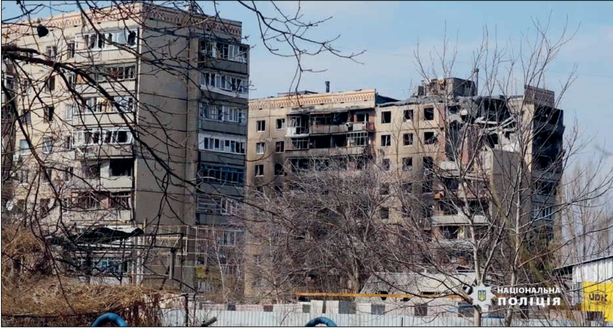
مبان مدمرة في دونيتسك

وتصنّف كيف على حاجتها لهذه الأسلحة لتدمير خطوط الإمداد الروسية وبالتالي تعويض النقص في قوتها البشرية وفي الذخيرة استعداداً لهجومها المضاد المرتقب لصد القوات الروسية التي تحصل أجزاء كبيرة من جنسوب أوكرانيا وشرقها. ويمكن تسليم الجيش الأوكراني راجمات «هايمارس» الثقيلة العالية الدقة وصواريخ