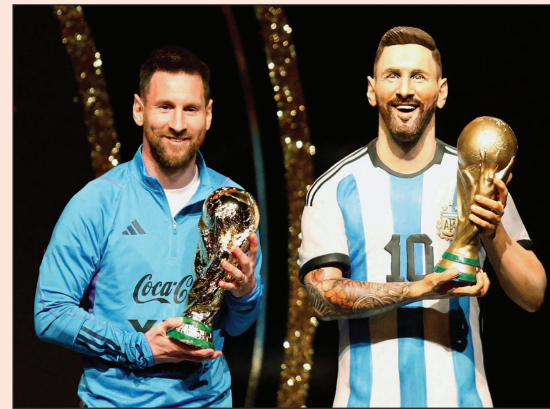
ميسي (يسار) إلى جانب تمثاله الذي سيوضع في متحف الاتحاد القاري

لم نستوعب بعد معنى أن نكون أبطال العالم، وفازت الأرجنتين وديا على بنما 2-0 الخميس في بوينس آيرس التي احتفلت بلاعبها في أول مباراة بعد المونديال. سنتالتي كوراساو مستفوا أيضا هذا الموسم مع فريقه في شمال البلاد في سانتياغو دل إيستيرو.