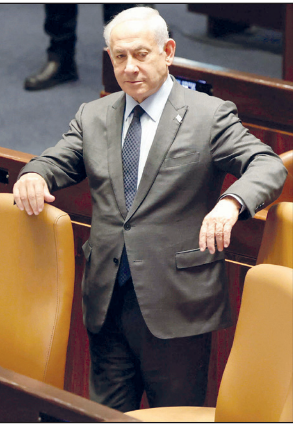
رئيس وزراء الكيان الصهيوني بنيامين نتنياهو

ويضيفان: «لقد شعرنا أن الأكل فيه شعر، كان اليبس مسلوخا من الحرارة، وعندما أخذنا بالصراخ حضرت إدارة السجن وتبين أن قسط سقظ