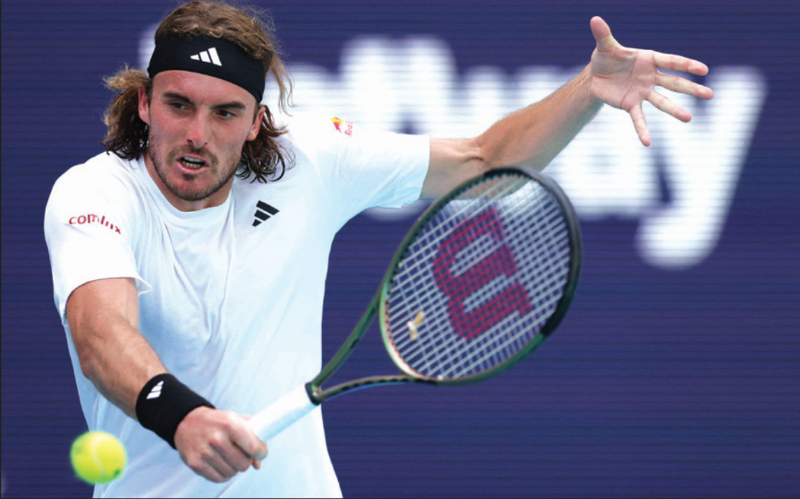
تسيتسيباس انتصر على التشيلي غارين

بلغت الأمريكية جيسिका بيغولا الثالثة الدور ثمن النهائي بفوزها على البولندية ماغدا لينيت العشرين 6-1 و7-5، وضربت بيغولا موعدا في الدور المقبل مع الروسية أناستاسيا بوتابوفا السابعة والعشرين والتي تغلبت على الضيئة جينغ كينوين الثالثة والعشرين 6-4 و7-6 (4-7). كما تاهلت الى الدور ذاته الايطالية مارتينا تريفيزان الخامسة والعشرون بتغلبها على اللاتفية ليلينا أوسباتنكو الرابعة والعشرين 6-3 و6-3. وتلعب تريفيزان في الدور المقبل مع الكازاخستانية إيلينا ريباكينا العاشرة أو البلجيكية إيلين مرتنز. وحجزت الرومانية سورانا سيرستيا بطاقتها بفوزها على التشيكية ماركيتا فوندرسوف 7-6 (7-6) و6-4 (3-6).