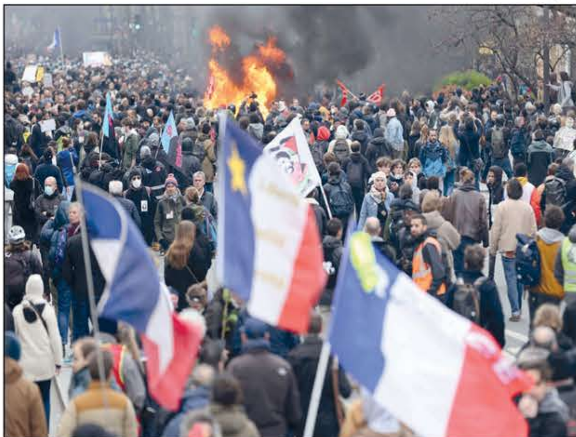
متظاهرون ضد قانون التقاعد

وأضاف أنه تم إجراء 10 آلاف عملية تدقيق في الهويات خلال التظاهرة. وأشجار صحافيون إلى إصابة شخصين على الأقل تولى «مسعفون متطوعون» علاجهم. وأصيب أحد هذين الصحافيين في رأسه، والآخر في ساقه وهو صحافي وجروحه طفيفة. كما اشتبك متظاهرون مع قوات أمنية في مدينة نانت (غرب) فيما أغلق أعضاء نقابات في باريس محطة «غار دو ليون» للسكك الحديدية بالسير على القضبان. وقالت نقابة «CGT» الفرنسية إن نحو 450 ألف شخص تظاهروا في باريس في اليوم العاشر من التعبئة ضد إصلاح نظام التقاعد، فيما تحدث وزير الداخلية جيرالد دارمانان عن نشر «13 ألف شرطي بينهم 5500 في باريس» في تعزيزات «غير مسبقة». وزاد «سنحل المجموعات المتطرفة ولن نسمح بالعنف»، فيما أكد الناطق باسم الحكومة، أوليفييه فيران، أن الحكومة «حصن ضد العنف غير المشروع». وفي مدينة نانت، التي تظاهروا مقدوات على قوات الأمن التي ردت بالغاز المسيل للدموع، وأضرمت نيران في فرع لصرف وفي حاويات قمامة حول محكمة المدينة. في حين قطع متظاهرون في نانت الطرقات المؤدية إلى