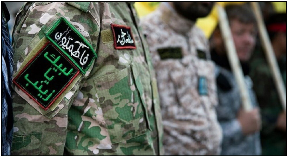
عناصر من لواء قاطمون في سوريا