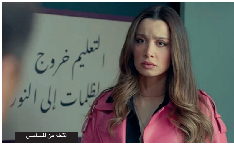
لقطة من المسلسل

يتناول المسلسل بعض الظواهر والسلوكيات في المدارس الثانوية مثل ترويح المخدرات والعلاقات العاطفية بين المراهقين، فضلا عن تعامل التلاميذ مع هيئة