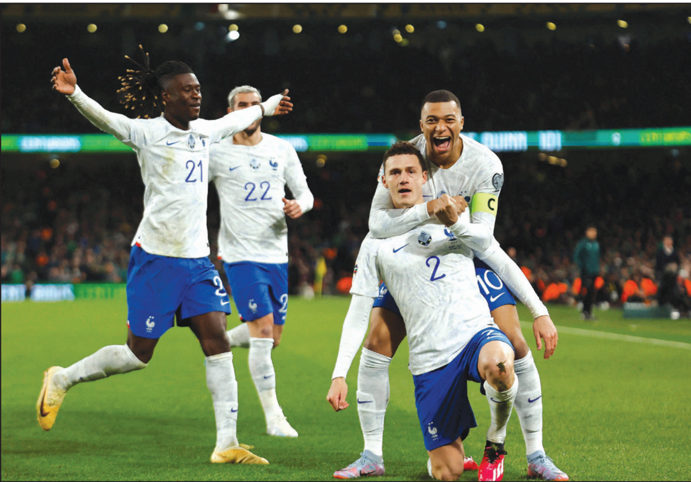
بافار (2) يحتفل مع زملائه بعد تسجيله هدف الفوز لفرنسا في مرمى إيرلندا

تعدلت (41)، وفي المجموعة ذاتها. تعادلت مولدافيا مع تشيكيا سلبا. وعززت تشيكيا صدارتها بأربع نقاط بفارق نقطة أمام بولندا ونقطتين أمام مولدافيا، فيما بقيت البانيا بلا نقاط في المركز الأخير مع جزر فارو.