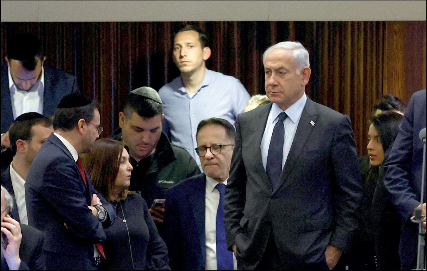
ننتياهو داخل الكنيست الإسرائيلي

دهور كل الدولة وجهاز الأمن والجمع والاقتصاد إليها. هو رئيس الحكومة الأول الذي نجح في التوحيد بين المشغافين والعمال، بين الإيرانيين والسعوديين. خلال أقل من تسعين يوماً على تشكيل الحكومة الميمنية، دمر دولة وحزبها، وصورة الشخصية. أول أمس، في خطوة