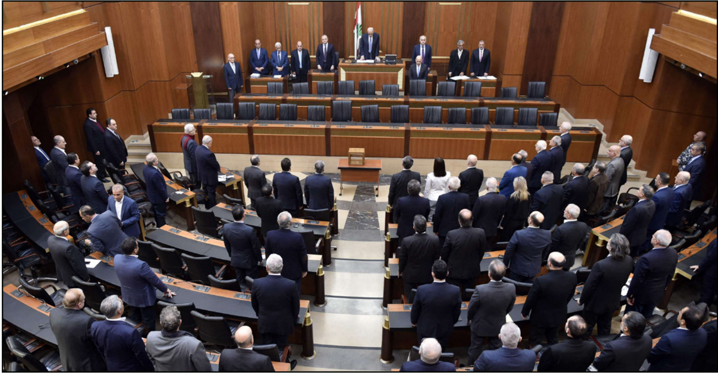
إحدى جلسات البرلمان اللبناني

وقد سُمع الصراخ خارج قاعة الجلسات، وصرّح الجميل