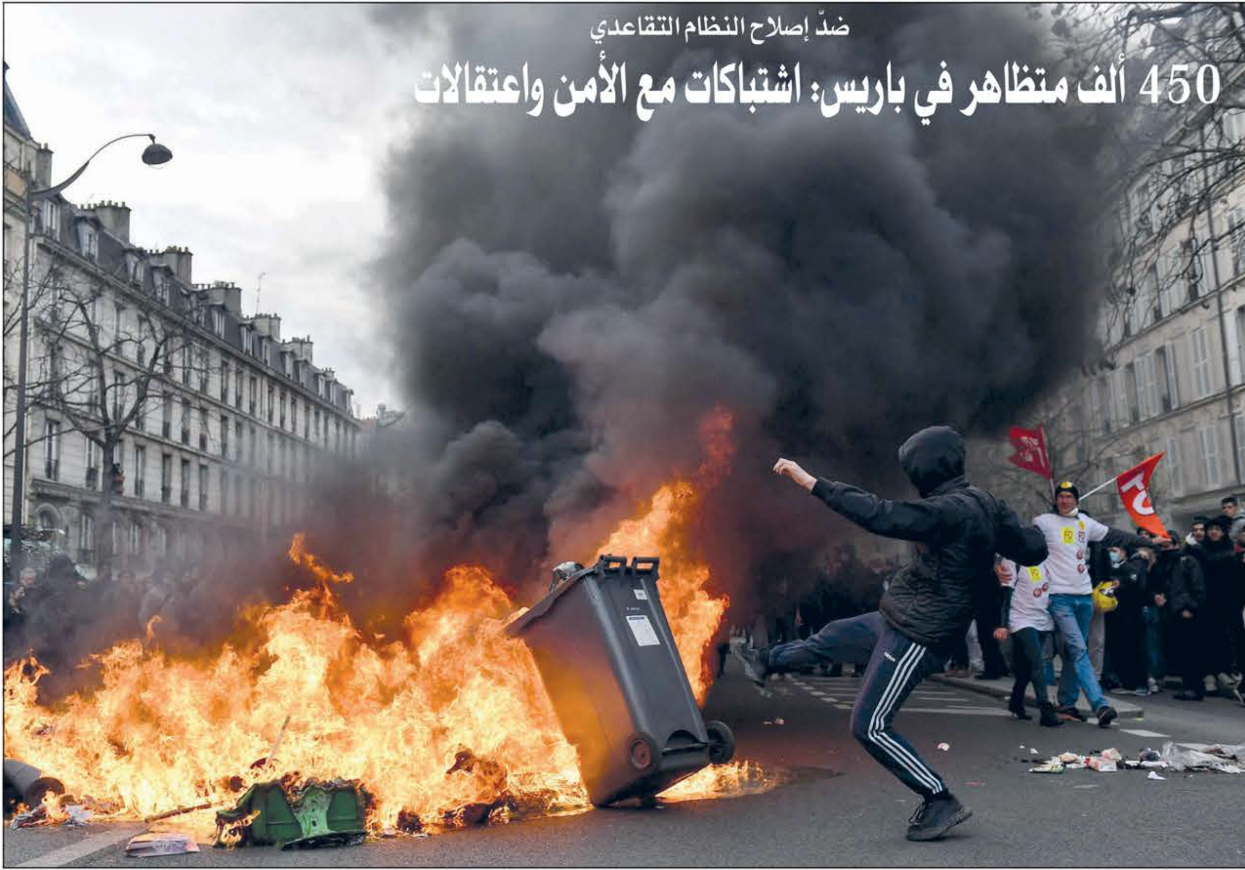
من الصدامات بين الشرطة والمتظاهرين في باريس