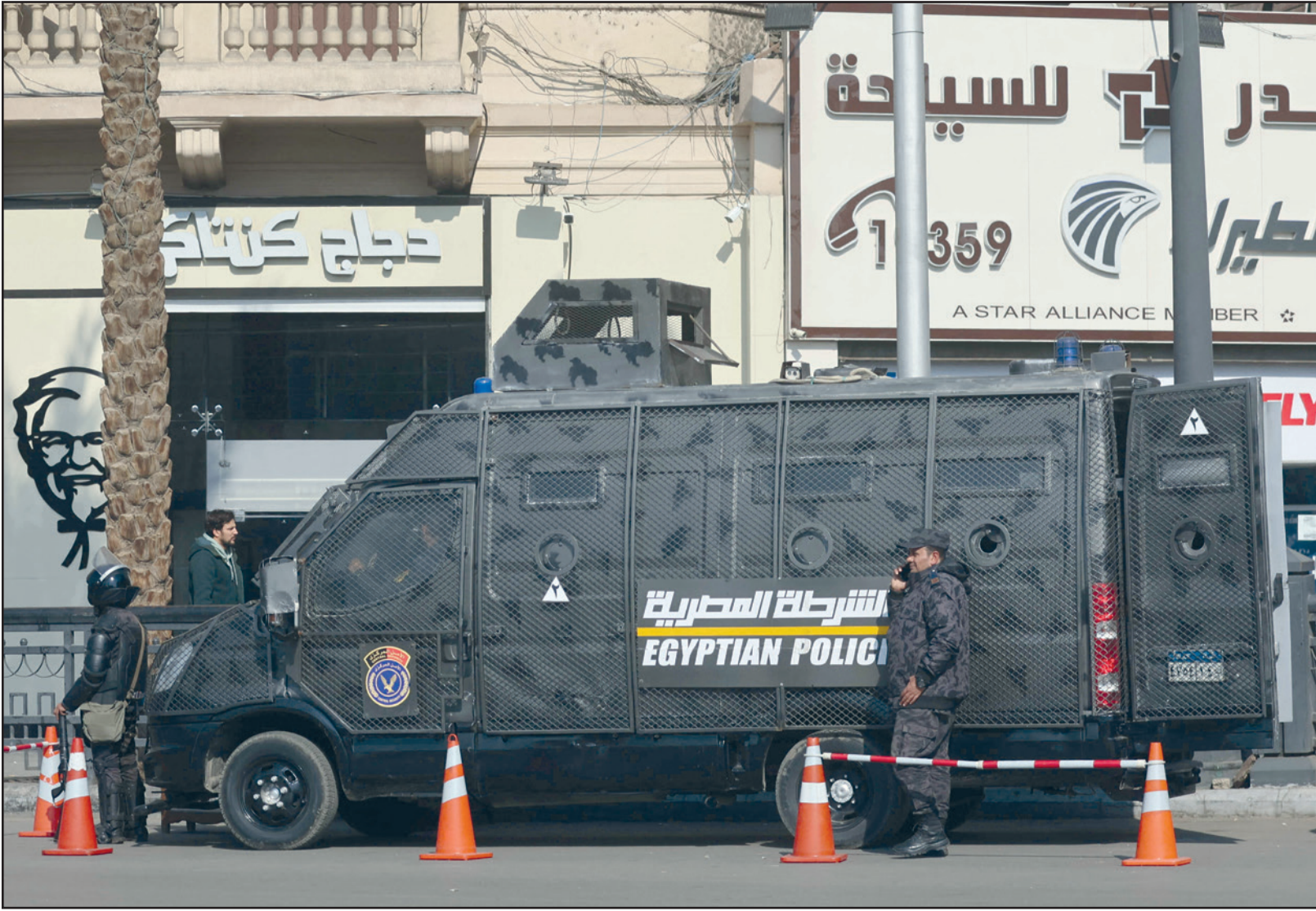
القاهرة - «القدس العربي»