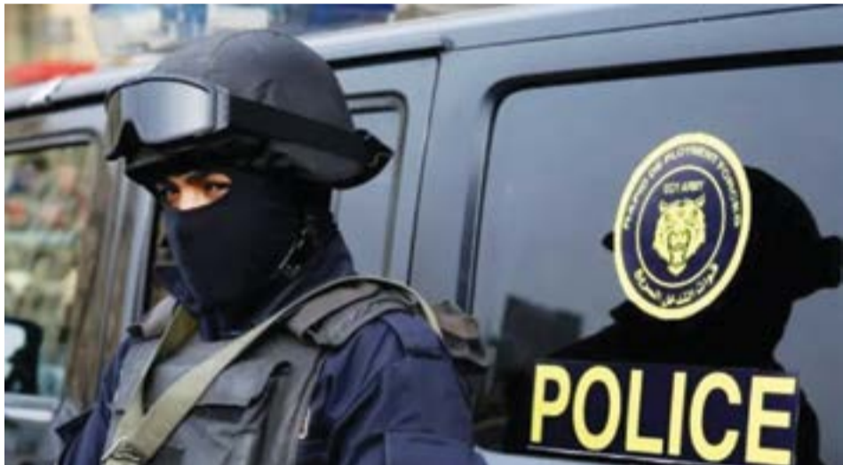
لندن- «القدس العربي»:»