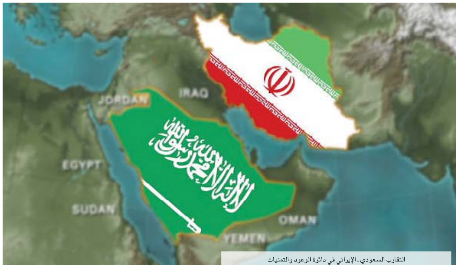
التقارب السعودي- الإيراني في دائرة الوعود والتحديات

يتابع السوريون الذين ثاروا على استبداد وفساد السلطة الأسدية قبل 12 عاماً، وهم يشكلون غالبية السوريين، بقهر غير مسبوق أنباء انفتاح الدول العربية على السلطة المعنية. يتابعون الاتصالات التي تجري معها، والزيارات التي يقوم بها مسؤولون عرب إلى دمشق وتلك التي قام بها بشار الأسد والمسؤولون في سلطته إلى العديد من الدول العربية.