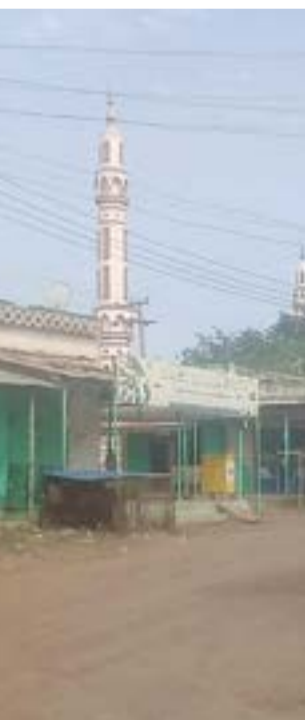
صورة من مدينة كادوقلي

على المتعة الفاتحة وسحر الطبيعة الخلابة، ويشار إلى أن المدينة تقع في الحزام السوداني المطير ومنطقة السافانا الغنية، وهي بذلك تتميز بصيف حار ممطر تتراوح أعلى درجات الحرارة فيه ما بين 39 درجة مئوية في شهر نيسان/أبريل و31 درجة مئوية في آب/أغسطس وتتراوح درجات