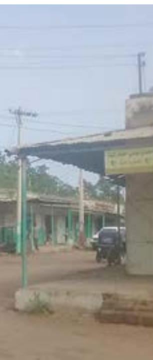
صورة من مدينة كادوقلي