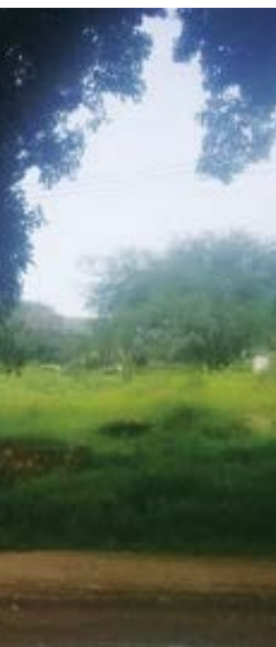
صورة من مدينة كادوقلي

«الدعاش» أو الرائحة التي تعقب نزول الأمطار سوف تعطر الشوارع والأزقة القديمة كالعادة بينما تمنح السكان دفعة كبيرة من النشاط، وقد تلمح ذلك بحبوبة الناس وإيقاع الحياة المتسارع في كل مساحة ممكنة، حتى بين صخور الجبال السوداء، بينما مثل منظر اخضرار السهول يشكل يطلقه بعض السودانين تديلا.