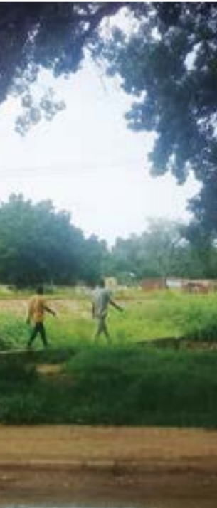
صورة من مدينة كادوقلي

الملك أو الملك رحال، يقول بعض المؤرخين أنه هو الحاكم السادس الذي امتد حكمه إلى عام 37 في