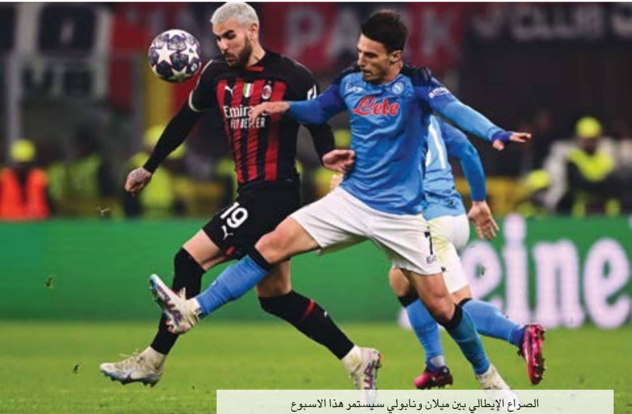
الصراع الإيطالي بين ميلان ونابولي سيستمر هذا الاسبوع

سرعان ما تلاشى الخوف المدريدي من هاجس شخصية تشلسي المضطربة في دوري الأبطال، على غرار نسخة 2012، عندما خالف كل التوقعات وتوج بالكأس ذات الأذنين، في واحد من أتعس مواسمه المحلية، وبالمثل ما حدث في معجزة طيب الذكر توماس توخيل في العام قبل الماضي، وذلك بعد ظهور الفوارق الجذرية والجماعية بين الفريقين، مع انطفاء الحماس اللندني في الشوط الثاني، وما زاد الطين بلة بالنسبة للمدرّب فرانك