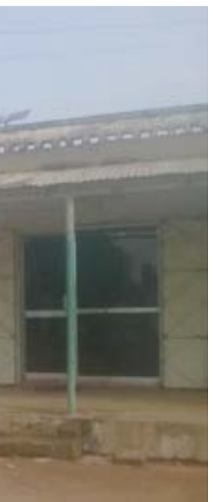
صورة من مدينة كادوقلي