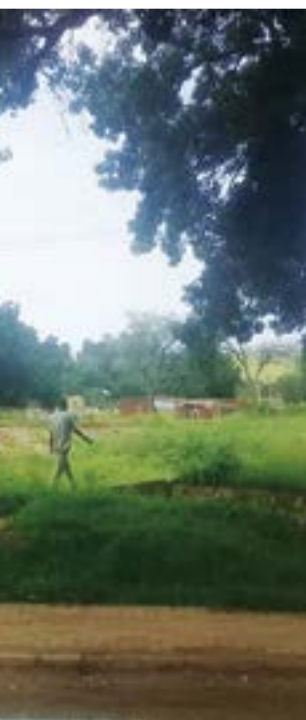
صورة من مدينة كادوقلي

على المتعة الفاتحة وسحر الطبيعة الخلابة، ويشار إلى أن المدينة تقع في الحزام السوداني المطير ومنطقة السافانا الغنية، وهي بذلك تتميز بصيف حار ممطر تتراوح أعلى درجات الحرارة فيه ما بين 39 درجة مئوية في شهر نيسان/أبريل و31 درجة مئوية في آب/أغسطس وتتراوح درجات