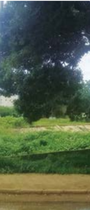
صورة من مدينة كادوقلي

اليوم تعتبر كادوقلي أحد المراكز المهمة في تجارة الصمغ العربي والمواشي، وتوجد فيها بعض الصناعات الخفيفة مثل الغزل والنسيج والصابون وديباغة