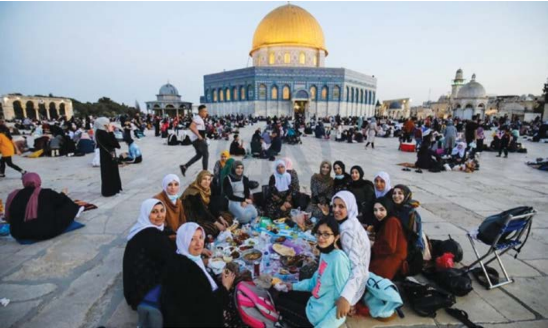
لندن- «القدس العربي»:»

أطلق نشطاء فلسطينيون وأصدقاء لهم من خارج الأراضي المحتلة حملة إلكترونية على شبكات التواصل الاجتماعي دعوا فيها للاستغفار في المسجد الأقصى عبر تناول طعام الإفطار في ساحاته ومن ثم المشاركة فيه صلاة التراويح بداخله، وهي الحملة التي سرعان ما انتشرت كالنار في الهشيم وتحولت سريعاً إلى حشد بالآلاف للفلسطينيين أخذوا معهم طعام الإفطار وتناولوه داخل ساحات المسجد الأقصى المبارك.