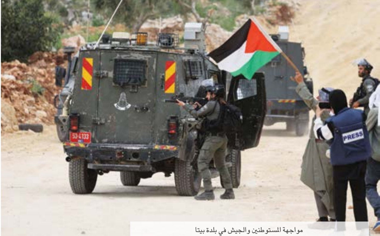
مواجهة المستوطنين والجيش في بلدة بيتا

المعارضة للتغيرات التي تريد حكومة نتنياهو ادخالها في النظام القضائي في إسرائيل. واضطر نتنياهو إلى الإعلان عن وقف اقتحامات المستوطنين للمسجد الأقصى حتى نهاية شهر رمضان، ولم ترد إسرائيل على الهجمات الصاروخية في الوقت الذي اتهمت فيه حركة حماس بالوقوف وراءها.