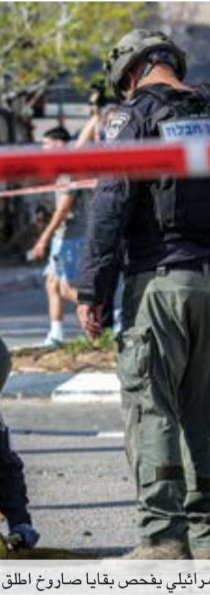
الجيش الإسرائيلي يفحص بقايا صاروخ أطلق من جنوب لبنان

ويعكس التعاون زيادة ملحوظة في النشاط على طول الحدود الشمالية لإسرائيل، وكذا التنسيق القوي بين حزب الله وحماس والجهد الإسلامي الفلسطيني،