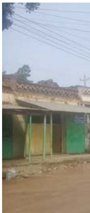
صورة من مدينة كادوقلي

على المتعة الفاتحة وسحر الطبيعة الخلابة، ويشار إلى أن المدينة تقع في الحزام السوداني المطير ومنطقة السافانا الغنية، وهي بذلك تتميز بصيف حار ممطر تتراوح أعلى درجات الحرارة فيه ما بين 39 درجة مئوية في شهر نيسان/أبريل و31 درجة مئوية في آب/أغسطس وتتراوح درجات