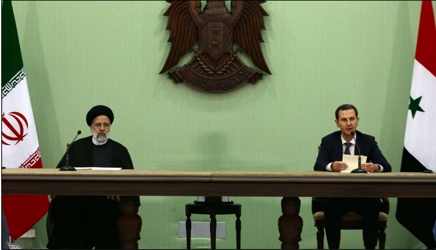
الأسد ورئيسي خلال لقائهما في دمشق أمس

2010 بعد ما يمكن أن نسماه دبلوماسية الزلزال حيث اكتشف الكثير من الانفتاح العربي وأيضاً الاستعداد التركي للتطبيع مع دمشق، وذلك أمام متغيرات عالمية. وأضاف: يحاول رئيسي في هذه الزيارة، تركيز حصة أساسية لبلاده، وذلك من خلال اتفاقيات أمنية ودفاعية وثقافية واقتصادية، وكل هذا ليقول إن وجوده في سوريا ليس وجوداً عسكرياً وأمنياً فحسب، بل هو وجود متعدد ومترايب الجوانب. طهران تريد تكريس الأمر الواقع، كما تهدف إلى الاستحواذ على سوريا، وفق رؤية المتحدث حيث قال هناك جهد كبير مع هذا الوفد الضخم الذي جاء مع رئيسي من مستشارين ووزراء وبرلمانيين، وضباط استخبارات كل هذا من أجل ترجمة ذلك إلى وقائع. وأضاف: حتى يحكى عن استبدال أراضٍ مقابل ديون لإيران وحسب مصادر سورية مولية فقد تقاسمت إيران رغبته الخبز مع دمشق واعطتها الكثير من الأموال في لحظات صعبة ولذلك هي تطالب بأموالها وتحاول أن تحجز مكانها وتؤكد أنها شريكة في صنع قرار دمشق. واعتبر البرلماني العراقي السابق والخبير في العلاقات الدولية د.عمر عبد الستار أن «النطق بقول إن الزيارة تأتي في ظل الصلح السعودي- الإيراني، بينما يحكم الديموقراطيون الولايات المتحدة الأمريكية». وأضاف لـ «القدس العربي» أن الوفد الإيراني المرافق لرئيسي وقع اتفاقيات عديدة صناعية وزراعية وتجارية وهذا يؤكد على تمدد يد إيران في الجانب الاقتصادي، كما يشير إلى قوتها المتصاعدة في سوريا كما هو الحال في لبنان وبغداد، وذلك في ظل التطبيع مع العربية السعودية.