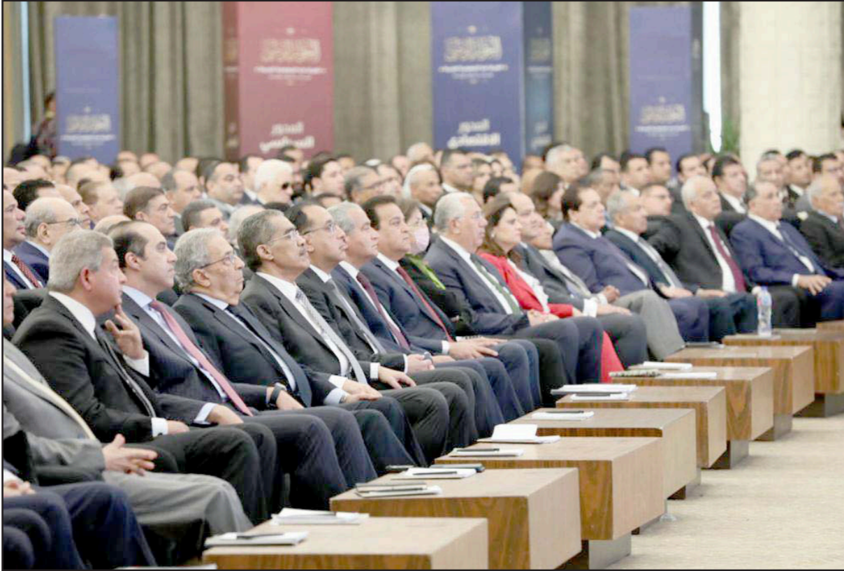
من جلسة افتتاح الحوار الوطني في مصر أمس

وأضاف «الرسالة هي أن سياسة القبضة والتقييد على الحريات سوف تتواصل، شاملة النساء، وأن مشاركة الحركة المدنية في الحوار ينبغي أن تكون منضوية». وكان الرئيس المصري عبد الفتاح السيسي قد دعا لعقد حوار وطني في أبريل/ نيسان 2022، وأعاد تشكيل لجنة العقوف الرئاسية لتضم رموزا من المعارضة، في وقت تنتقد أحزاب المعارضة ومنظمات حقوقية ما تصفها بـ «سياسة التقييد التي تتبعها السلطة في الإفراج عن سجناء الرأي».