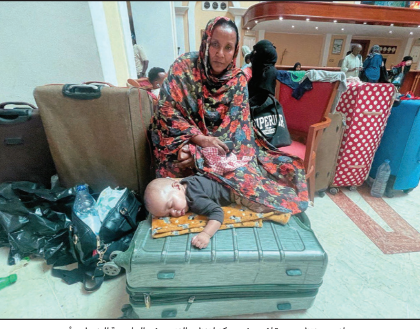
سودانيون ينتظرون حقايقهم في مركز لتنظيم النزوح في العاصمة الخرطوم أمس

بعد ساعات قليلة من إعلان الرئيس الجنوب سوداني سلفاكير ميارديت، موافقة طرفي القتال في البلاد، الجيش السوداني وقوات «الدعم السريع» على هدنة تمتد لسبعة أيام، تبدأ اليوم الخميس، وتفي مجلس السيادة الموافقة على أي وساطة لإنهاء الحرب، شهدت منطقة وسط وشمال الخرطوم معارك عنيفة خلفت قتلى وجرحى. وأفاد شهود عيان تحدثوا لـ «القدس العربي» عن وجود جثث متناثرة لأفراد يرتدون زي الشرطة في منطقة سوق العربي ومحطتي الباشدار وشروني القريبة من القصر الرئاسي، حيث سمع دوي انفجارات وتبادل إطلاق نار من اتجاه السوق وتصاعدت السحب الدخانية. وبعد يومين من إعلان السلطات السودانية نشر قوات شرطة الاحتياطي المركزي في أنحاء الخرطوم، للحد من التفجرات الأمنية لأشخاص «الدعم السريع» إن تلك القوات «تتأهب ظل تابعة للنظام السابق وترتدي زي الشرطة»، واعتبرها مهددة لبقائه. وبالفعل، اشتبكت قوات الدعم وشرطة الاحتياطي المركزي، نظيرة أمس الأربعاء، في محطة شروني والسوق العربي وسط الخرطوم. وحسب شهود عيان تحدثوا لـ «القدس العربي»، كانت معظم الجثث المتناثرة على امتداد منطقة وسط الخرطوم، القريبة من القصر الرئاسي، لأشخاص يرتدون زي الشرطة والتي لم يبد أنها كانت مزودة بأسلحة ثقيلة مثل المقائيل في الجانب الآخر. واعتبرت شرطة الاحتياطي المركزي، في بيان أمس ما حدث امتداداً لما وصفها بـ «خروقات ميليشيا الدعم السريع». في المقابل، قالت قوات «الدعم السريع»، إنها