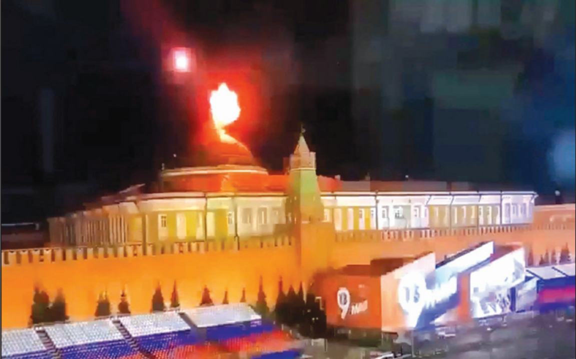
مشهد لتفجير الطائرة فوق بقية الكرملين أمس

لندن - «القدس العربي» - وكالات: تعرّض قصر الرئاسة الروسي في موسكو، أمس الأربعاء، لهجوم بمسيرتين، وهو ما اعتبره الكرملين محاولة فاشلة لاغتيال الرئيس الروسي فلاديمير بوتين، متهماً كيف بالمسؤولية. وبعد ذلك ساعات استهدفت قوات موسكو بقصف مكثّف منطقة خرسون في جنوب أوكرانيا، ما أسفر عنه مقتل 16 شخصاً وإصابة 22 آخرين بجروح، حسب ما أفادت النجاة العامة، بينما أعلنت السلطات فرض حظر تجول في المدينة الرئيسية التي تحمل الاسم عينه ابتداءً من مساء الجمعة. ونفت كيف أي صلة لها بالواقعة التي أفاد بها الكرملين، وقال أحد كبار معاوني الرئيس الأوكراني فولوديمير زيلينسكي إنها إشارة على أن الكرملين يخطط لهجوم كبير جديد على أوكرانيا، وقال الكرملين في بيان - «طائرات مسيّرتان استهدفتا الكرملين، ونتيجة للإجراءات التي اتخذها الجيش والأجهزة الأمنية الخاصة في الوقت المناسب باستخدام أنظمة الرادار تم تعطيل الطائراتين». وأضاف: «تعد هذه الأفعال عملاً إرهابياً مخططاً له ومحاولة لاغتيال الرئيس قبيل الاحتفال بيوم النصر وموكب التاسع من مايو/أيار الذي من المقرر أيضاً أن يحضره ضيوف أجانب». وقال بيان الكرملين إن شظايا الطائرتين المسيّرتين تناثرت في أراضي مجمع الكرملين لكن لم تقع إصابات أو أضرار مادية. وقال عمدة موسكو، سيرغي سوبيانين، إنه سيتم حظر إطلاق الطائرات المشّرة في سماء المدينة اعتباراً من اليوم، باستثناء تلك التي تستخدم بقرار من سلطات الدولة.