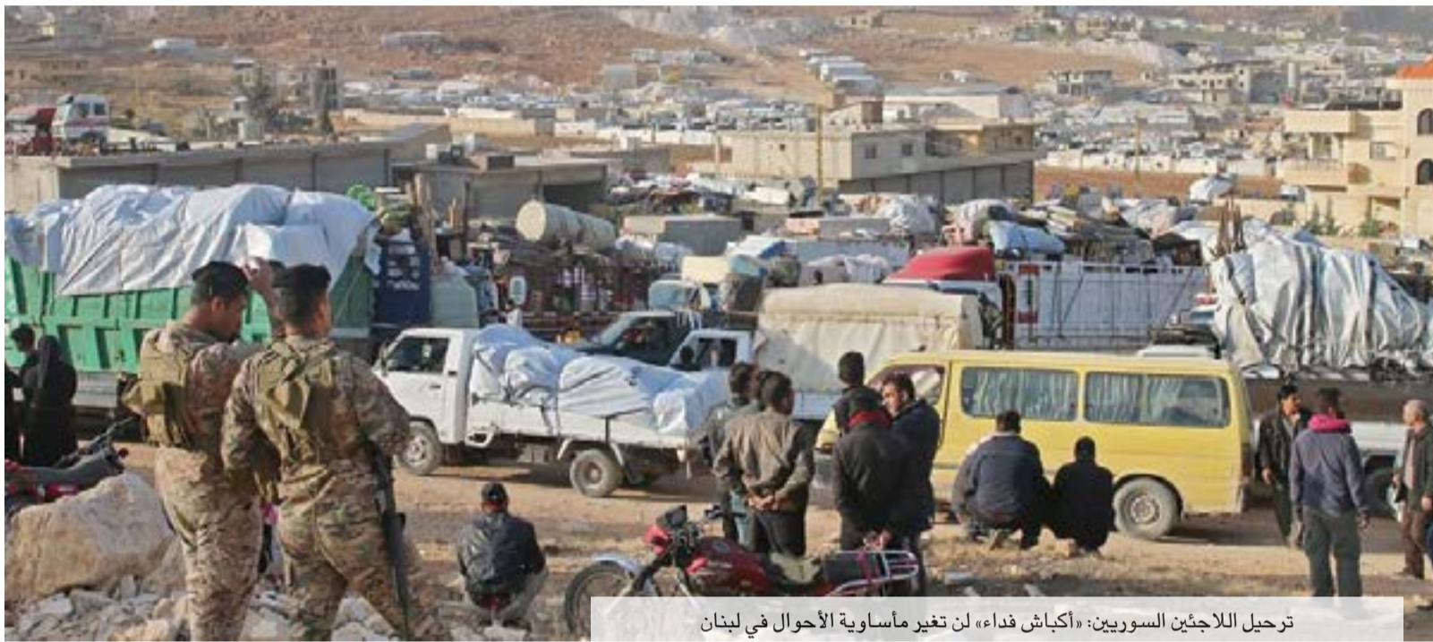
ترحيل اللاجئين السوريين: «أكباش فداء» لن تغير مأساوية الأحوال في لبنان