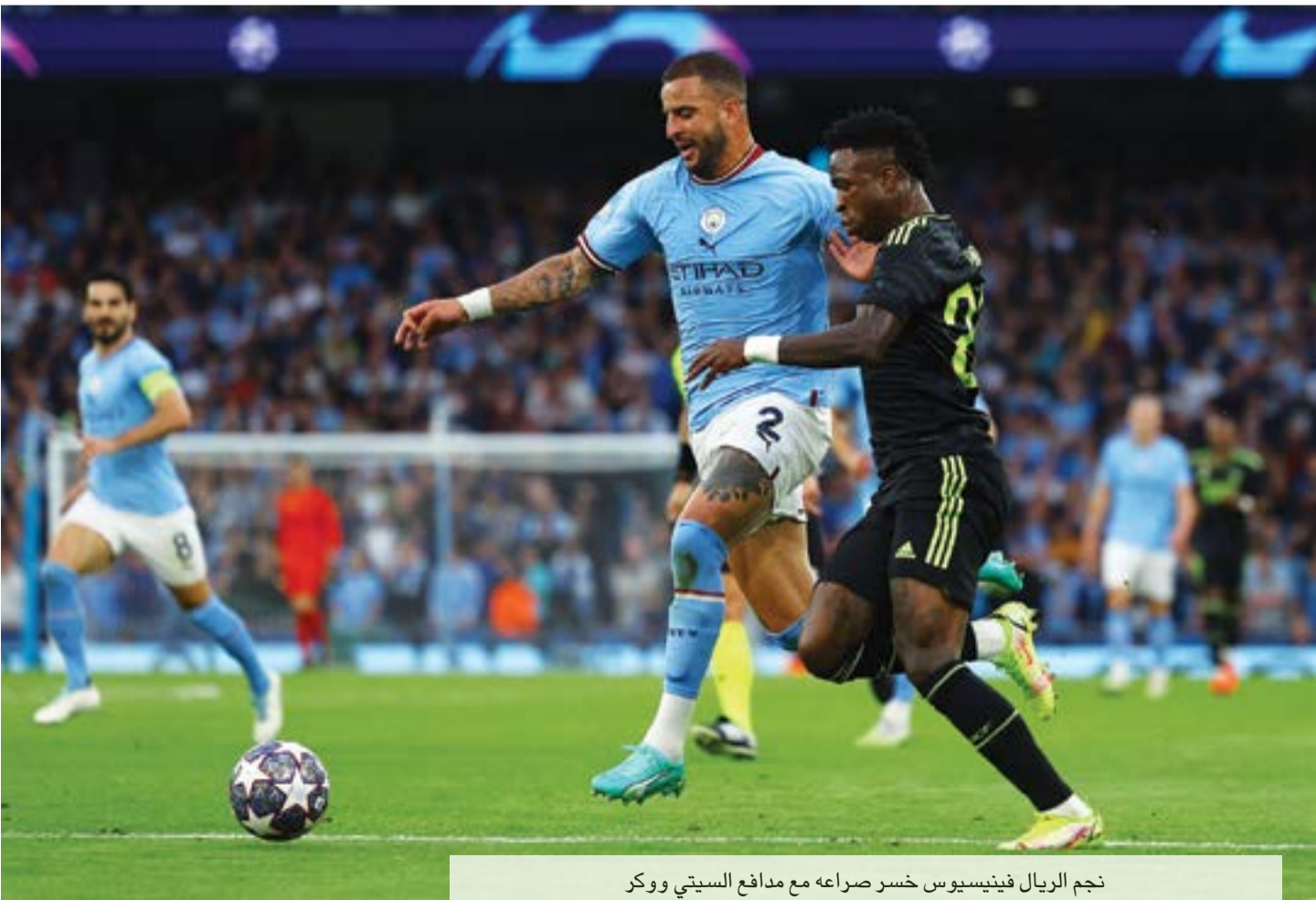
نجم الريال فينيسيوس خسر صراعه مع مدافع السيتي ووكر

بالنسبة لريال مدريد، فمن المؤكد ستكون هناك الفريق من برائن الضياع، لتجنب مواجهة مصير برشلونة بعدما فقد الكثير من هيئته وشخصيته عقب ريمونتادا «الرابع سجله أوريغي»، وهو نفس سياق التصحيح، حيث ستكون هناك وقفة كبيرة مع الأسماء التي تتقاضى عشرات الملايين، من دون أن تقدم إضافة ملموسة للفريق، وعلى رأسهم أسوأ صفقة كبرى أبرمها النادي في تاريخه إيدين هازارد، الذي قدم كل أوراق فشله في تجربته المديرية، باستسلامه للجنة الإصابات، وظهوره بنسخة متواضعة للغاية في دقائق لعبه المحدودة منذ العام 2019 وحتى وقت كتابة هذه الكلمات، فضلا عن حاجة الفريق للتخلص من صداد النقص العددي الحاد في مركز الظهير الأيسر، بسبب كثرة إصابات الزجاجي الفرنسي فيرلاند ميندي، ونفس الأمر يطبق على داني كارخال في مركز الظهير الأيمن، الذي يحتاج دماء جديدة بجودة وكفاءة القميص الأبيض، إلى جانب التخلص من اللاعبين الموظفين وما أكثرهم، نتذكر منهم ماريانو دياز والغارو أودريوزولا وباقي الأحمال الزائدة في الفريق. وفي المقابل، سيتعين على الرئيس بيريز ومجلسه المعاون، اقتحام الميركاتو الصيفي من الباب الكبير، للتخلص من نقاط الضعف والمشاكل التي يعاني منها الفريق، مثل صداد عدم وجود بديل للهداف كريم بنزيمة في مركز المهاجم رقم 9، وغياب الحلول في الوسط عندما يقل عطاء لوكا مودريتش ابن الـ37 عاما، مع كوارث الظهيرين الأيمن والأيسر، فهل سنشاهد قرارات مديريةية كبيرة في نهاية الموسم؟ أم سيراهن بيريز على خبرة أنشيلوتي وشخصية الريال في الموسم الجديد؟ هذا ما سنتعرفه قريبا.