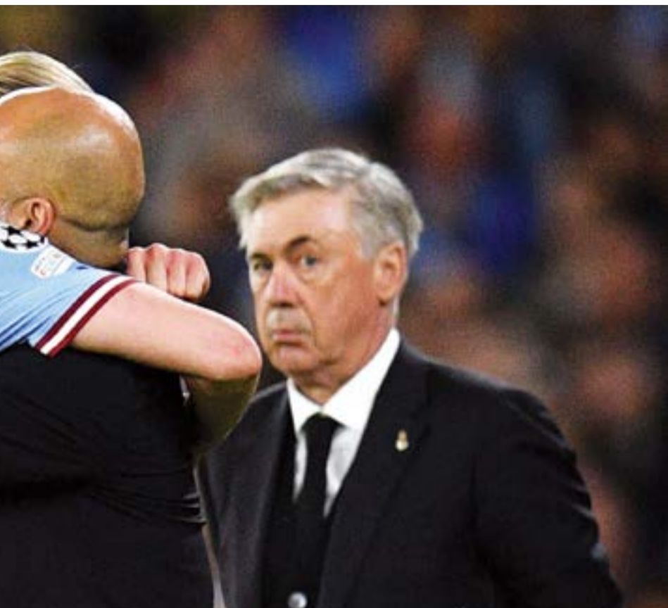
مدرب الريال أنشيلوتي يشاهد معانقة وغوارديولا وهالاند بغيرة

دور رودري المؤثر، كمايسترو يؤدي نفس دور وكفاءة بوسكيتس في سنوات صعوده تحت قيادة بيب في عصر البارسا الذهبي. الشاهد عزيزي القارئ، أنها مؤشرات عصر هيمنة وسيطرة سماوية على القارة العجوز في المرحلة القادمة، شريطة أن تكتمل للنهاية، وينجح في كسر العقدة في نهائي ملعب «أتاتورك»، فهل تعتقد عزيزي القارئ أن غوارديولا سيسير على خطى السير اليكس فيرسون وينجح في اقتناص ثاني ثلاثية في تاريخ أندية البريميرليغ كبداية لحقبة جديدة في إنكلترا وأوروبا؟ أم سيكون لسيموني إنزاغي ورجاله رأي آخر؟ هذا ما سنتناوله معا عندما يحين موعد النهائي.