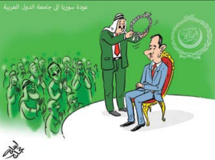
عودة سوريا الى جامعة الدول العربية

وكان يظنّ أنّها حجر الزاوية في رغد الخصب ولين