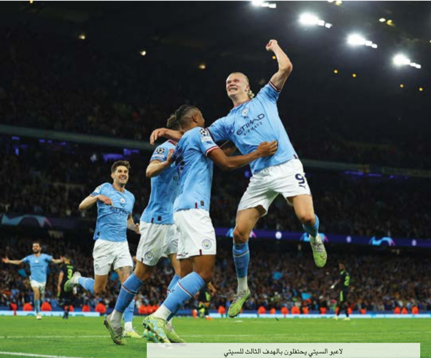
لاعبو السيتي يحتفلون بالهدف الثالث للسيتي